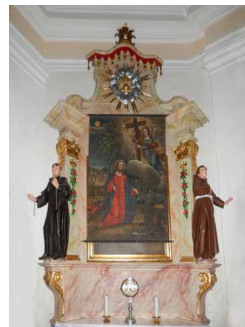
Trboje, Kristus poti krvavi pot v vrtu Getsemani