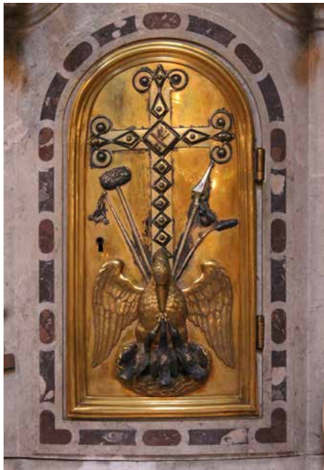
Vratca tabernaklja na oltarju sv. Antona Padovanskega v uršulinski cerkvi v Škofji Loki