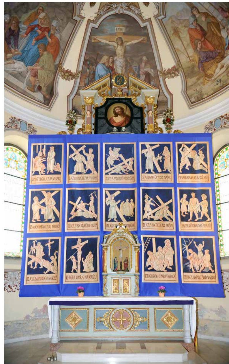
Križev pot, digitalni tisk, 540 cm x 460 cm, 2008