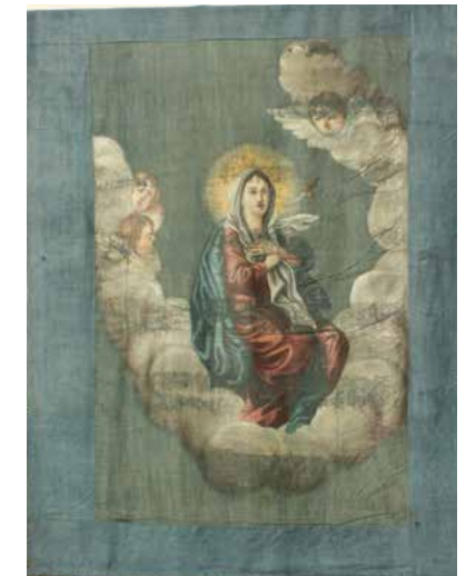
Žalostna Mati Božja (Marija v oblaku z angeli), 120 cm x 85 cm, jajčna tempera, platno