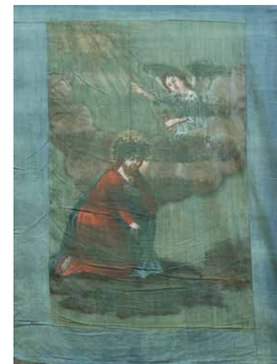
Oljska gora (Kristus, angel s kelihom), 120 cm x 85 cm, jajčna tempera, platno