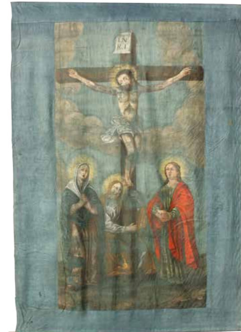
Križanje (Kristus na križu, sv. Magdalena, Mati Božja, sv. Janez), 165 cm x 85 cm, jajčna tempera, platno