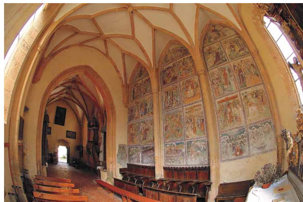
Andrej iz Ottinga, Pasijonski cikel, cerkev sv. Duha v Slovenj Gradcu, 1490/1496, foto Tomo Jeseničnik

naslednjega leta in ga obesili na steno kapele, kjer je bil stranski oltar sv. Barbare. Vizitatorji so namreč smatrali, da v kapelah ni primerno imeti še stranskih oltarjev in so pogosto naročali, da se le-ti odstranijo. Dovolimo si predpostavljati, da so s tem »odvečni stranski oltar kapele« zakrili s postnim prtom, ki ga je vizitator opazil in to skrbno zabeležil! Pospravili pa so postni prt z glavnega oltarja župne cerkve sv. Križa verjetno na večerno vigilijo velikega četrtega. Čez dobrih sto let se je to na enak način še vedno dogajalo po naših cerkvah, če sodimo po diariju župnika Kalina iz leta 1777. K temu je častitljivi starološki župnik, gospod Leopold še dopisal, da »so po večerni maši brez petja razkrili oltarje, beroč spev: Razdelili so si moja oblačila itd.« 9