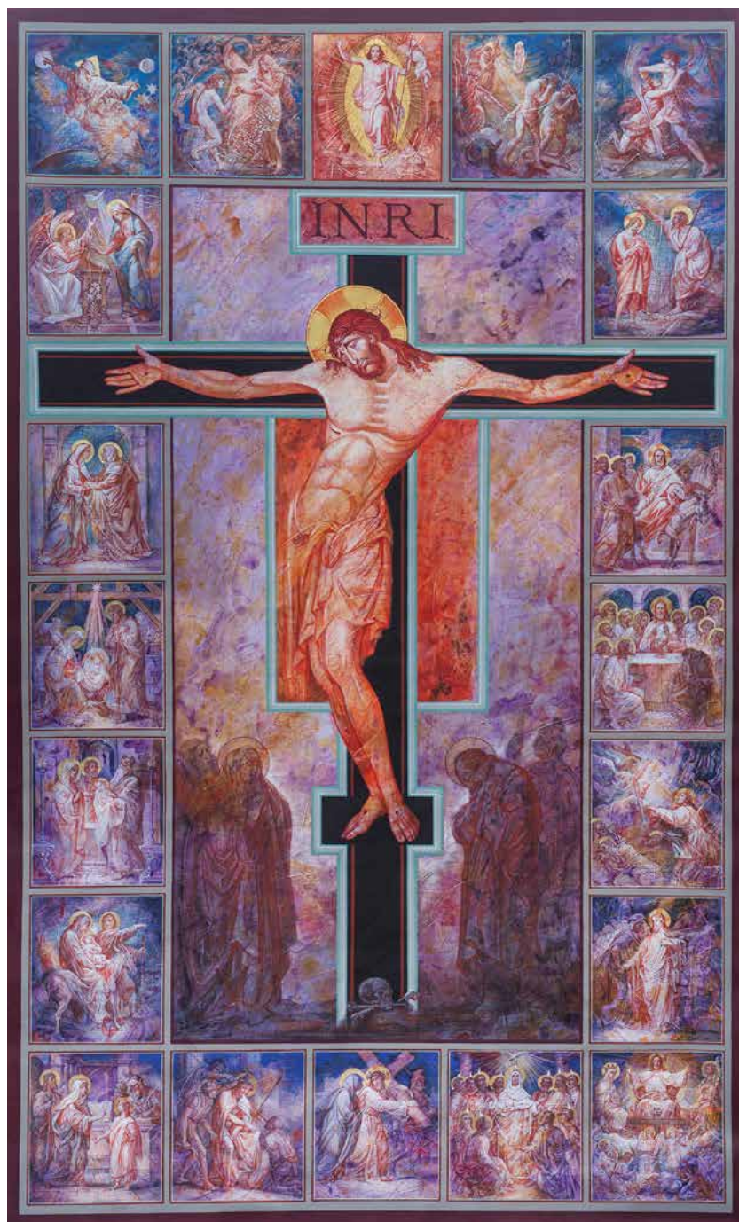
Maša Bersan Mašuk, Postni prt za baziliko na Brezjah, akril na juti, 360 cm x 220 cm, 2018, foto Klemen Kunaver