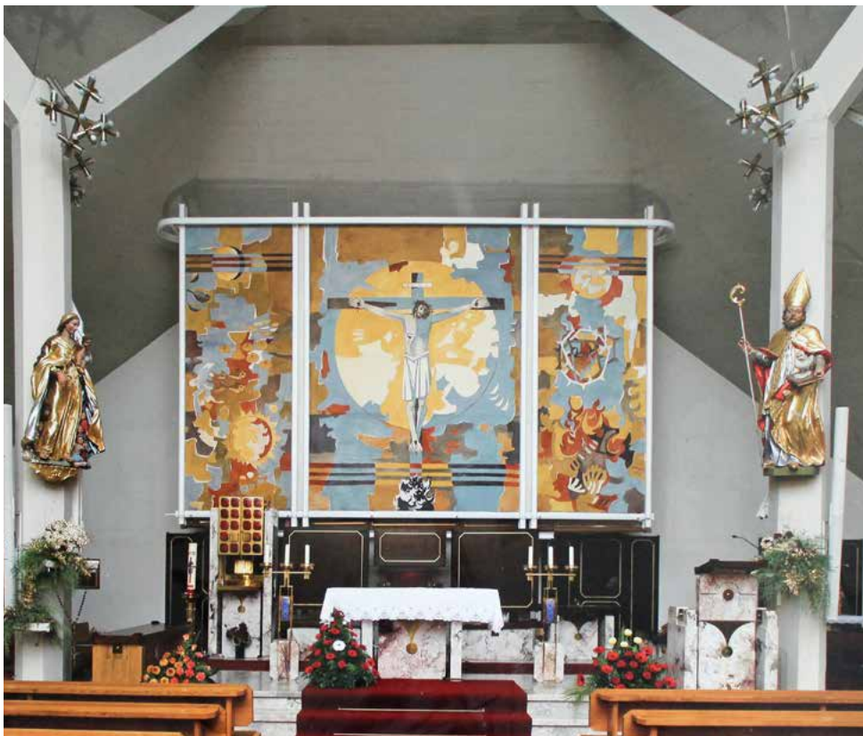
Stane Kregar, oltarna slika, freska, 670 cm x 450 cm, župnijska cerkev sv. Martina, Poljane nad Škofjo Loko

V prezbitteriju cerkve v Poljanah nad Škofjo Loko imajo oltarno fresko slikarja Staneta Kregarja (1905-1973), duhovnika, slikarja in učitelja. Je avtor številnih sakralnih del, barvnih oken, fresk, mozaikov, oltarnih slik in bogoslužnih oblačil. Leta 1971 je za življenjsko delo prejel Prešernovo nagrado.