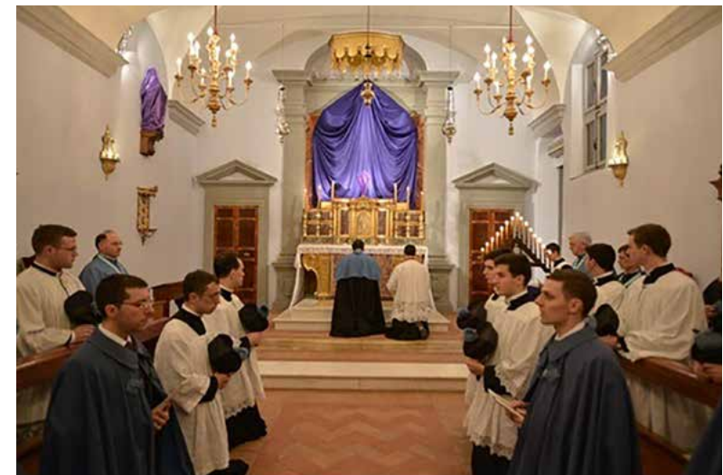
Maša ad orientem, (proti liturgičnem vzhodu) v postnem času v stari cerkvi sv. Jakoba v ljubljanskih Dravljah, glej opombo 11

Danes na Slovenskem s postnimi prti po večini ne zakrivamo več oltarnih slik, niti oltarnih nastavkov, še manj celotnega prezbiterja. Po drugem vatikanskem koncilu (1962 - 1965) je prišlo do temeljite prenove Cerkve in s tem tudi liturgije. Ob tem je že tako usihajoč običaj zakrivanja in odkrivanja postnih prtov praktično zamrl. Običaj prekrivanja križev pa je še ponekod v navadi. Običaju so se pridružili tudi mladi v združenju Juventutem, z obujanjem »tradicionalne latinske maše«, gre za sveto mašno opravilo po rimskem obredu katoliške cerkve. Pri tej sveti maši v stari cerkvi sv. Jakoba v Dravljah, kakršna se je obhajala od konca 6. stoletja (Gregor Veliki) do izdaje rimskega misala pod blaženim papežem Pavlom VI. leta 1996 v postnem času prekrijejo oltar in križ z vijoličnim pregrinjalom. 11