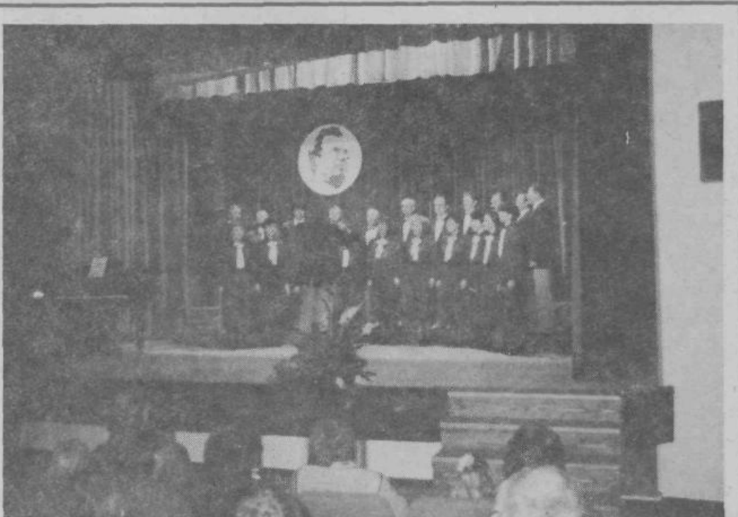
Krajani Grosuplja so praznik republike 29. november počastili malo drugače kot sicer. Udeležili so se kulturne prireditve — revije pevskih zborov, na kateri so zapeli: otroški in mladinski zbor OŠ L. Adamiča Grosuplje, ženski zbor iz Grosuplja, moški zbor iz Šmarje—Sap in mešani pevski zbor Gradbenege podjetja Grosuplje (na fotografiji). Prireditve je potekala brez napovedovalca, vsak zbor je na kratko predstavil in povedal nekaj besed o njihovem delu eden izmed pevcev zbora.