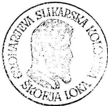
Žig Groharjeve slikarske kolonije.

Upravni odbor je razpisoval teme posameznih kolonij. Povabljeni umetniki so slikali v Škofji Loki in okolici. Čas trajanja kolonije naj bi bil, po osnutku statuta, vezan na ŠPP (od 15. julija do 15. avgusta); pozneje so termin prestavili za več kot mesec dni nazaj. Prva kolonija 7 (1967) se je