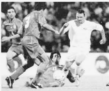
Cimerotič med tremi Izraelci