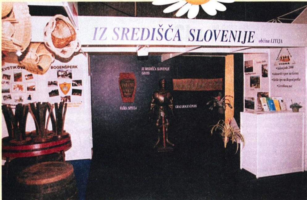
Foto: Razstveni prostor občine Litija.