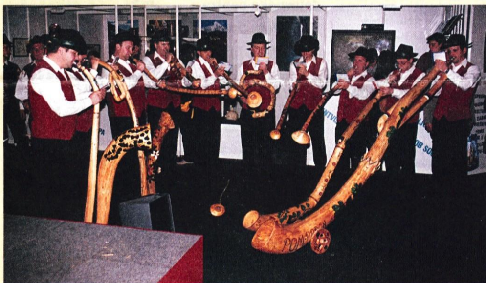
Nastop Lesenih rogov iz Kresnic na skupnem prireditvenem prostoru.