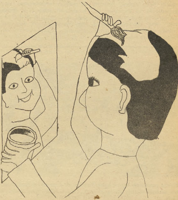
„Beli si glavo“ (Suzana Cvetkovič, 5. razred, Kranj)