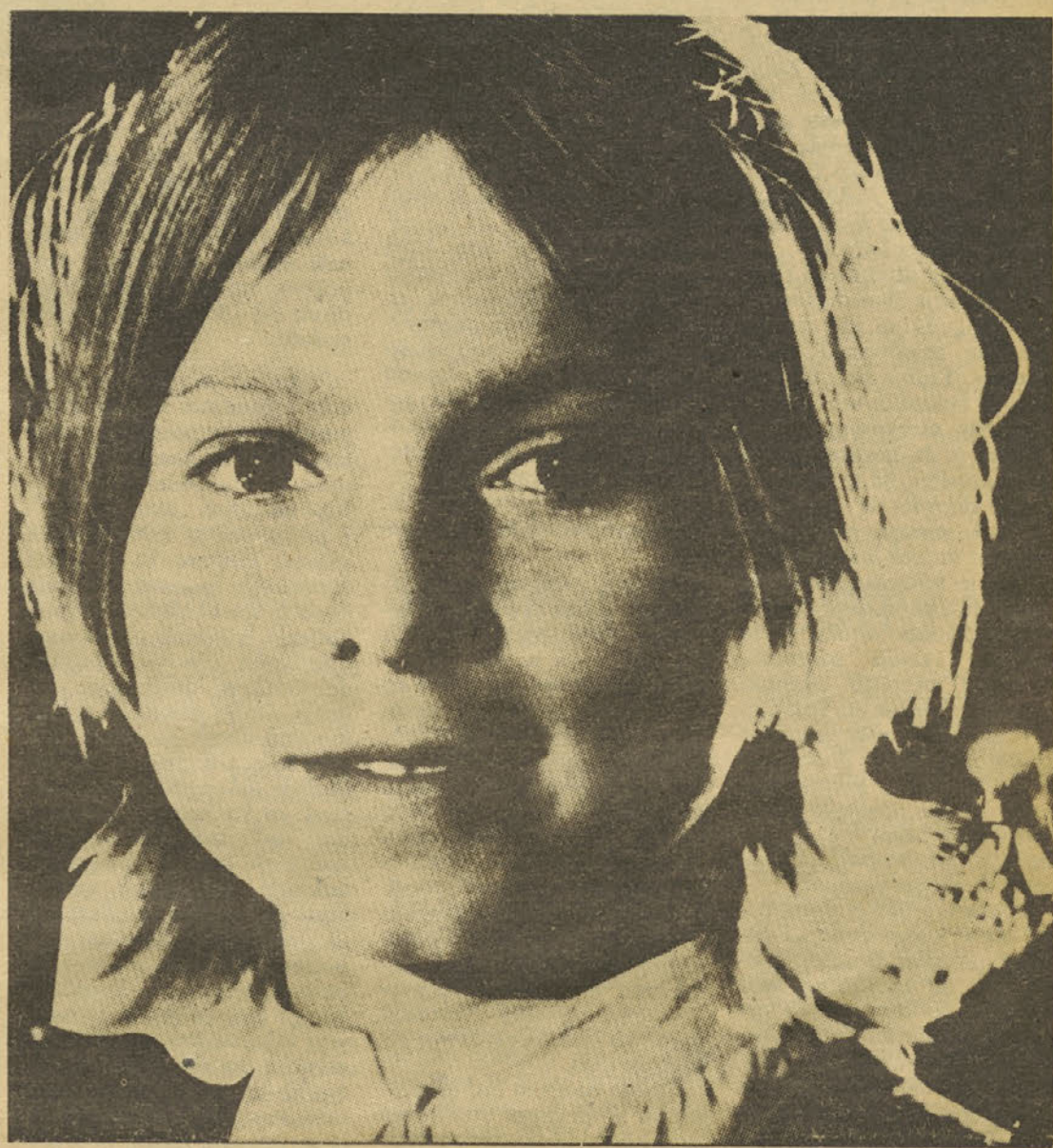
Kjer sem, tam je lepo