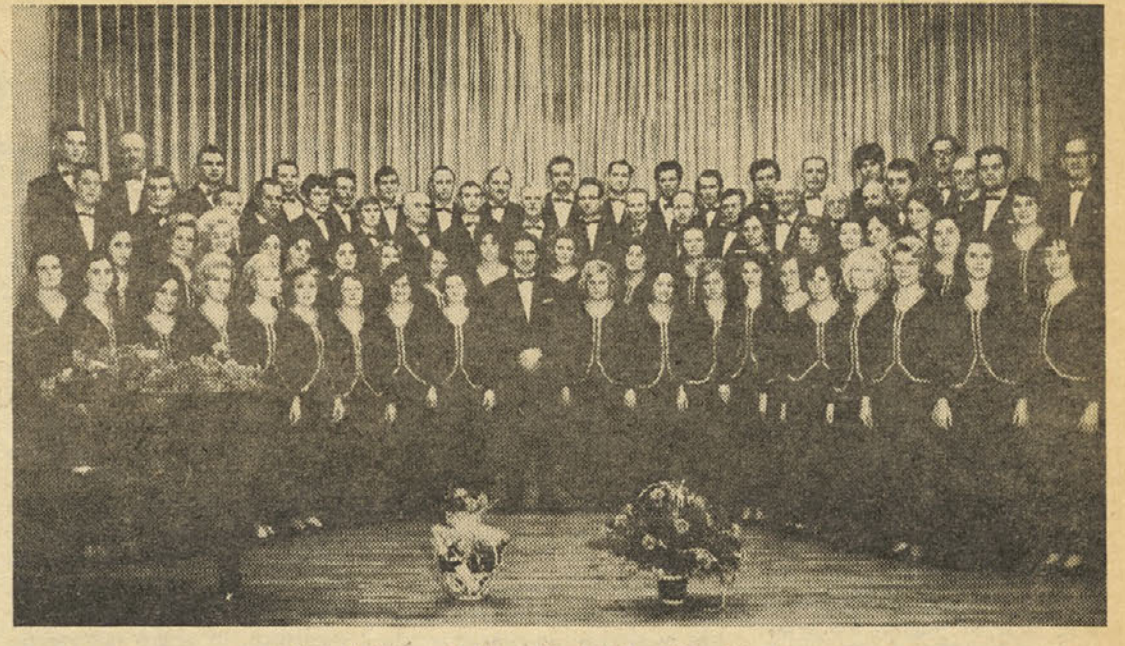
Učiteljski pevski zbor „Emil Adamič“ pri nastopu

UPZ »Emil Adamič« na letnih vajah in turneji po Zahodni Nemčiji