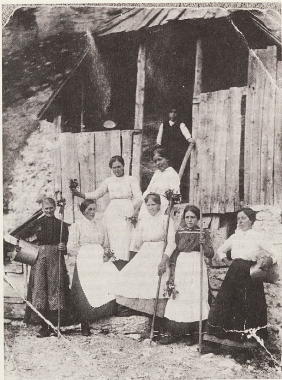
MAJERICE NA VELEM POLJU, PRED KRUCMANOVIM STANOM NA VELEM POLJU PRED PRVO SVETOVNO VOJNO.