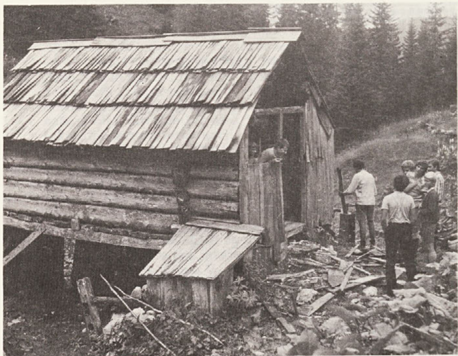
PLANINA JEZERO, OKOLI LETA 1975. STAN NA KOBILAH UŽIVAJO NAJEMNIKI KOT POČITNIŠKO HIŠICO.