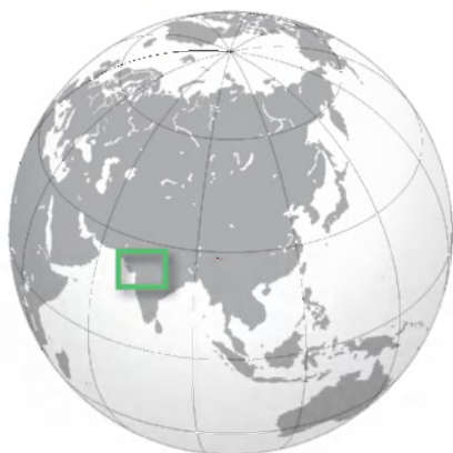
Slika 1: Lega Radžastana (21).

Radžastan, ki se razprostira na severozahodu Indije, meri 342.239 km 2 (12, 17), kar je 11 % ozemlja države. Po površini največja zvezna država (15) ima 68,6 milijona prebivalcev (13) in visoko povprečno gostoto poselitve 200,5 prebivalca na kvadratni kilometer. Gostota prebivalstva se med posameznimi območji pomembno razlikuje, predvsem med sušnim zahodnim in bolj namočenim vzhodnim delom (3, 6). Radžastan na zahodu in severozahodu meji na Pakistan (14, 17), na severu in severovzhodu na zvezni državi Pandžab in Harjana, na vzhodu in jugovzhodu na zvezni državi Utar Pradeš in Madža Pradeš, na jugozahodu pa na zvezno državo Gudžarat.