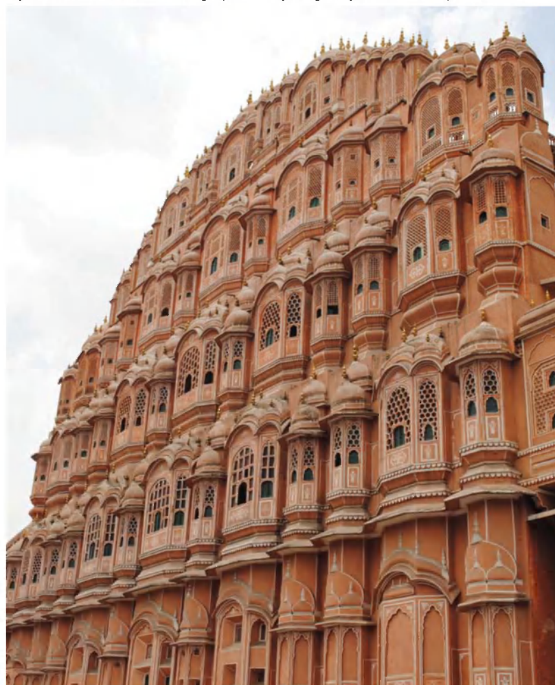
Slika 5: Pročelje Palače vetrov (Hawa Mahal) v Jaipurju, ene od najbolj prepoznavnih objektov kulturne dediščine v Jaipurju in Indiji nasploh.

Jaipur je kot manjša naselbina obstajal že v 12. stoletju, ime pa je dobil po svojem ustanovitelju Jai Singhu