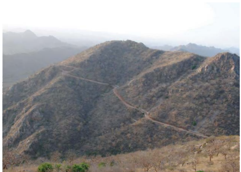
Slika 2: Hribovje Aravalli razdvaja Radžastan na dve naravogeografsko različni enoti.

Pomanjkanje vode in čedalje pogostejša in daljša suša vplivata na dezertifikacijo. Na njeno intenzivnost je vplival tudi človek s pretirano pašo živine in intenzivno obdelavo zemljišč, kar je povzročilo dodatno erozijo. Tar je zagotovo najgosteje poseljena puščava na svetu, saj tamkaj na enem kvadratnem kilometru živi povprečno 60 ljudi.