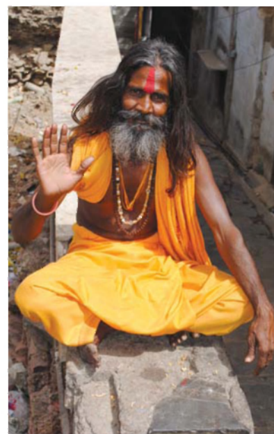
Slika 7: Vernik v Udaipurju.

Turizem je pomembna gospodarska dejavnost tudi v Udaipuru, ki je drugo najbolj obiskano mesto v Radžastanu (20). Udaipur je namreč izjemen kulturni spomenik, saj je v njem in njegovi okolici veliko palač in dvorcev. Obiskujejo ga tuji in domači turisti. Čeprav obiskovalce najbolj privlačijo številni ohranjeni templji, večina turistov mesto obišče zaradi drugih ciljev (20). Zaradi privlačnega okolja je pogosta izbira indijskih mladoporočencev, ki tu preživljajo medene tedne (7). Turizem pomembno vpliva na prostorski razvoj, saj je v mestu veliko hotelov, restavracij in trgovin. Turizem po-