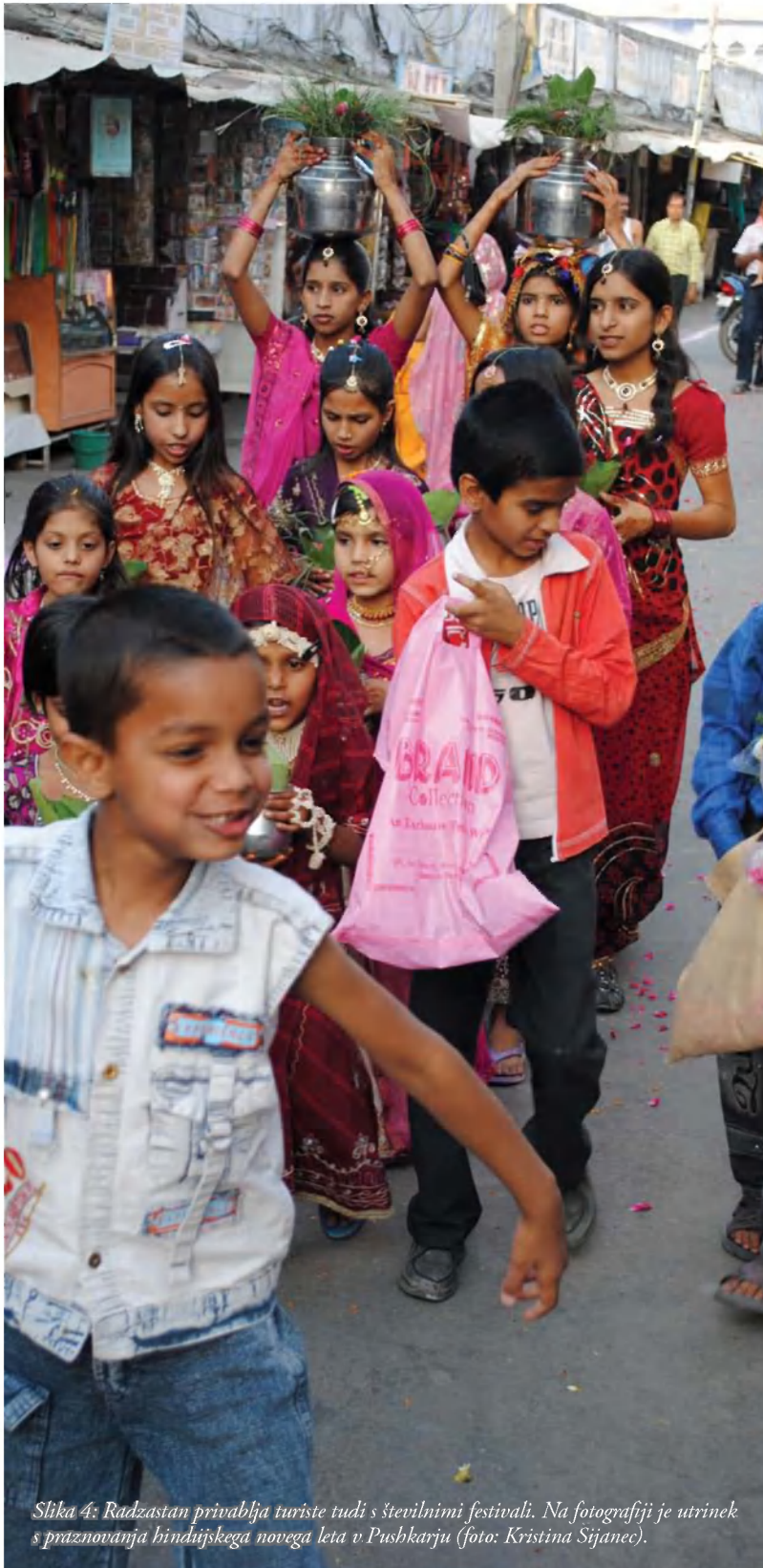
Slika 4: Radžastan privablja turiste tudi s številnimi festivali. Na fotografiji je utrinek s praznovanja hindujskega novega leta v Pushkarju.

Arheološke najdbe pričajo, da je bilo območje Radžastana poseljeno že leta 3000 pr. n. št., skozi zgodovino pa je pripadalo različnim kraljestvom. Ena najpomembnejših dinastij so bili Rajputi, ki so vladali od 5. do 16. stoletja (2, 3, 12), z vmesno prekinitvijo ob vpadu muslimanov na posamezna območja v 11. stoletju (2). V 16. stoletju so Rajpute ponekod začeli izrivati Moguli, ki so vladali severnemu delu Indije in so danes najbolj znani po arhitekturi. Na razvoj Radžastana so pomembno vplivali Britanci, ki so v drugi polovici 19. stoletja imeli pod nadzorom skoraj celo državo. Kolonialni voditelji so socialni položaj prebivalcev izboljševali z ustanavljanjem šol in univerz, promet so posodabljali z izgradnjo železniškega omrežja, vzpostavili so tudi učinkovito upravo. Na drugi strani so zaradi visokih davkov in izkoriščanja indijskih naravnih dobrin, ki so jih predelane drago prodajali lokalnemu indijskemu prebivalstvu, doživljali njegove upore, ki so vrh dosegli v prvi vojni za neodvisnost leta 1857. Takrat je radžastansko plemstvo podpiralo Britance, saj je bilo v zameno za zvestobo deležno številnih materialnih dobrin (2, 3).