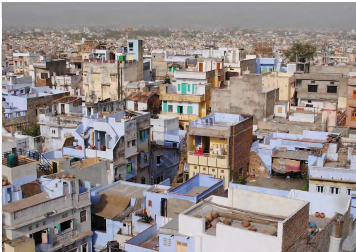
Slika 3: Hitra rast števila prebivalcev se odraža v morfologiji radžastanskih mest. Na fotografiji je mesto Udaipur, ki je po številu prebivalcev primerljivo z Ljubljano.

Onesnaženost okolja je posebej problematična na jugu Radžastana. Najbolj prizadeta so območja, na katerih pridobivajo marmor, kjer je okolje obremenjeno tudi s hrupom (2). Precejšen okoljski problem je tudi deforestacija, zlasti na območju Aravallija. Izsekavanje se je po razglasitvi neodvisnosti Indije močno pospešilo. Pred tem so namreč Britanci prebivalcem prepovedovali izsekavati gozdove, saj so jih plemiči uporabljali kot lovna območja (2). Samo med letoma 1980 in 1984 se je površina gozda zmanjšala za kar 41,5 % (3).