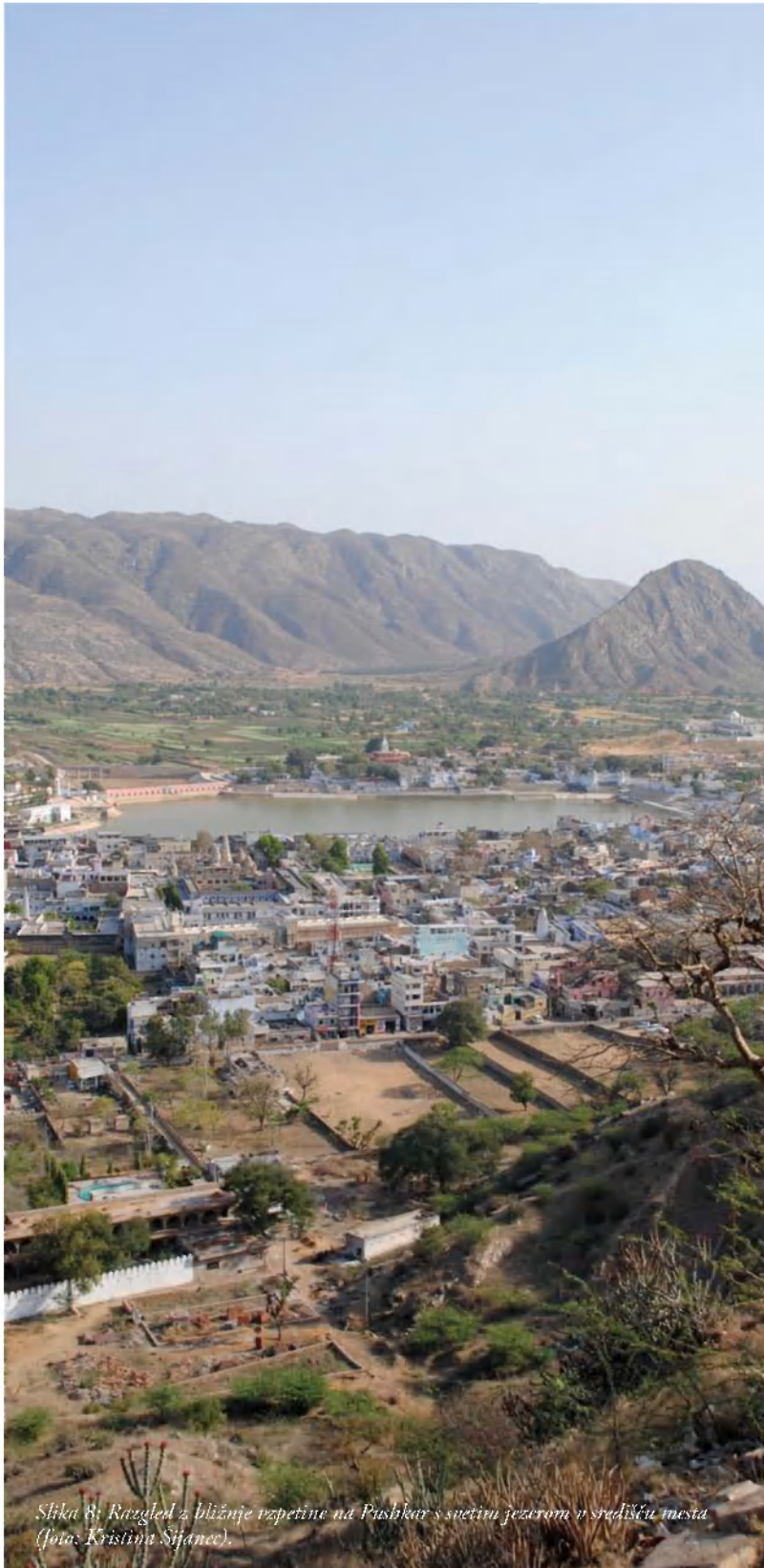
Slika 8: Razgled z bližnje vzpetine na Pushkar s svetim jezerom in središču mesta (fot. Kristina Sifanec).

Zaradi lege v neposredni bližini Ajmerja je Pushkar razmeroma lahko dostopen. Ajmer se je namreč razvil ob železnici, ki je v Indiji najbolj učinkovito prometno sredstvo. Ima neposredno povezavo z Jaipurjem (1), od katerega je oddaljen le 130 km (2), in z Delhijem. Zaradi velikega turističnega pomena so avtobusne povezave med Pushkarjem in Ajmerjem zelo pogoste (1).