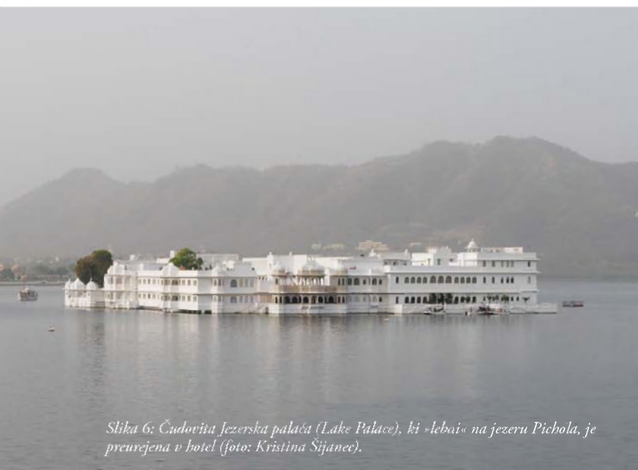
Slika 6: Čudovita Jezerska palača (Lake Palace), ki »leba« na jezeru Pichola, je prevečena v hotel.

večuje obremenjevanje okolja, saj se zaradi turistov porabi več vode, več je tudi odpadkov in gostejši je promet (2).