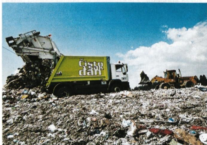
Pogled na posodobljeno odlagališče odpadkov Dob

Po položenem napadu iz hidranta, za katerega so bili zadolženi trije gasilci, sta dva napadalca z dihalnimi aparati izvršila napad na kletne prostore, trije gasilci pa so postavili svetlobni stolp, saj se je že mračilo. Napadalca sta ostala pred zaprtimi vrati, tako da sta morala vlomiti in streti obešanko na vhodnih vratih. Izvršila sta vstop po pravilih in naletela na mnogo ovir: klopi, vrvene prepreke, tunnel, pod katerim sta se morala plaziti do »ponesrečenca«. Prostor je bil tako zadimljen, da se ni videlo niti rok, osredotočiti sta se morala samo na otip. Po 12 minutah sta prišla iz objema dima s »ponesrečencom«. Po končani vaji je sledilo posprav-