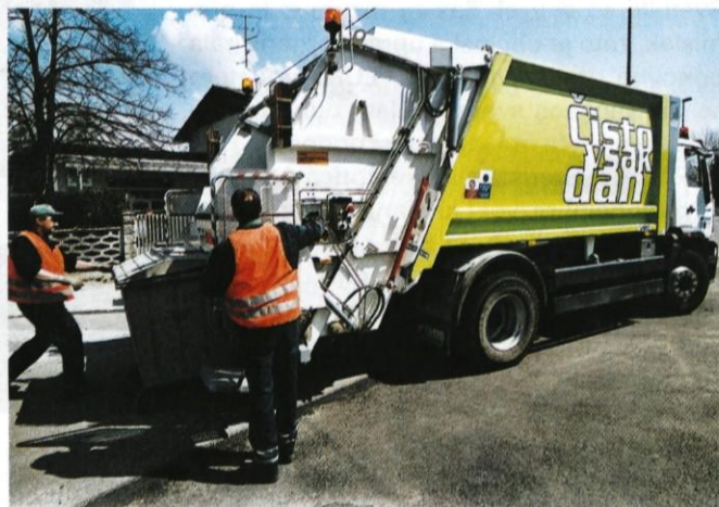
Eno od petih prenovljenih vozil za odvoz odpadkov JKP Prodrik

novih petnajst zabojnikov za zbiranje koristnih odpadkov ter zabojnik, opremljen za zbiranje in odvoz nevarnih odpadkov. Odlagališče Dob, ki je v svojem najstarejšem delu staro dobri dve desetletji in na katerem so samo v lanskem letu zbrali več kot 300 ton najrazličnejših odpadkov, tako postaja ena najbolje urejenih deponij v Sloveniji, komunalno podjetje Prodrik pa eno tistih podjetij, ki jim skrbi za okolje – in z njo tudi za prihajajoče generacije – pomeni prvenstveno nalogo in odgovornost.