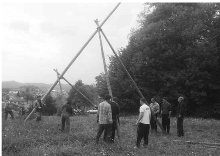
Jože in Pavla Horvat

Želimo si, da bi takšna srečanja postala tradicionalna.