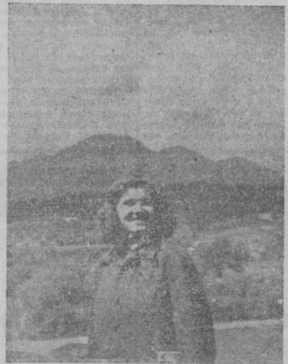
Tov. Kidričeva je komandant brigade v Slovenjgradu

Izkušnje prvih brigad bodo dobrodošle novim brigadam, ki odhajajo na področje mariborske in slovenjgraške gozdne uprave.