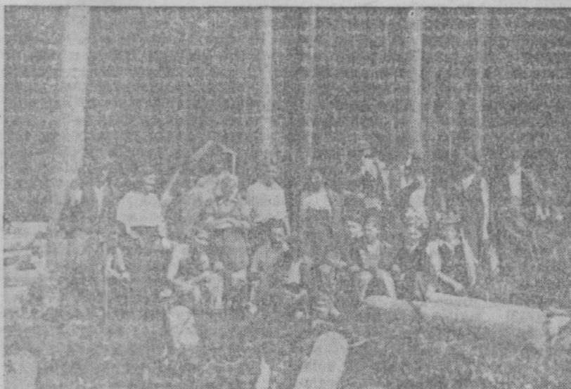
Brigada v Slovenjgradu po končanem delu