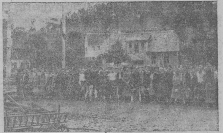
Zbor brigade v Vuzenici pred obedom