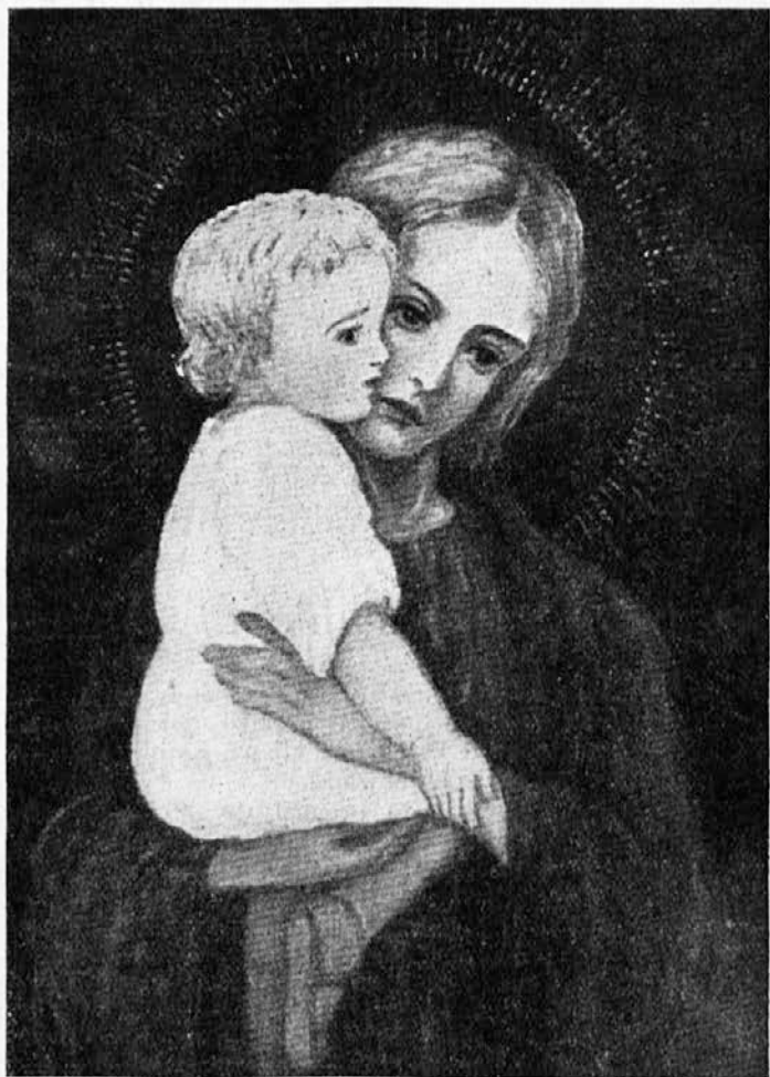
Luč v razsvetljenje nevernikov.