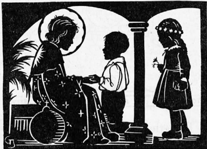
Otroci prinašajo Jezusu svoje žrtvice.

pridno izdelujte svoje naloge za šolo, borite se zoper lenobo in sladkosnednost. Od vas, ljubi otroci, zavisi mir v naši državi tudi za bodoče dni.