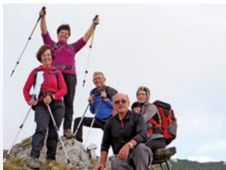
Pohodniki na Bašeljškem vrhu

Še vedno lepo, skoraj poletno vreme, nas je zvalo na nekoliko manjšega soseda Storžiča – na Mali Grintovec. Do izhodišča smo se pripeljali po dolini Kokre in pri Kanonirju zavili levo v stransko dolino pod vznožje Storžiča. Ob potoku Reka smo se po gozdni cesti vzpeli do izrazitega desnega ovinka pod Jekarico, kjer smo na primernem mestu parkirali. V breg smo krenili po dokaj širokem kolovozu, ki se je čez čas zožil in prešel v dobro uhojeno in označeno strmo pot proti Bašeljškemu prevalu. Ko smo prispeli do Praprotnikove kočice, nas je od razpotja na Bašeljškem prevalu ločilo še slabe pol ure hoje. S prevala