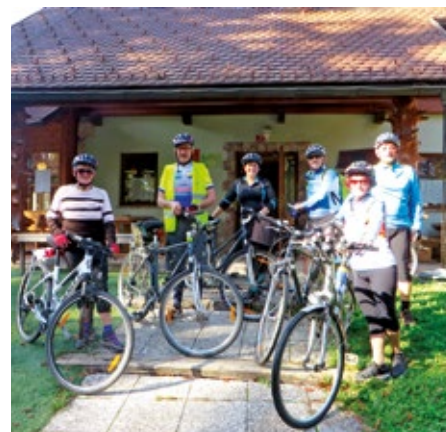
Kolesarji na zadnji turi letošnje sezone pri Planinskem domu v Komendi

Novembra, če bo dopuščalo vreme in bo še dovolj motivacije za pohajanje po vrhovih, bomo naredili še kakšen manjši pohod in na zaključnem srečanju s kolesarji, ki so že zaključili letošnjo sezono, pregledali uspešne rezultate letošnje sezone.