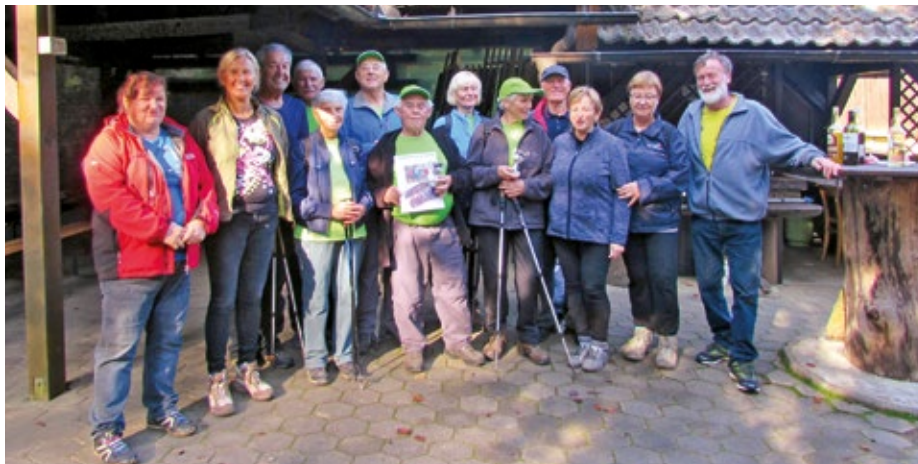
Skupinska slika s Trzinci

Najbolje pa sodelujemo s Trzinci, ki imajo svoj pohod na isti dan kot mi in nekaj njihove poti je enake naši poti, smeri pa sta nasprotni, tako se torej naši pohodniki srečajo z njimi. Oni pridejo iz Trzina na Dobeno in potem na Rašico, naprej do kočice SD Strahovica na Selu, kjer jim postrežemo z malico in pijačo, po kratkem postaniku se odpravijo proti Mengeški koči. No, naši pohodniki gredo najprej na Rašico, kjer prvič žigosajo kartonček, potem se spustijo na Dobeno in spet pritisnejo žig na turistični kmetiji pri Blažu. Od tu krenejo do spodnjega Dobena h gostilni pri Ručigaju, spet pridobijo še en žig. Zdaj jim manjka samo še en žig, vendar morajo ponj do Mengeške kočice, ki je nekoliko bolj oddaljena, kot prvi trije postanki. Vendar se ta pot vije skozi jesenski gozd, vseskozi se nekoliko spušča navzdol,