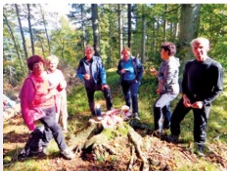
Zaslužen počitek in okrepčilo s »kavico na nivoju« na vrhu Basališča

Na pot smo krenili s Paškega Kozjaka, do katerega vodi cesta, ki se od glavne ceste med Velenjem in Mislinjo odcepi pri kamnolomu. Do dne, ko smo se odpravili na Basališče, mi je bil ta vrh neznan, pa tudi za Paški Kozjak sem mislil, da je to hribovje med Celjsko kotlino in Pohorjem in ne vasica na tem hribovju. Na koncu vasi je planinski dom, ki je že zaprt, od katerega vodi lepo označena pot proti Basališču. Pot proti vrhu je speljana po grebenu in preko več manjših vrhov, kot bi hodil po zmajevem hrbtu. Majhna višinska razlika med planinskim domom in Basališčem se tako skoraj potrjuje. Pot vodi skozi gozd in sem ter tja se odprejo pogledi proti Pohorju in Mislinjski dolini. Tudi vrh Basališča