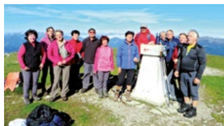
»Gasilski posnetek« pohodnikov na vrhu Blegoša