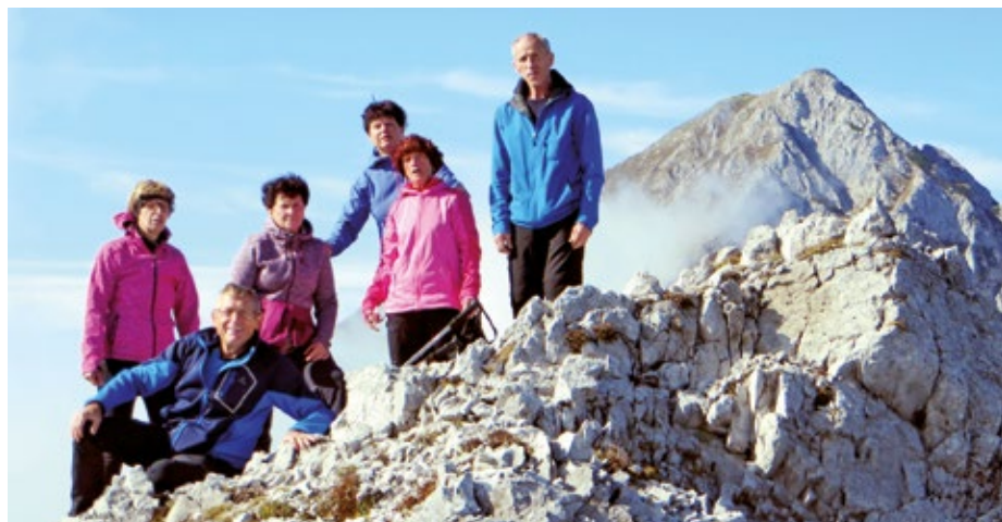
Na vrhu Malega Grintovca - v ozadju njegov sosed Storžič

vodijo steze na Storžič, proti kočici na Kališču in v levo preko Bašeljškega vrha do našega cilja na Malem Grintovcu. Krenili smo levo po potki skozi ruševje in se kmalu po osvojenem predvrhu povzpeli na Bašeljski vrh (1744 m), od koder smo lepo videli naš končni cilj. Do njega pa je bilo treba premagati še marsikatero zadržago. Pot se z Bašeljškega vrha najprej po grebenu skozi ruševje strmo spusti na Mačensko sedlo (1615 m), od koder se znova močno postavi pokonci in nas skozi ruševje, v okljukih pripelje na zeleni cilj. Kljub temu da so se že začele dvigati meglice iz doline, je bil razgled odličan, še zlasti na bližnji Storžič, Kočno na drugi strani, Stegovnik, verigo Košute, na Jezersko stran in avstrijske hribe, na ravnino pod Storžičem proti Kranju in Ljubljani. Ob klopici na vrhu smo naredili kratek počitek z manjšo zakusko in se zadovoljni z uspešno opravljenim pohodom vrnili po isti poti v dolino.