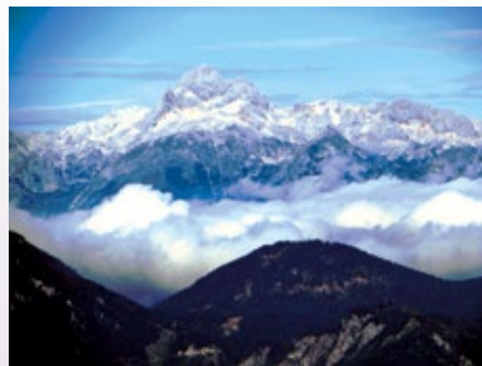
Pogled na Triglav z Blegoša