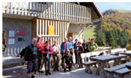
Pohodniki pred kočjo na Blegošu - v ozadju vrh Blegoša

Čeprav velika večina pohodnikov krene na Blegoš iz Gorenje vasi ali Hotavelj preko Črnega Kala, smo se mi odločili za nekoliko daljšo in zanimivo pot iz Leskovice. Iz Poljanske doline zavije cesta levo mimo Hotavelj po dolini do Kopačnice, kjer se začne strmo vzpenjati do Leskovice. Avto smo pustili na parkirišču ob cerkvi in krenili po dobro označeni poti, ki je v začetku asfaltirana, kmalu pa preide v lepo gozdno cesto. Po slabe pol ure hoje so nas table usmerile na bolj strmo stezo proti koči gorske straže in naprej skozi gozd. Med vzpenjanjem se nam je priključila pot iz vasi Laze. Pot nas je kmalu pripeljala iz gozda na slabšo