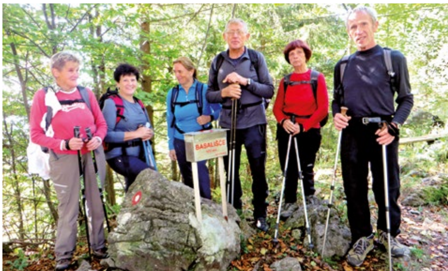
Posnetek za spomin pri obeležju vrha Basališča

je poraščen, in ko najdeš vrzeli med vejevjem, lahko opazuješ čudovito okolico med Pohorjem, Celjem in po dolini proti Dravogradu. Na vrh vodi pot iz več smeri: iz Dobrne, Vitavnja, Mislinje in po grebenu iz Paškega Kozjaka. Lepa in ne preveč zahtevna pot za vsakogar.