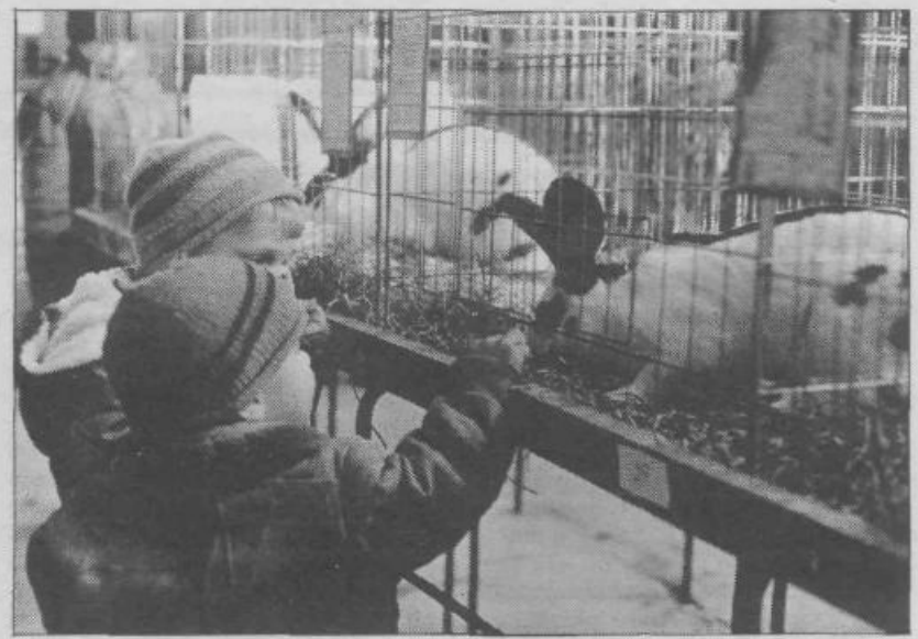
Z razstave izpred nekaj let