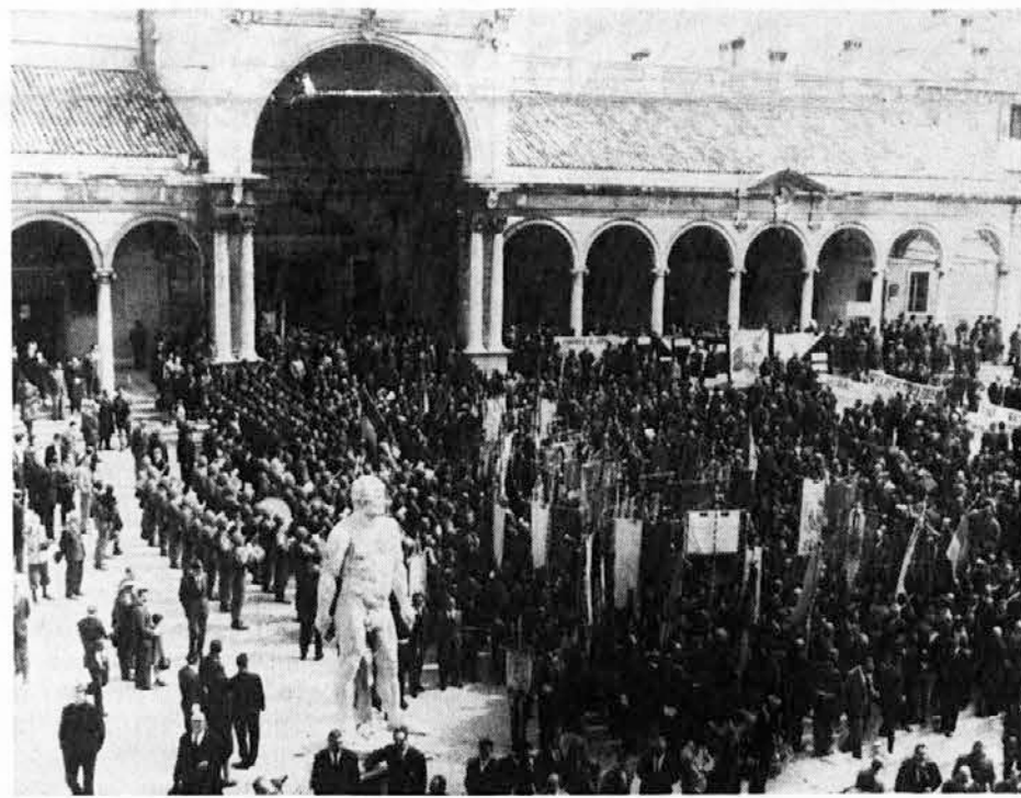
Pogled na množico ljudi na Trgu Svobode v Vidmu, ki se je udeležila proslave ob priliki 20-letnice osvoboditve