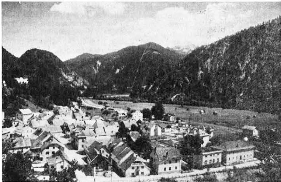
Ukve v Kanalski dolini, kjer se raztezajo mogočni gozdovi, na katere ima lokalno prebivalstvo starodavne servitutne pravice

Medtem ko bi želeli, da bi se v trbiških državnih gozdivih rešilo vse kar najbolje v korist boljše ekonomske politike, ki bi pomagala prebivalstvu, obljubljam našim čitateljem, da se bomo na to pereče vprašanje v kratkem povrnili.