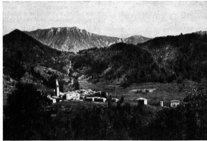
Platišče — Ljudje te vasi komaj čakajo, da bi popravili Most na Nadiži in vzpostavili avtobusno linijo, ki bi jih povezovala z Breginjskim kotom in Kobariško, ker bi tako izšli iz osamljenosti