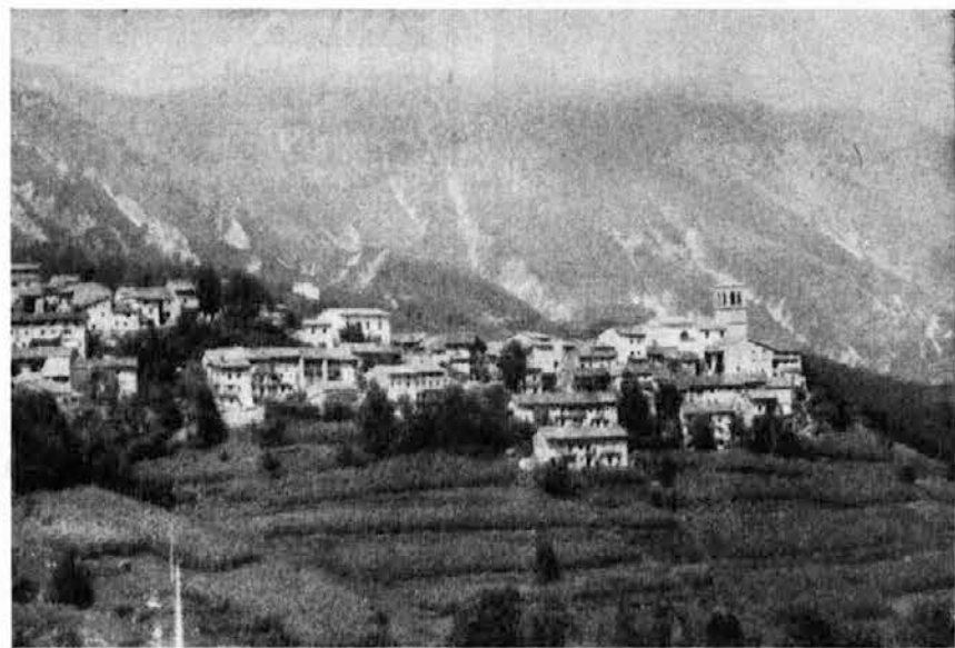
Brezje — Tu je še vse po starem, nikjer ni videti nič novega. Povsod se pozna, da ni dosti ljudi pri hiši. Njihove male njivice, ki leže visoko po strmih bregeh, ne dajejo dovolj, da bi se mogli vsi preživljati