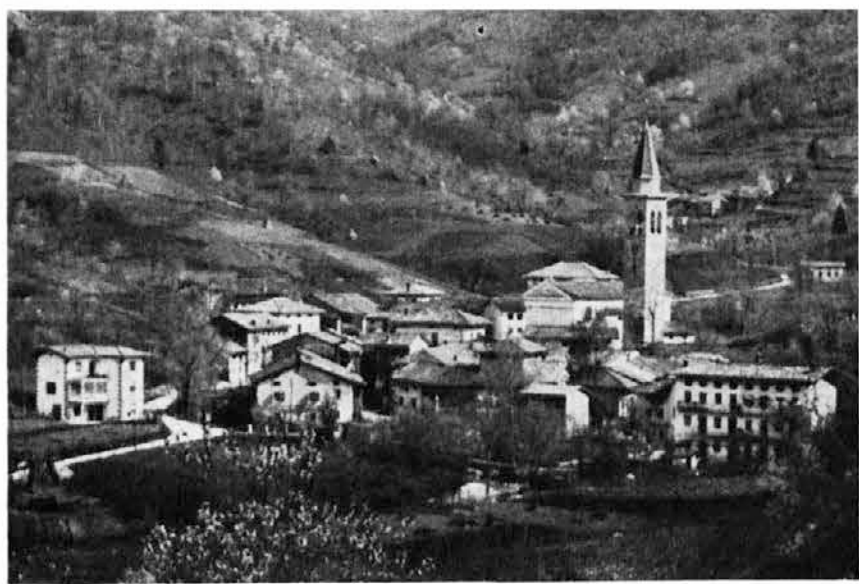
Tipana je zadnje čase zelo spremenila svoj videz. Popravili so več hiš in zgradili kakšno novo, pred župno cerkvijo pa so lani pokrili potok Gorgons, tako da je tam sedaj lep trg in parkirni prostor

Lani so v Sloveniji našli skupno 3,68 milijona turističnih nočitev, kar odgovarja 12 odstotkom vseh turističnih nočitev v Jugoslaviji. Inozemski turisti so lani v Sloveniji prebili 1,22 milijona noči, njihove nočitve pa so od leta 1962 poskočile za 75 odstotkov. Na turiste iz Zahodne Nemčije je lani odpadlo 335.000 nočitev, na turiste iz Avstrije pa 314.000. Potem so sledili Holanci z 92.000, Angleži z 80.800 in Švedski z 52.000 nočitvami.