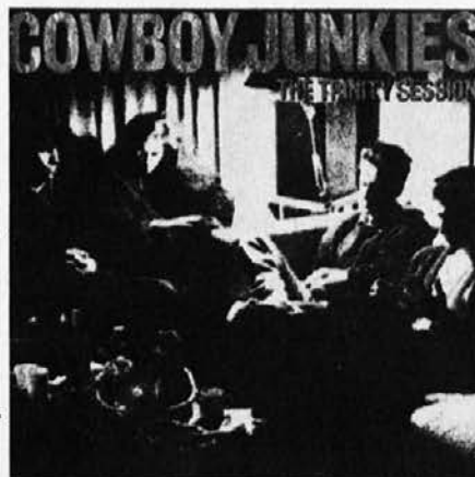
Cowboy Junkies - The Trinity Session

1962. Na vrhu lestvic na obeh straneh oceana še vedno ni posebnih novosti. Med velikimi ploščami v ZDA si že četrti mesec ne pusti blizu Elvis Presley s svojimi Modrimi Havaji , ki zdaj spet kraljuje tudi na britanskih lestvicah. 1962. Na obeh straneh velike luže mladi še vedno twistajo kot obsedeni. Na ameriškem Top 20 so kar štiri twist uspešnice: Chubby Checker: The Twist, Joey Dee & The Starlighters: The Peppermint Twist, Gary U.S. Bonds: Dear Lady Twist ter Billy Joe & The Checkmates: The Perculator Twist. Podobna je slika britanskega Top 30, kjer so zasidrane kar tri skladbe Chubbyja Checkerja: Let's Twist Again, Slow Twistin' ter Teach Me To Twist. 1962. V kategoriji malih plošč v ZDA najbolj odmeva rockabilly pevec Bruce Channel, katerega orglice z njegove (jasno!) od twista obsedene uspešnice Hey! Baby! okužijo tudi Please Please Me ter Love Me Do Lennona ter McCartneya. V tem mesecu pokupijo Angleži največ izvodov nove plošče Shadowsov: Wonderful Land. 1962. Izid prve velike plošče velikega folk upa Roberta Zimmermana alias Boba Dylana. 1962.