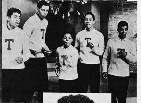
Frankie Lymon & The Teenagers