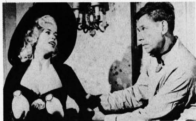
Prizor iz filma The Girl Can't Help It

(iz nastajajoče knjige o popularni glasbi, ki bo v jeseni izšla pri Znanstvenem in publicističnem središču)