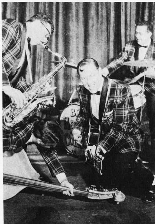
Bill Haley & The Comets

d) Chicaški rhythm & blues – so razvili črnski glasbeniki, ki so sodelovali z znanima bluesmanoma Muddyjem Watersom ter Howlin' Wolfom ter snemali za tamkajšnjo založbo Chess. Leta 1953 je Chess s svojo podružnico Checker postala ena prvih rhythm & blues založb, ki so se prebile tudi na pop tržišče z izvajalcema, ki sta svoje uspešnice posnela skupaj s črnskimi blues glasbeniki. To sta bila Bo Diddley ter Chuck Berry. Bo Diddley je odmeval predvsem s svojimi udarnimi nastopi ter je zanimiv predvsem zaradi svojih značilno sinkopiranih afriških (?!) ritmov. Še pomembnejši je bil Chuck Berry, s svojo glasbo ter besedili velja ob Presleyu za najvplivnejšega rock'n'roll glasbenika. Nanj so se sklicevali Beatli, Stonesi ter celo Bob Dylan. Njegova prva uspešna skladba Maybellene (1955) je bila narejena po zgledu memphiške rockabilly šole okoli založbe Sun. V