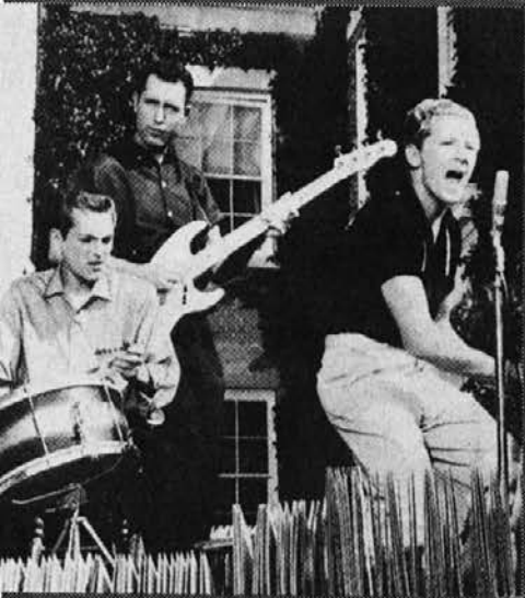
Jerry Lee Lewis