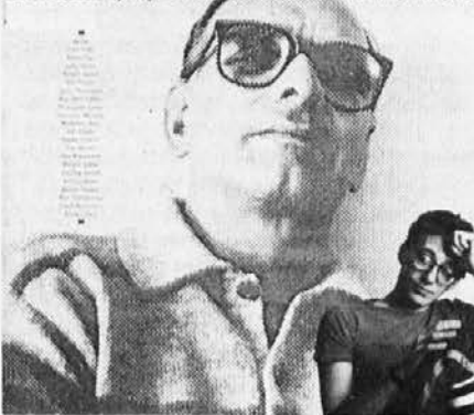
John Zorn : The Big Gundown

John Zorn plays the music of Ennio Morricone