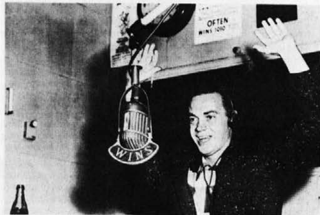
D.J. Alan Freed