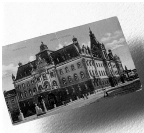
Slika 3: Poslopje Deželnega dvorca v Ljubljani, zgrajeno leta 1902, je leta 1919 postalo in je še danes centralna stavba ljubljanske univerze (Razglednica iz časa okrog leta 1914. 28 )

Prizadevanja za slovensko univerzo pred prvo svetovno vojno so se organizacijsko večinoma naslanjala na avstrijski model univerze s štirimi fakultetami: pravno, filozofsko, medicinsko in teološko. Tehnika je bila v Avstriji zunaj univerze in organizirana kot tehniška visoka šola. Po koncu prve svetovne vojne so se slovenski tehniki energično zavzeli za ustanovitev tehniškega študija v Ljubljani. Njihova prizadevanja so 19. maja 1919 privedla do ustanovitve tehničnega visokošolskega tečaja. Tako so se že pred ustanovitvijo univerze začela univerzitetna predavanja v Ljubljani, ki so potekala neprekinjeno od maja do novembra v prostorih tedanje državne obrtne šole na Aškerčevi cesti. 27