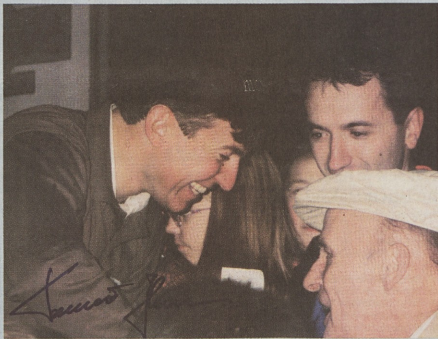
Pred desetimi leti, 11. novembra 1999, smo Kamničani z navdušenjem in občudovanjem pričakali in pozdravili našega Tomaža Humarja ob vrnitvi z Daulagirija. Za največji dosežek v zgodovini modernega himalajizma s prvenstvenim vzponom v alpskem slogu po osrednjem delu južne stene Daulagirija in trezno odločitev za sestop v pravem trenutku ter vrnitev k prijateljem mu je prav vsak želel stisniti roko. Tomaz pa je med nas hvaležno razdal svoj optimizem, iskričivo veselje in topel nasmeh.

Več o življenju in dosežkih Tomaža ter spominih nanj na 4. in 5. strani.