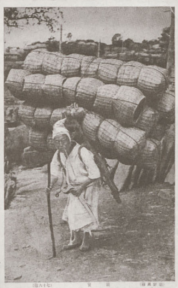
(圖六十七) 製 製 (製風製製)

Ob koncu leta 1920 in leta 1921 je bila v Panami in Čilu, nato pa je še istega leta odpotovala v ZDA. Iz tega časa so ohranjene razglednice iz Kalifornije, med