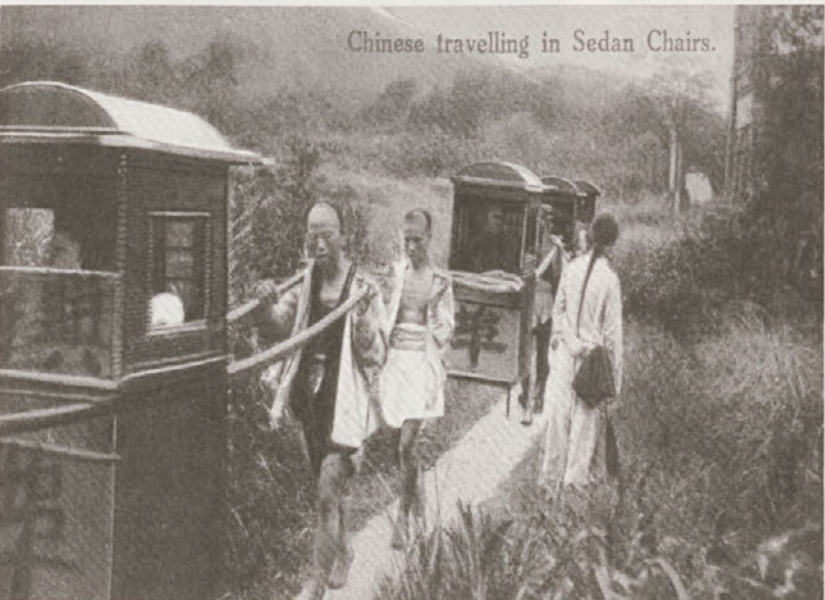
Kitajski nosači nosilnic, Sanghaj; PMC, inv. št. KR-370.

drugim tudi z mestoma San Francisco in Los Angeles.