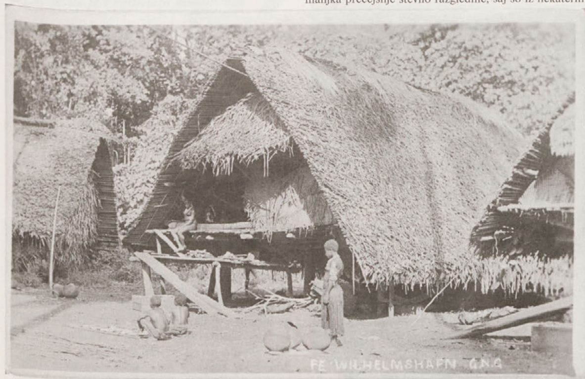
Naselje domačinov na Novi Gvineji; PMC, inv. št. KR-403.

Na žalost v njenem slikovnem popotnem dnevniku manjka precejšnje število razglednic, saj so iz nekaterih