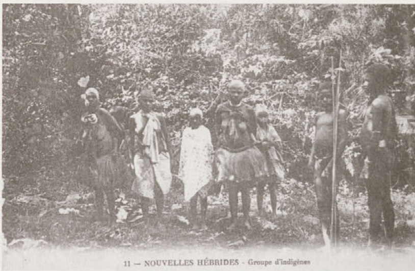
11 — NOUVELLES HÉBRIDES - Groupe d'indigènes

Na dolgi poti okrog sveta je našla mnogo prijateljev, ki so ji pisali po vrnitvi v Celje. Prvo razglednico po vrnitvi domov, ki je ohranjena, je dobila iz Avstralije oktobra leta 1928, sledile pa so ji še druge z različnih delov sveta, ki jih je obiskala, in ji vzbujale spomine na lepe ter težke trenutke na njeni dolgi poti okrog sveta.