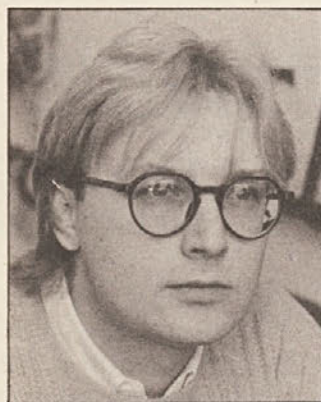
Janko Ferk: Am Rand der Stille . Edition Atelier, 1991.