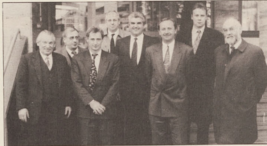
Minister Šešok (na sliki tretji z desne) se je srečal s koroškimi gospodarstveniki ter Enotno listo.

1. novembra je v 79. letu starosti umrl nekdanji minister dr. Heinrich Drimmel. Med leti 1954 in 1963 je bil dr. Drimmel minister za pouk in kulturo, torej v času, ko je prišlo tudi do ustanovitve Zvezne gimnazije za Slovence v Celovcu. Drimmel se je tudi po imenovanju za ministra osebno pogovarjal s predstavniki koroških Slovencev o šolski problematiki; vendar spremembe v manjšinskošolskem zakonu (odprave obveznega dvojezičnega pouka na dvojezičnih solah na dvojezičnem ozemlju Koroške) tudi on ni mogel preprečiti.