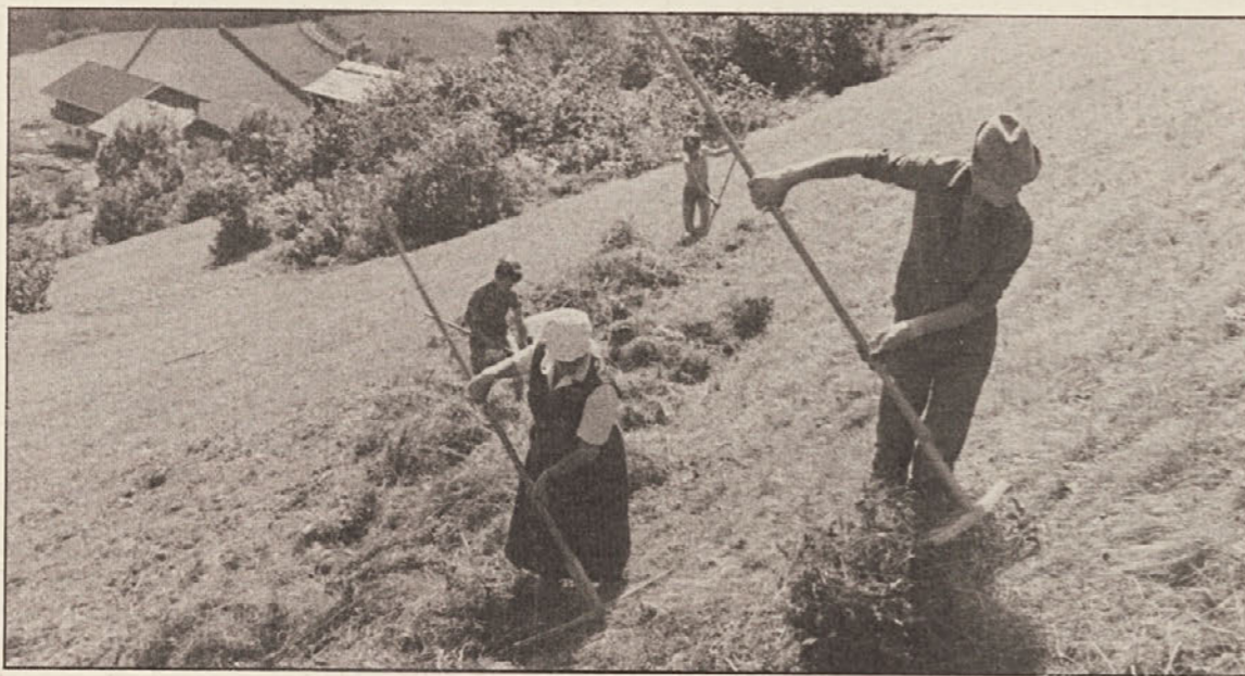
Skupnost južnokoroških kmetov se odločno obrača proti vstopu Avstrije v EGS. Predvsem gorski kmetje bi bili od nove gospodarske ureditve zelo prikrajšani. Njihov zastopnik SJK je Anton Höberl, gorski kmet z Djekš.