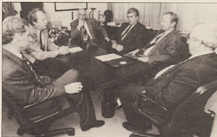
Minister Šešok je imel na Zvezi slovenskih zadrug pogovor tudi s predstavniki koroškega slovenskega gospodarstva.

Na povabilo Enotne liste je prišel pretekli teden na pogovore na Koroško slovenski minister za finance Dušan Šešok, ki se je srečal tudi z deželnim glavarjem Zernattom ter obiskal Zvezo slovenskih zadrug.