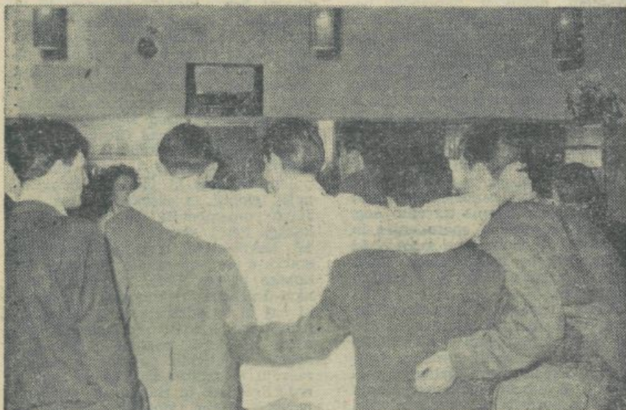
Ob pultu v študentskem naselju postanejo tudi tuji dobri prijatelji. Kolegi na naši sliki so svojega natakara vzeli v sredo in skupaj nekaj popili.

javnih brucovanj naj bi nikakor ne pomenila konec neke tradicije, ampak samo drugo, mogoče bolj posrečeno obliko.