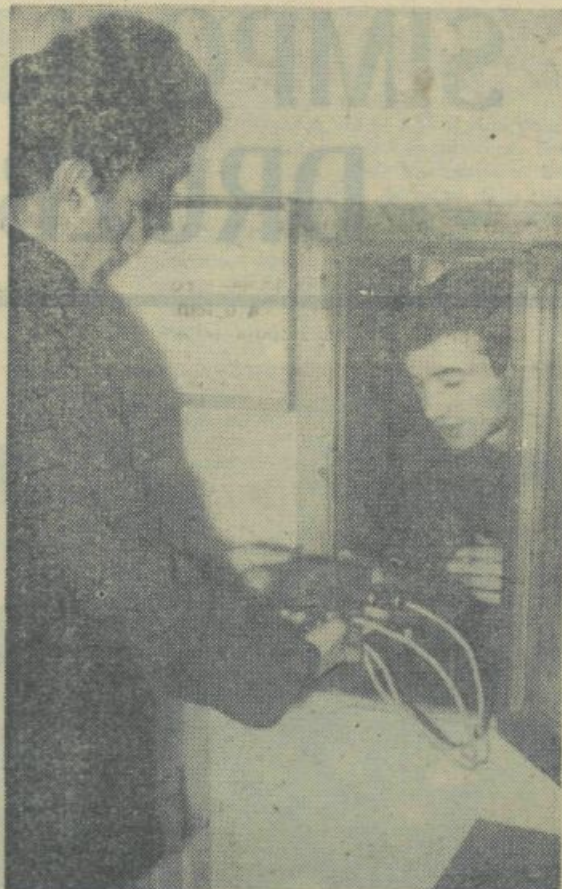
IZPOSODANJE KUHALNIKOV IN LIKALNIKOV SPADA V OBIČAJNO OPRAVILU DEŽURNIH ŠTUDENTOV V VRATARSKI LOŽI

Vsak večer si lahko kolegijaši ogledajo televizijski program. Če drugega ne, pa vsaj dnevnik. Ze pred štiri leti so v Kolegiju uredili klubsko sobo in jo opremili s televizorjem. Večkrat je ta prostor premaščen za vse, ki si želijo ogledati popularne zabavne oddaje, še večja gneča pa je, kadar prenašajo nogometne tekme. Tak je današnji Akademijski kolegij in njegovi stanovalci.