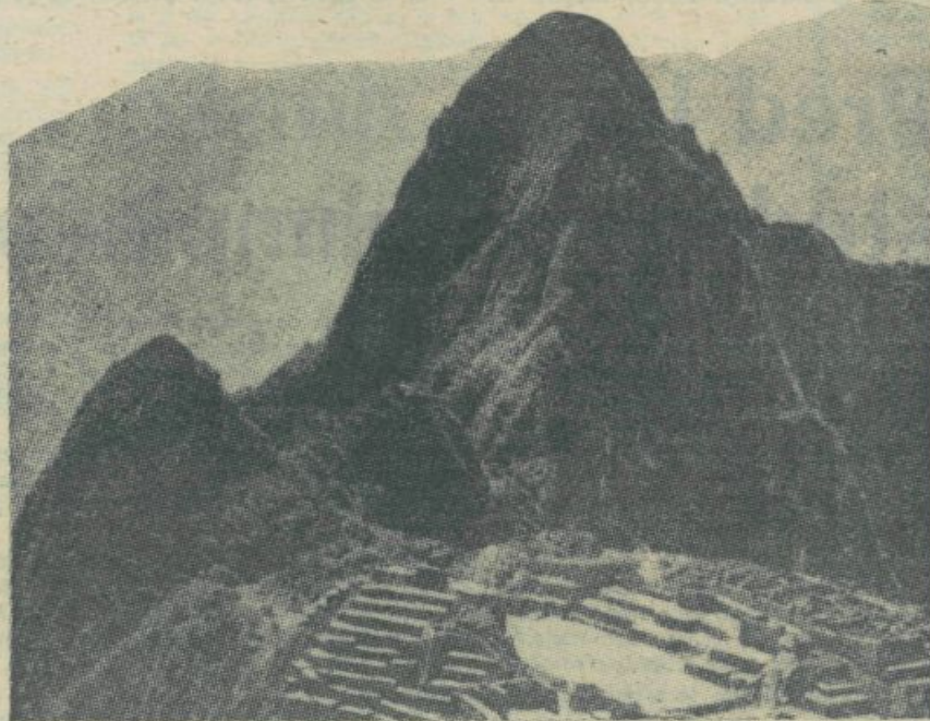
Starodavno mesto Inkov Macha Picho v južnih Andih v Peruju

standarda te province. Danes že normalno delajo agronomska, strojna, del filozofske fakultete, razen tega predvidevajo ustanovitev medicinske fakultete, kajti potrebe po zdravnikih so izredno velike. Ker je bilo organizirano šolstvo prekinjeno za daljše obdobje, se je čutilo precejšnje pomanjkanje solidnega znanja dijakov, ki so se vpisovali na fakultete. Posebni dopolnilni tečaji so dijaku, bodočemu študentu, izpopolnili pomanjkljivo znanje in ga