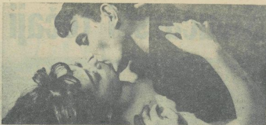
Prizor iz zahodnonemškega filma Svitane režiserja Wolfganga Strohmeyerja