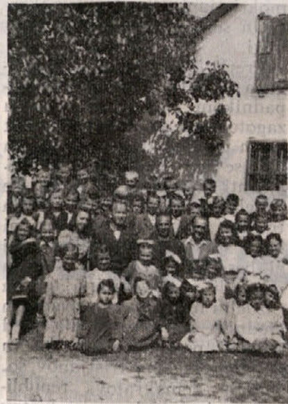
Obnovljena šola v Košani ob zaključku šolskega leta 1943/44

Pa še ena zelo žalostna dediščina je tedaj stala pred nami: znanje učencev. Znanja stvar je, da so se v italijanskih šolah za časa fašizma zelo malo naučili. Fašizmu je bilo na tem, da bi slovenski otroci čim manj znali. Računal je namreč, da bo prav na ta način lažje in uspe-