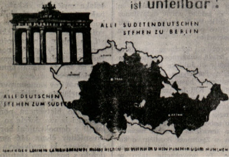
Današnji nemški revanšisti postavljajo enake ozemeljske zahteve kot nekoč Hitler. Gornja slika prikazuje posnetek nekega lepaka, ki so ga leta 1961 širili v Zahodni Nemčiji

das Selbstbestimmungsrecht ist unteilbar!