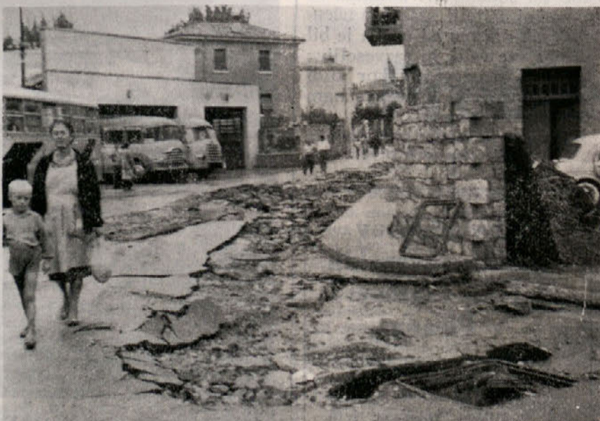
MILJE PO HUDEM NEURJU

Sekcija KPI z Opčin, prosvetno društvo »Opčine« in »Delo«