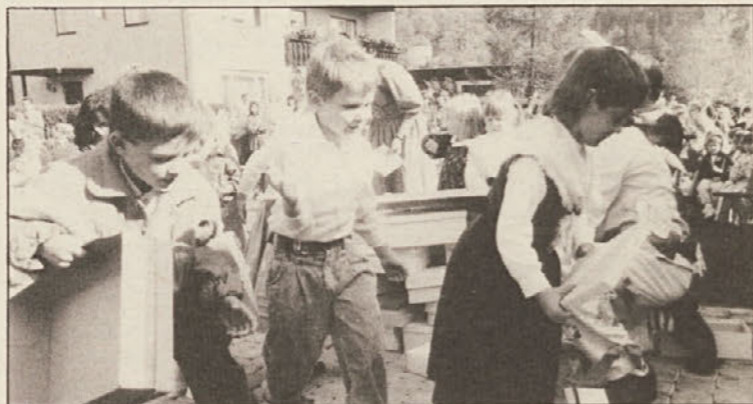
Tri skupine bodo od jeseni naprej v pliberškem otroškem vrtcu; ena od teh bo v glavni šoli vodena dvojezično.