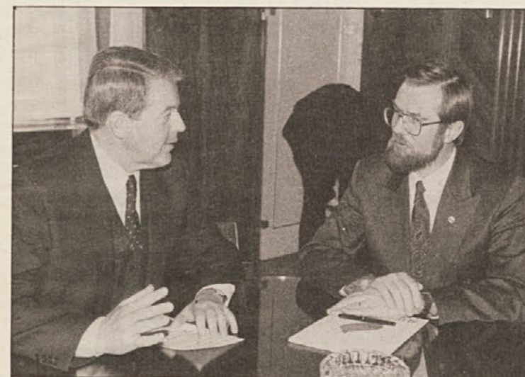
Zvezni kancler Vranitzky sprejel Peterleta

Na vprašanje Našega tednika Mocku, katere države naj bi do torka še priznale Slovenijo, je Mock odgovoril: „Poleg tistih držav, ki so se že izrekle za priznanje, kot npr. Nemčija in Islandija, računam mdr. tudi s priz-