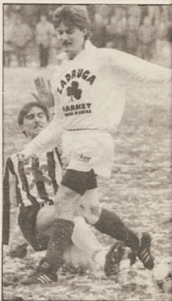
Derbi SAK — Pliberk je tudi 1991 predstavil višek nogometnega prvenstva.