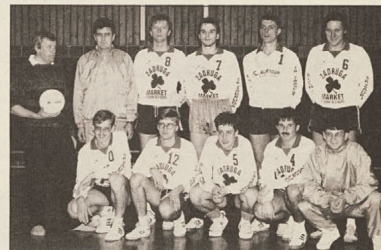
SK Zadruga Dob: Iz koroške lige v regionalno ligo; 1992 morda celo v 1. ligo?