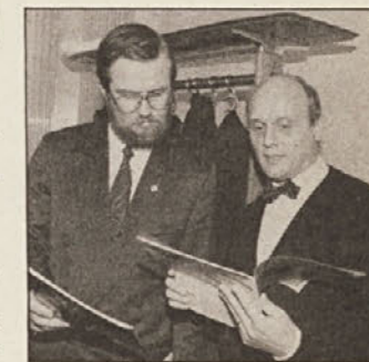
Peterle se je zahvalil tudi NT za njegov delež ob rojstvu slovenske države

„Smolle je bil prvi diplomat slovenske države“