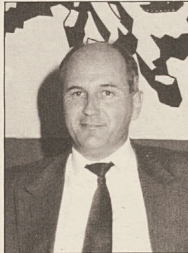
Dr. Zdravko Inzko: „Slovenska napotitev v Evropo bo možna le postopoma — step by step!“

Pri tej možni podobi nove Slovenije pa so pomembni tudi notranji dejavniki. Tako naj bo Slovenija država po meri človeka, etnična, demokratična in pravna, kulturna, ekološka, gospodarsko uspešna država . . . V ospredju vsega bi pa moralo stati znanje in s tem izobrazba. „Razviti se