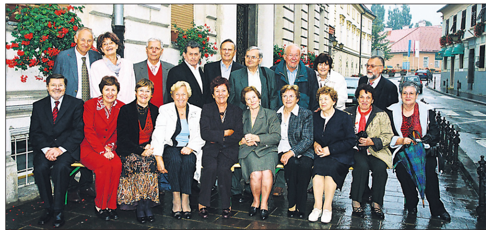
Zabavno je bilo videti, kakšna je danes nekdanja Gimnazija.