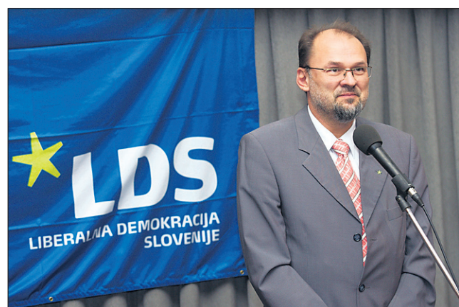
Jelko Kacin, predsednik Liberalne demokracije Slovenije, je županskim kandidatom v Spodnjem Podravju in na lenarškem območju zaželel veliko uspeha na letošnjih lokalnih volitvah, na katere grede pod geslom Podpiramo sposobne.

Lenart • Tiskovna konferenca kandidata za župana