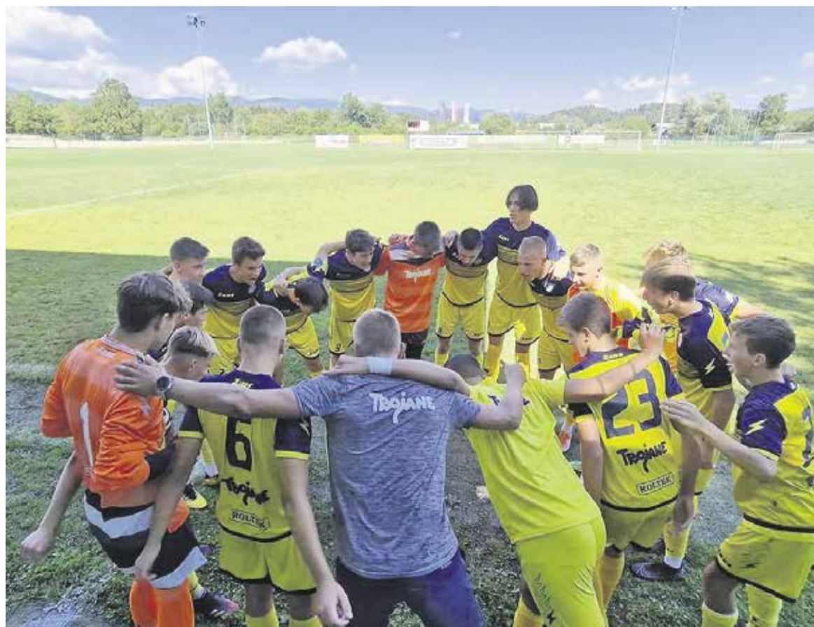
Kadeti Doba se lahko po sedmih tekmah pohvalijo z najboljšim napadom 2. lige zahod.