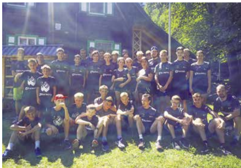
Malce izmučeni, a vseeno dobre volje, smo takole pozirali na naših pripravah v Kranjski Gori.