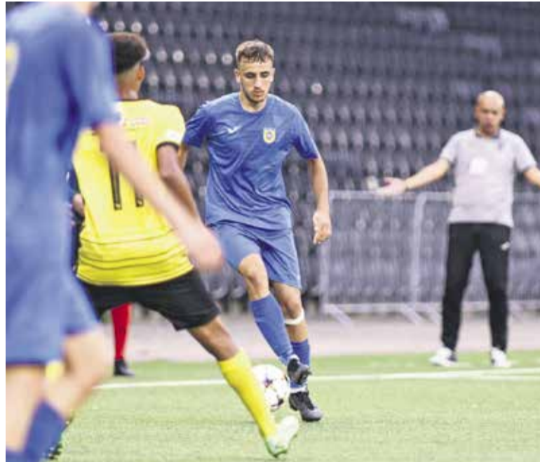
Na mednarodni sceni se je v septembru predstavila mladinska selekcija, ki je v 1. krogu mladinske lige prvakov v Švici kljub podjetnejši predstavi izgubila z 0:3. A puške mladi še ne mečejo v koš – povratna tekma je v Domžalah na sporedu 5. oktobra.