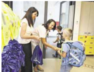
Prvič skozi šolska vrata

Želimo vam, da svojo radovednost še okrepite, sklenete nova prijateljstva in usvojite nova znanja, ki vam bodo odpirala pot do vaših sanj. Spoštujte se med seboj in se učite tudi drug od drugega. Izkušnje in znanje vam bodo ostale za vedno. Vsem želimo prijeten, varen in uspešen začetek novega šolskega leta. Prvošolčkom, ki šolska vrata odpirajo prvič, pa že-