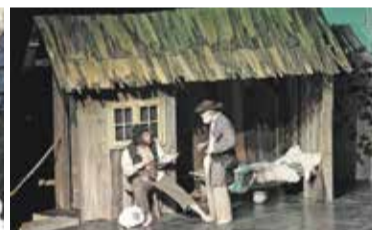
Deseti brat (Žiga Bunič) in Krjavelj (Stanko Pelc)