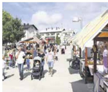
Stojnice na Hroščkovem festivalu