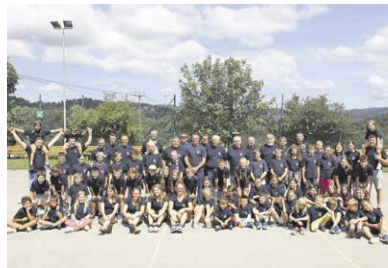
65 sodelujočih je letos izvedlo 24. tabor mladih gasilcev.