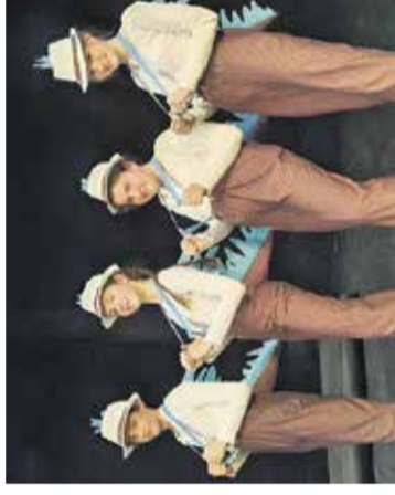
Predstava: Dinozavrja Kulturni dom na Močilniku, Dob, 15. oktobra