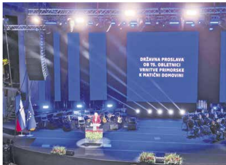
Utrinek iz osrednje državne proslave, kjer smo bili tudi domžalski veterani.