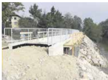
Brv čez Dolsko Mlinščico

V sklopu ureditve zelene rekreacijske poti ob Kamniški Bistrici je v Mali Loki potekala novogradnja brvi za pešce in kolesarje, poimenovana kot Brv čez Dolsko Mlinščico. Nova brv premošča Dolsko mlinščico v Mali Loki na odseku od Centralne čistilne naprave Domžale - Kamnik do mostu v Biščah. Brv bo dolga 14 metrov in široka 3,7 metra. Objekt je zasnovan kot armiranobetonska integralna konstrukcija (okvir), sestavljen iz klasično armirane prekladne konstrukcije. Na obeh robnih venci brvi je predvidena jeklena ograja za pešce s skupno višino 1,2 metra z vertikalnimi polnili. Brežina struge bo v območju brvi urejena s kamnito oblogo,