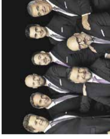
Koncert: Slovenski oktet Cerkev Marijinega rojstva na Homcu, 16. oktobra