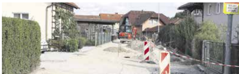
Na Podrečju nadaljujemo z obnovo cestišča.

Ob smrti kraljice Elizabete II. bi želel izraziti svoje globoko spoštovanje do njenega Veličanstva. Imel sem priložnost, da sem se z monarhinjo tudi osebno srečal. V spominu mi je ostala kot topla, a hkrati odločna oseba z izjemnim občutkom za humor. Svet jo bo pogrešal.