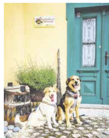
Ziggy in Brownie na obisku v Menačenkovi domačiji.

Kaj pomenita oznaki Psom prijazen muzej in Psom dostopen muzej? Ker vsi muzeji in galerije psom ne morejo omogočiti dostopa do vseh prostorov, sta vzpostavljeni dve možnosti. Psom prijazen muzej je muzej, v katerega psi nimajo vstopa oziroma je vstop dovoljen samo v določene prostore, je pa zanje pripravljeno mesto, kjer lahko svoje lastnike varno počakajo in se odžeja. Psom dostopen muzej je muzej, v katerem lahko psi lastnike spremljajo ob ogledu vseh razstavnih prostorov, zanje pa je pripravljen tudi prostor, kjer lahko lastnike tudi počakajo in se odžeja. Seznam trenu-