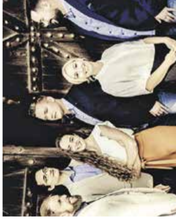
Koncert: Ingenium Ensemble Cerkev sv. Lenarta na Krtini, 8. oktobra