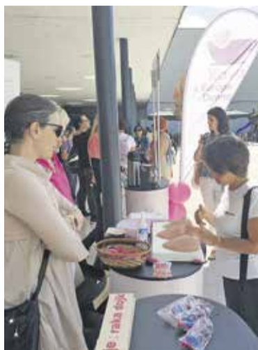
Kava z Europo Donno

OBČINA DOMŽALE, ŽUPAN TONI DRAGAR