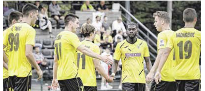
Nekaj pozitivne energije je v septembru v ekipo vnesla le prepričljiva zmaga v 1. krogu pokala Slovenije proti NK Dragomer s 4:0

Durdova tudi zaslužno dobili z 1:0 – zadeli so tudi okvir vrat in nekajkrat zapravili izjemno priložnost za višje vodstvo. A v drugem delu so pobudo prevzeli Domžalčani, ki so imeli junaka srečanja prav v Durdovu. Slednji je z zadetkoma v 49. in 81. minuti preo-