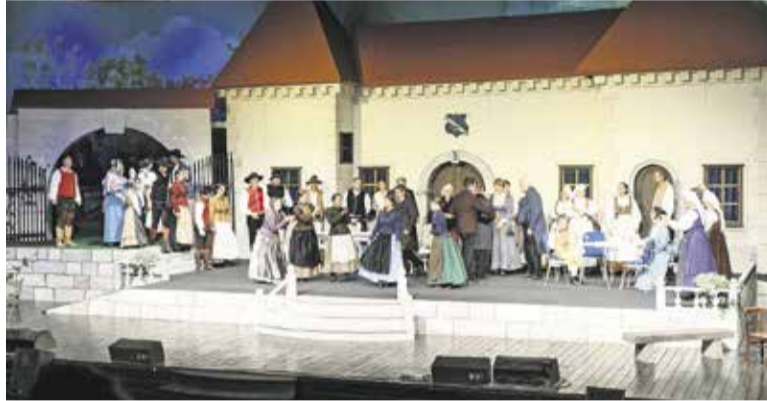
Praznovanje graščakovega godu na Slemenicah