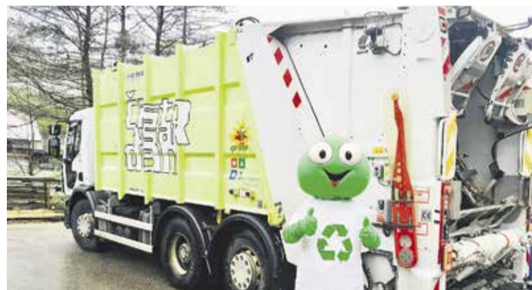
Pomemben del družbene odgovornosti je tudi sodelovanje z lokalno skupnostjo in ozaveščanje o varovanju okolja, pri čemer zaposlenim v Javnem komunalnem podjetju Prodnik na pomoč priskoči maskota Grini.

V podjetju poleg odnosa do zaposlenih, uporabnikov in lokalne skupnosti veliko pozornosti namenjajo tudi ozaveščanju. V zadnjih letih so z namenom ozaveščanja javnosti raz-