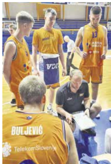
Domžalčani so s pripravami na sezono lahko zadovoljni – na sedmih prijateljskih srečanjih so prav tolikokrat slavili.