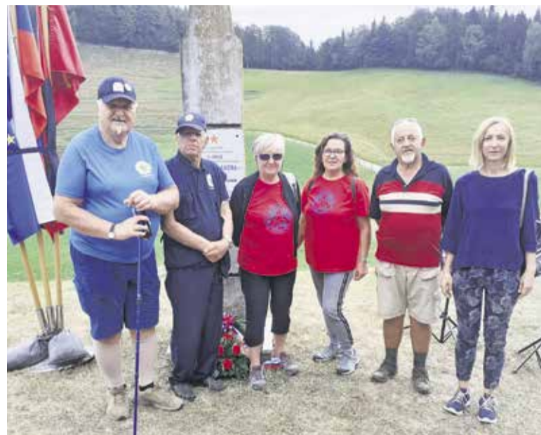
Med številnimi prisotnimi so bili tudi člani Krajevne organizacije za vrednote NOB Dob, Krtina.