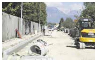
Rekonstrukcija lokalne ceste na Količevem mimo tovarne Helios.

V nadaljevanju rekreacijske poti se ob izlivu Homške Mlinščice v Kamniško Bistrico izvaja novogradnja druge brvi za pešce in kolesarje, poimenovana kot Brv čez Homško Mlinščico. Objekt je zasnovan kot armiranobetonska integralna konstrukcija, sestavljena iz klasično armirane prekladne konstrukcije prek enega polja in dvema krajnjima opornikoma s krili. Skupna dolžina brvi med krajnjima opornikoma bo merila 17 metrov, širina brvi pa 3,7 metra. Na integriranih robnih venci brvi je na obeh straneh prav tako predvidena jeklena ograja za pešce s skupno višino 1,2 metra z vertikalnimi polnili. Ob gradnji smo naleteli na erozijo severne brežine, ki jo je bilo treba sani-