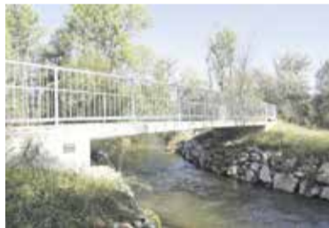
Brv čez Homško Mlinščico

položeno v pesek. V dno struge vodotoka se ne bo posegalo, ostaja naravno s obstoječimi prelivi in tolmunji.