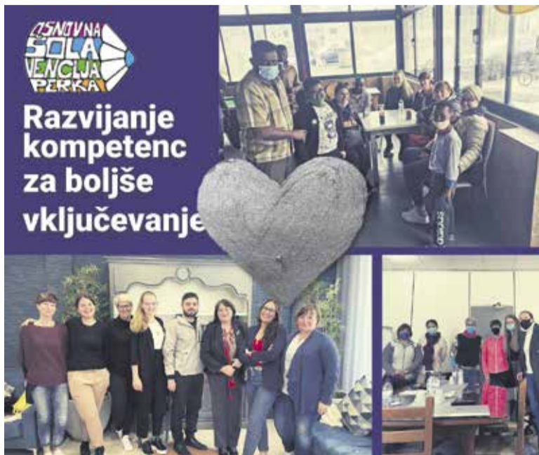
Obisk na delovnem mestu (t. i. 'job shadowing') na Malti

Pet udeleženk (socialna pedagoginja in učiteljica DSP, učiteljica v prvi triadi, dve učiteljici v drugi triadi in šolska knjižničarka) se je udeležilo 'job shadowing' oziroma obi-