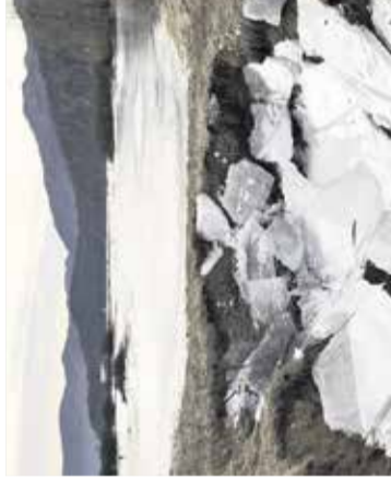
Razstava: Potepanje ob Cerknškem jezeru Center za mlade Domžale, 20. oktobra