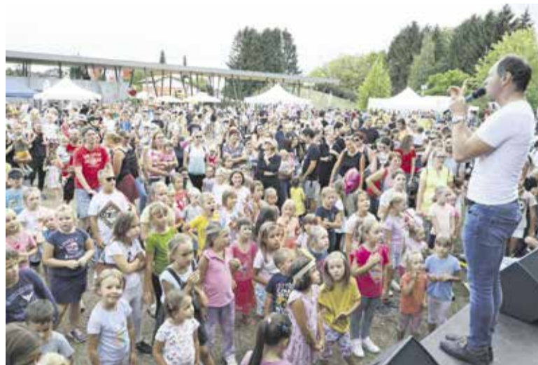
Vzdušje na Hroščkovem festivalu

V Češminovem parku je na ustvarjalnih, športnih in kuharskih delavnicah v parku ter v skrbno izbranim odprtem programu, ki se je zaključil s koncertom skupine Čuki, uživalo več tisoč malih in velikih obiskovalcev. Kar nekaj obiskovalcev nas je vmes malce zapustilo, saj so v družbi izkušnih vodnikov odšli na voden ogled po Pravljicnem Šumberku, kjer so se pod budnim očesom domžalskih jamarjev spustili v Dolgo jamo na Šumberku. Pridružili so se nam tudi gasilci CZR, ki so z najmlajšimi neumorno gasili požar, ter policista Policijske postaje Domžale, JKP Prodnik s svojo stojnico in Grinijem, Hiša eksperimentov s kar 50 mobilnimi eksperimenti, Zavod enostavno prijatelji, ki je pripravil ustvarjalne delavnice, kjer so otroci med drugim lahko izdelali torbico hroščka Simona, športni poligon in lepote salona s poslikavo obraza, kjer je bila daleč najdaljša vrsta, Center za mlade Domžale je pripravil prav zanimive spretnostne preizkuse in Hroščkovo pošto, kjer smo lahko napisali razglednico svojim najdražjim. Na stojnici Slamnikarskega muzeja smo lahko izdelali papirnati slamnik. V kuharskem kotičku Lončka kuhaj so mali kuharski mojstri ustvarjali dobrote iz medenega testa. Na odru so nas razveseljevali: Pika Nogavička in indijski poveljnik, čebelica Tinka in Tonka, Čarovniški blues s predstavo Kako je deklica postala varuhinja narave, predstava Izgubljeni slamnik, znanstveni šovi Hiše eksperimentov, predstavili smo Gospo-