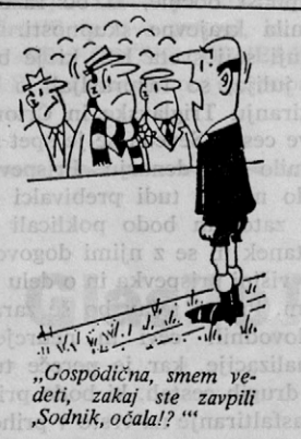
„Gospodična, smem vedeti, zakaj ste zavpili ‚Sodnik, očala!‘?“

Najbolj uspešen mož v človeški zgodovini je bil nedvomno Noe, edini človek, ki je z izbrano družbo na barki rešil svet pred likvidacijo.