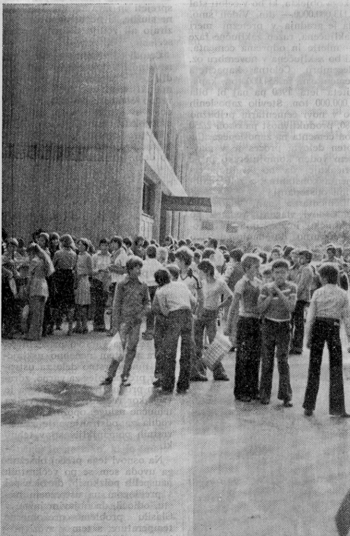
Tudi pred osnovno šolo dr. prof. Josipa Plemlja je nastal pravcati vrvež in direndaj, vse naokrog je bilo slišati razposajene otroke, le prvošolčki so s strahom opazovali »novo življenje« in se sukali le okoli staršev, ki so jih pospremili v šolo.