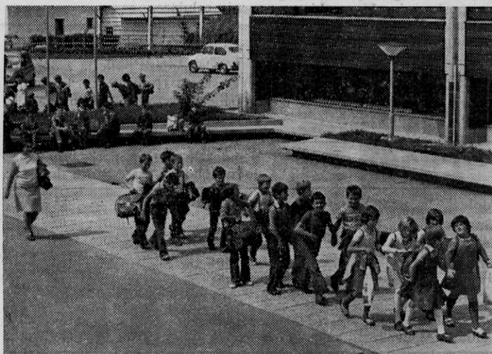
Prv: šolski dan učencev osnovne šole dr. Janez Mencinger

Zavedamo se, da moramo dati vsem učencem enake možnosti za razvoj. Zato smo v Srednji vasi že pričeli s temeljito obnovo šole. Veselimo se trenutka, ko bodo imeli tudi ti otroci svetle učilnice, saj bomo šele takrat lahko uporabljali vso učno tehnologijo, ki je na voljo. Za to pa bo potrebno veliko denarja. Spet se bomo obrnili na vas po pomoč. Upamo, da bo akcija uspela. Od tega je odvisno koliko časa se bodo morali otroci iz Zgornje doline voziti k pouku v Bohinjsko Bistrico. Ne bomo pa pozabili