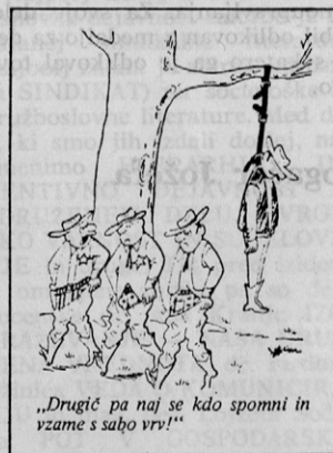
„Drugič pa naj se kdo spomni in vzame s sabo vrv!“