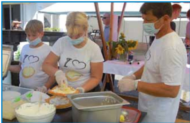
V Gaberju je ves dan dišalo po langaših

V Gaberju so organizirali vaški dan, na katerem so tretjič organizirali Festival langaša, s prireditvijo pa so obeležili tudi 40 let Kulturnega društva Zarja