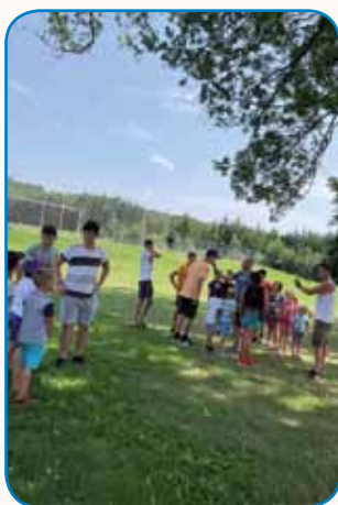
Tabor v Sakalovcih stran 3