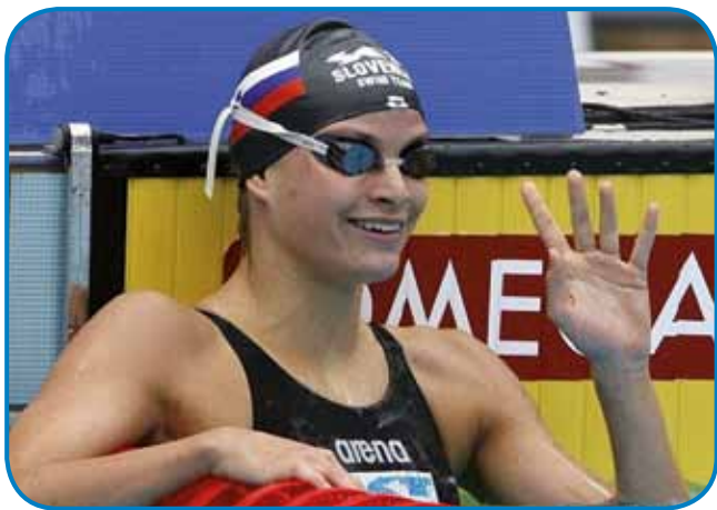
Srebrna slovenska ribica

letaj Sloveniji priplavala zlato medaljo na evropskem prvenstvu. Svoj največji uspeh pa je dočakala na olimpijskih igrah v Pekingu, gé je v kategoriji 200 metrov prosto osvojila olimpijsko medaljo. 11. avgusta 2008 je na kvalifika-