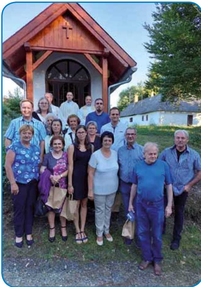
Cerkveni pevski zbor z župnikom pri ritkarovski kapelici

Lokalna in Slovenska samouprava naselja Verica-Ritkarovci sta 7. avgusta organizirali tradicionalni vaški dan. Poleg kulturnega programa so obiskovalci lahko sodelovali v različnih družabnih igrah. V ekipnem kuhanju je sodelovalo deset skupin iz Porabja in sosednjih slovenskih krajev.