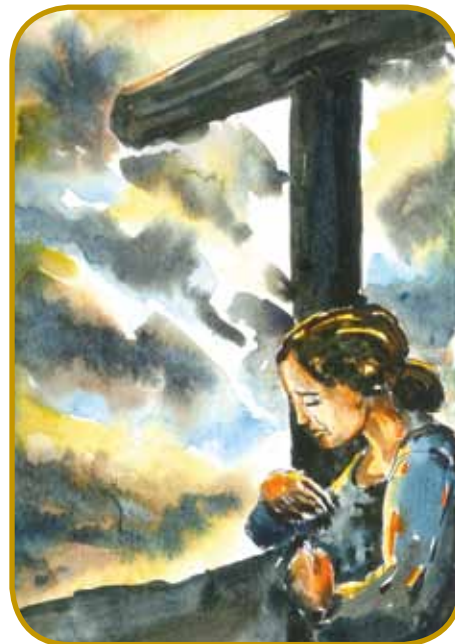
Cesarica Helena pod svetim Križom, šteroga je najšla v Jeruzalemi - Križ je vekši od Človöka, Nébo je vekše od Križa ...

dati dva nauva samostana, 25-lejtni Bernard je grato opat v Clairvauxi. Dosta je premišlavo v tüüči zidine na srejdi gauške in zadaubo tak veuko dühovno mauč, za štero so čüli v cejloj tedešnjoj Evropi. Na pomauč so ga zvali vseposedik, gde je bilau kaj naaupek.