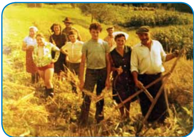
Žetvo so pomagali delati pri sausadi Rogani 1992. leta

lali, tau naša mama nej dopistila. Če bila krma, senau, tisto od pondeljka do sobote trbelo taoprajti. Nedela je nedela bila, trbelo titi k meši, k večernici, te so stariške malo tó počivali.«