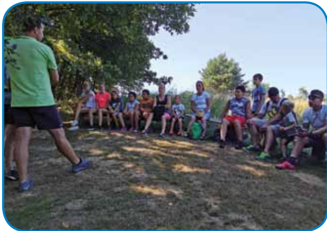
Večkrat smo bili na pohodu, med potjo smo počivali v senci

nosti pri Uradu predsednika vlade preko sklada Gábor Bethlen. Program je prijavilo Društvo za lepšo vas Sakalovci in z njim tudi uspelo. Razpis je namenjen podpori manjšinskih otroških taborov. Za organiziranje tabora je dobilo društvo 500.000 forintov, to vsoto je lokalna samouprava dopolnila z lastnimi sredstvi.