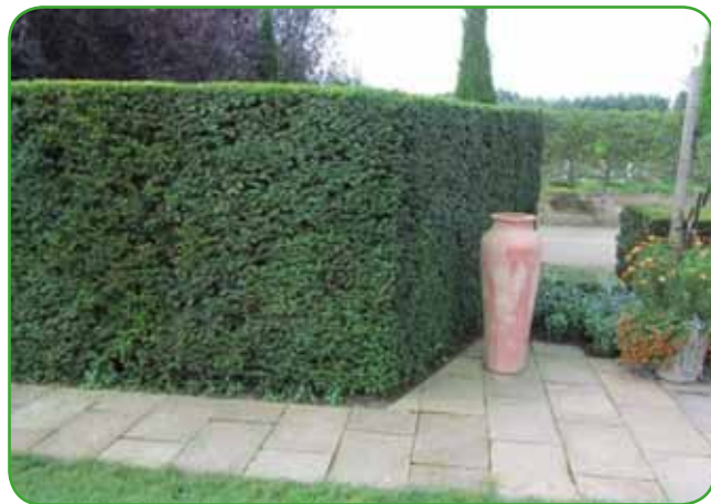
Živa meja nas zaščiti pred radovednimi pogledi, daje nam intimnost, varuje nas pred prahom in drugimi nevšečnostmi

liki količini le-teh lahko potegnemo delo v septembru. Izogibamo se močno vročih intervalov vremena. Rez je potrebna, če hočemo, da bodo žive meje goste že od tal. Z zgodnjim