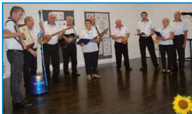
Na prireditvi so nastopili tudi ljudski pevci in godci Gaberski mantraši

Organizatorja prireditve sta bila Turistično društvo Gaberje in Krajevna skupnost Gaberje, sodelovala so tudi druga društva iz vasi. Langaše so organizatorji ves čas prireditve pripravljali pred obiskovalci in ti so jih lahko odnesli domov. V tekmovanju je sodelovalo sedem ekip, šest iz Prekmurja in ena iz Madžarske. Po mnenju ocenjevalne komisije je najboljša