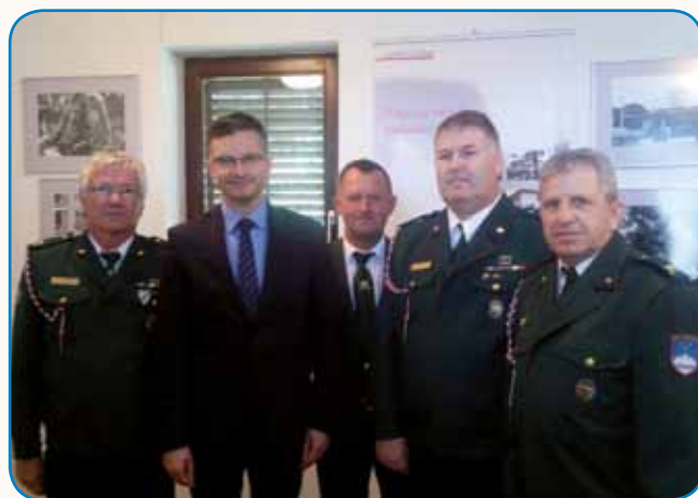
Nosili so svoje glave na odajo stran 4