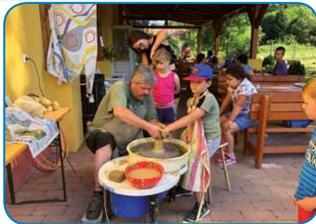
Pri lončarju v Andovcih

S 45. udeleženci se je začel prvi dan tabora, programi so bili zelo pisani in zabavni. Otroci so igrali družabne igre, ogledali so si risanke in zanimive filme.