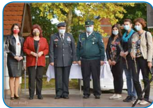
30. obletnica osamosvojitve se je slavila v cajti korone z maskami

OZVVS Murska Sobota, stera je za svoje člane leta 2019 organi-