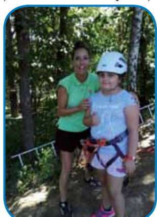
V doživljajskem parku v Andovcih

Igrali so nogomet in se udeležili spretnostnih tekmovalij ter rokodelskih delavnic, kjer so naredili »male prijatelje«.