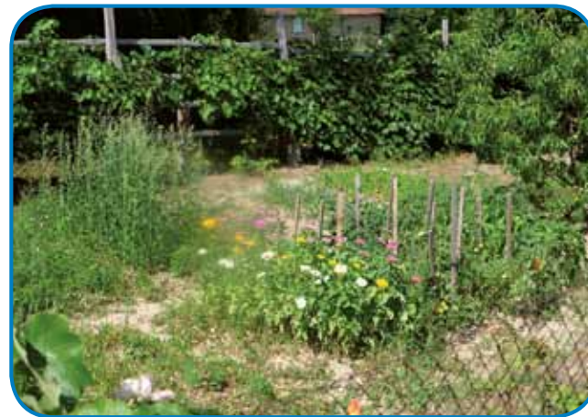
V gradci so rauže, stera je njini mauž rad emo; te ma nosijo na grob

»Mauž je v več mejstaj delo, v židanoj fabriki, pri VASÉP-i, naslejdnje pa pri gozdnom gospodarstvu. Doma je emo enga konja pa te je z njim, gda je čas emo, odo po forinigi. Dja sem v židanoj fabriki delala tridvajsti lejt, dočas, ka je fabrika nej zaprla, potistim sem v socialni dom üšla pucaat pa te odtistec sem v pen-