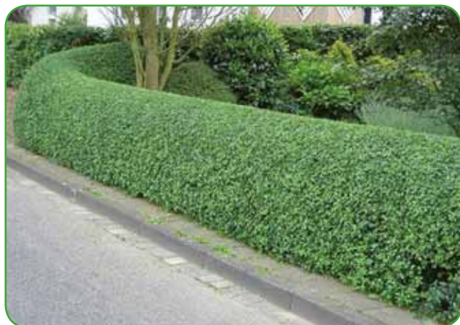
Obrezovanje je veliko opravilo, vrt po opravljenem delu daje videz urejenosti

razpolovi ali celo polomi. Avgusta iglavce lahko tudi sadimo in presajamo. Pred sajenjem se je dobro pozanimati o rastnih razmerah pri posameznih vrstah iglavcev.