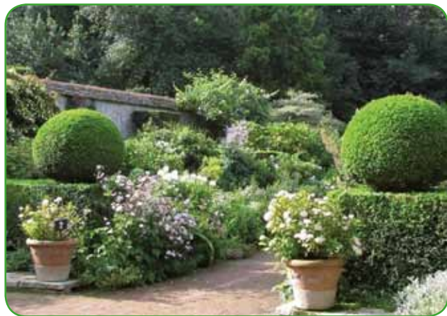
Vrt, zasajen z iglavci in vrtnicami

je dobro opomniti, da žive meje iz iglavcev obrezujemo konično in ne ravno, zato da pozimi sneg lahko zdrzne z njih in da jih ne