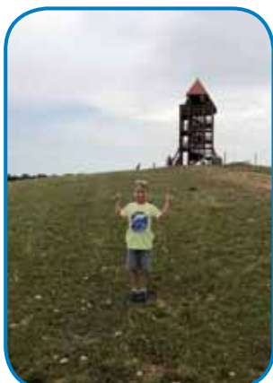
Bili smo tudi na razglednem stolpu na Verici