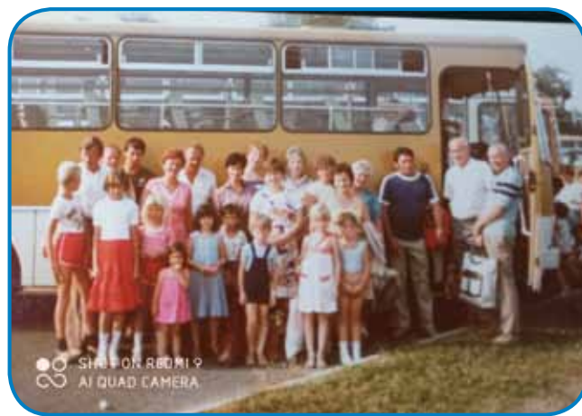
Izlet fabričke brigade 1982. leta v tiskarni v Sombotelu

jek gledati, če nega kašne hibe, pa če si kaj vpamet vzela, te si leko prvim vö popravila. Če si pa nej tapazila, te prišla velka nevola, ka so se žide vse vküper zamotale. Tam sam osem vör dojtani, domau sam prišla, mlajši so bili, veselo je bilau, dosta bola kak zdaj. Meli smo svoje brigade, dostakrat smo se srečali zvün