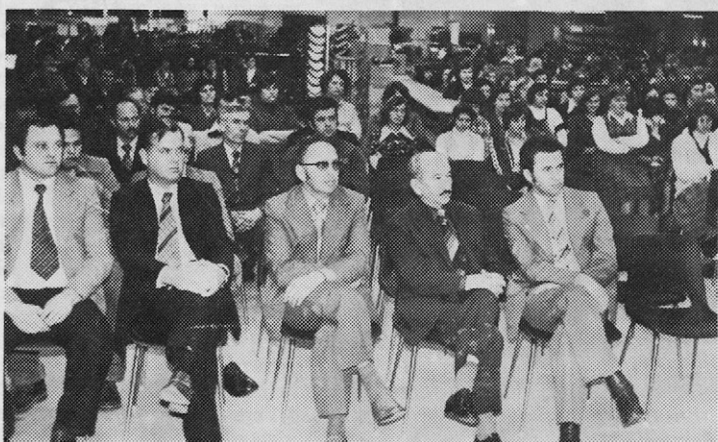
Udeleženci na skupščini sindikata v Ludbregu