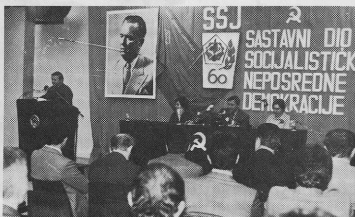
Delovno predsedstvo skupščine