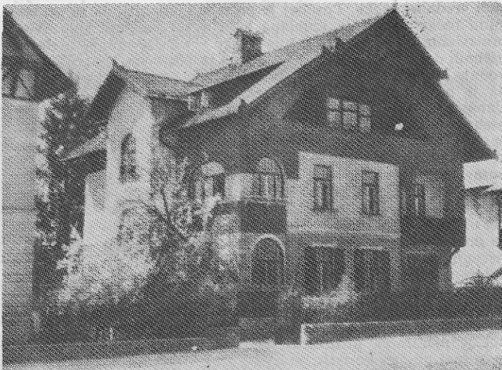
Hiša dr. Josipa Vidmarja na Večni poti v Ljubljani, kjer je bila ustanovljena OF.

VSEM BRALCEM ČESTITAMO OB DNEVU OF – 27. aprilu DELAVSKEM PRAZNIKU – 1. maju DNEVU ZMAGE – 9. maju IN ŽELIMO ČIM VEČJE DELOVNE USPEHE