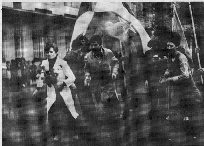
Mladina dragemu tovarišu Titu

Štafetna palica je svojo pot začela 25. marca (natančno dva meseca pred predajo tovarišu Titu za njegov