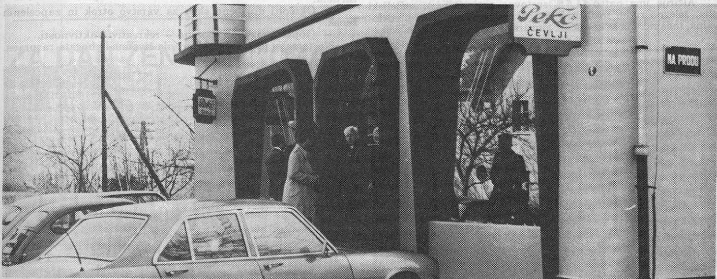
Poslovalnica »PEKO« Prevalje