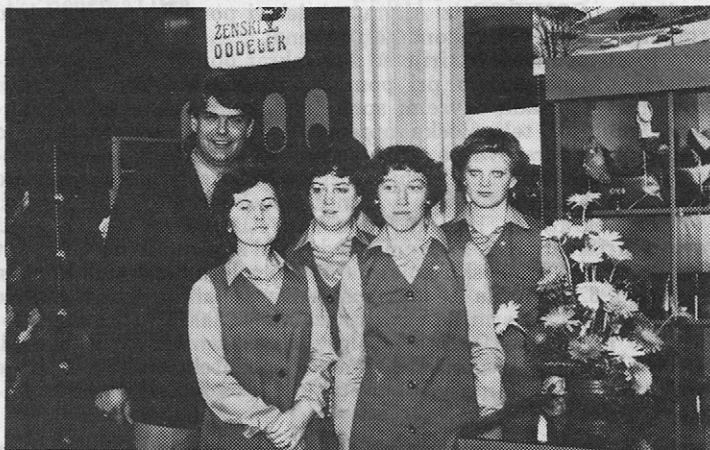
Ekipa »PEKO« Prevalje

Prebivalci Prevalj in Mežiške doline so tako dobili kompletno prodajalno, sodobno opremljeno in dovolj veliko. V sklopu trgovine je prodajni prostor za čevlje, sekundarne artikle in priročno skladišče. Skladiščni prostor – glavno skladišče je v kletnih prostorih.