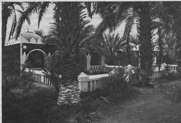
Motiv iz Alžira

Demokratska ljudska republika Alžirija je po velikosti druga afriška država. Zavzema srednji del severne Afrike. Več kot sto let je bila francoska kolonija. Po dolgoletnih krvavih bojih si je leta 1962 priborila neodvisnost. Alžir se lahko razdeli na dve različni coni: Severni Alžir, ki zavzema 300.000 kvadratnih kilometrov in ima 750.000 prebivalcev. Sicer pa ima Alžirija okoli 15 milijonov prebivalcev. Zanimiv je podatek, da ima Alžirija verjetno najmlajši narod na svetu, ker je 54 % prebivalcev mlajših od 18 let.