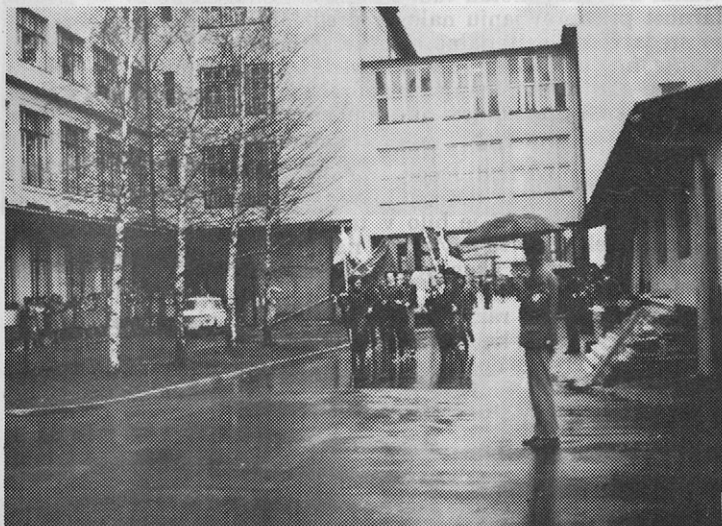
Štafetna palica na dvorišču »PEKA«

Bliža se 27. april, dan, ko je bila leta 1941 na pobudo in pod vodstvom KPS ustanovljena Osvobodilna fronta slovenskega naroda. To je bilo zgodovinsko dejanje slovenskega naroda. Nastala je iz življenjskih potreb zaslužnjega in razkosanega naroda. Bila je enotno vseljudsko osvobodilno gibanje, junaško je izpeljala prvi boj pod vodstvom komunistične partije. Kot je OF v revoluciji in borbi povezovala široke ljudske množice, jih danes strjuje njena naslednica množična fronta SZDL.