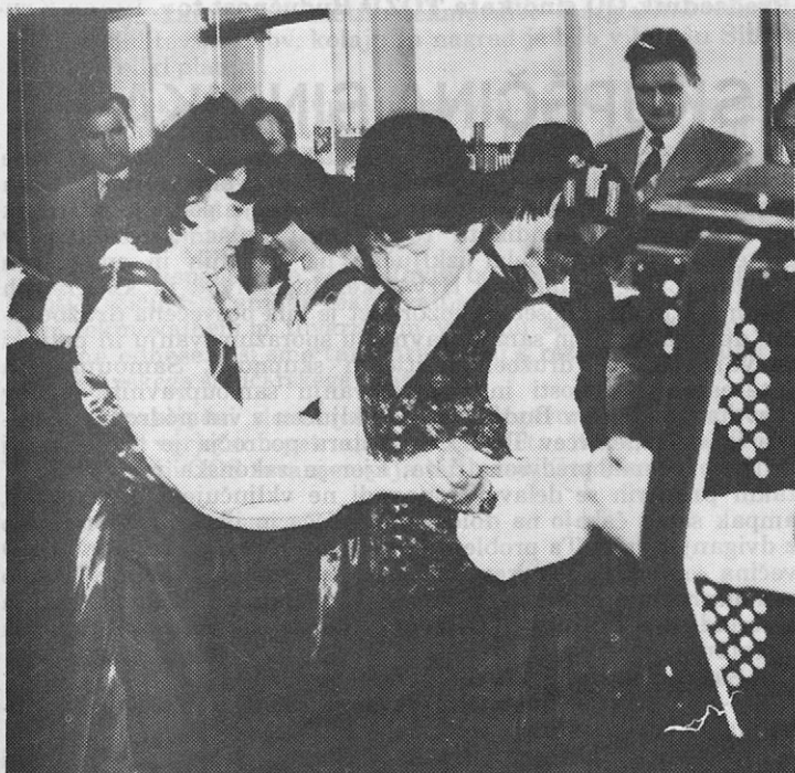
Mladi plesalci iz Prevalj