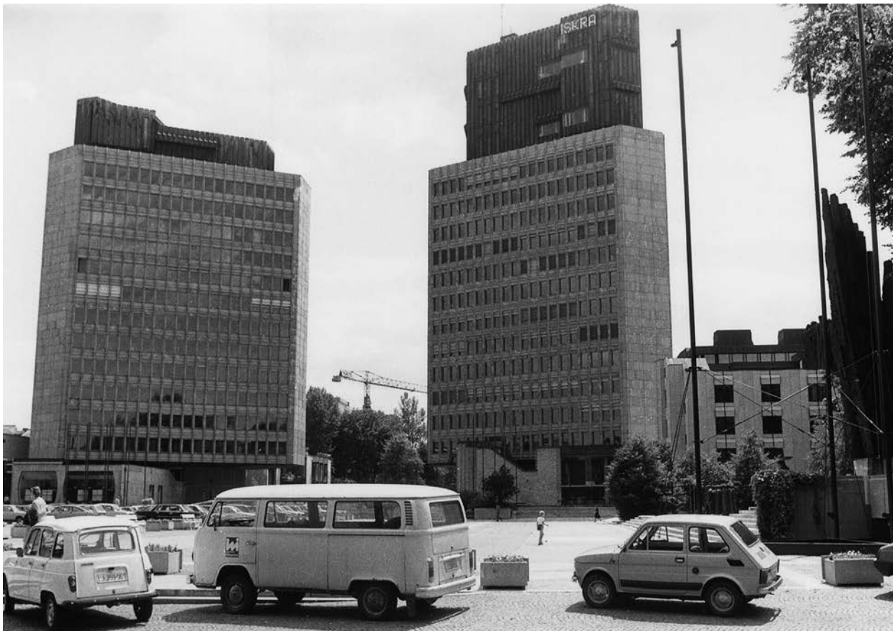
Poslovni stolpnici Ljubljanske banke in Iskre Commerce na Trgu republike 2 in 3, okoli 1985.

Spomladi 1977 je na mestu prihodnjega kulturnega središča še vedno zevala velikanska gradbena jama. Zaradi finančne krize in enormne inflacije, ki so ju skušali obvladovati s stabilizacijsko ekonomsko politiko, je zvezni izvršni svet prepovedal večja vlaganja v družbene dejavnosti. Sem je spadala tudi kulturna politika, ki je po ustavi iz leta 1974 ostala v domeni posameznih republik. V primeru CD so odločilno vlogo odigrale Skupščina mesta Ljubljana, Ljubljanska kulturna skupnost in Kulturna skupnost Slovenije, tako da se je januarja 1978 gradnja začela, medtem ko je prihodnji kulturni hram dobil delovno ime Kulturni center Ivan Cankar (KCIC). 15 Od tega trenutka dalje je nad projektom kot Damoklejev meč visel strah, da bo Beograd v katerem koli trenutku ukazal