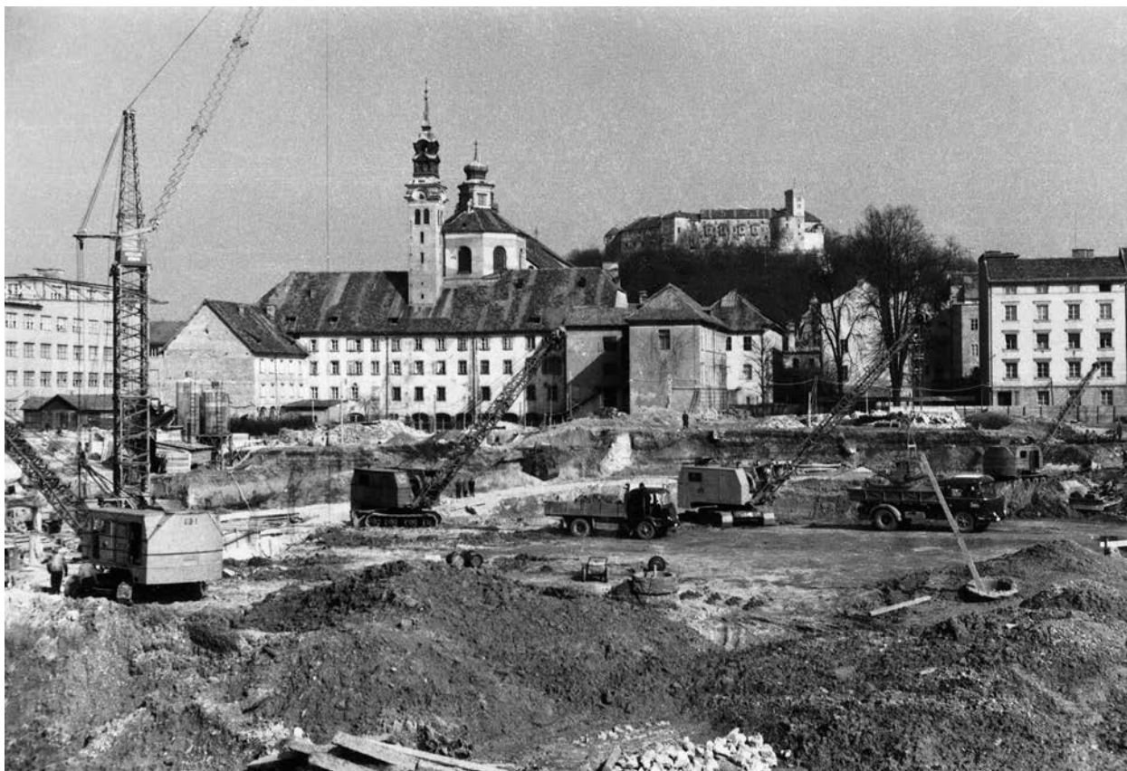
Gradbišče Maximarketa na Trgu revolucije v Ljubljani, 1962.