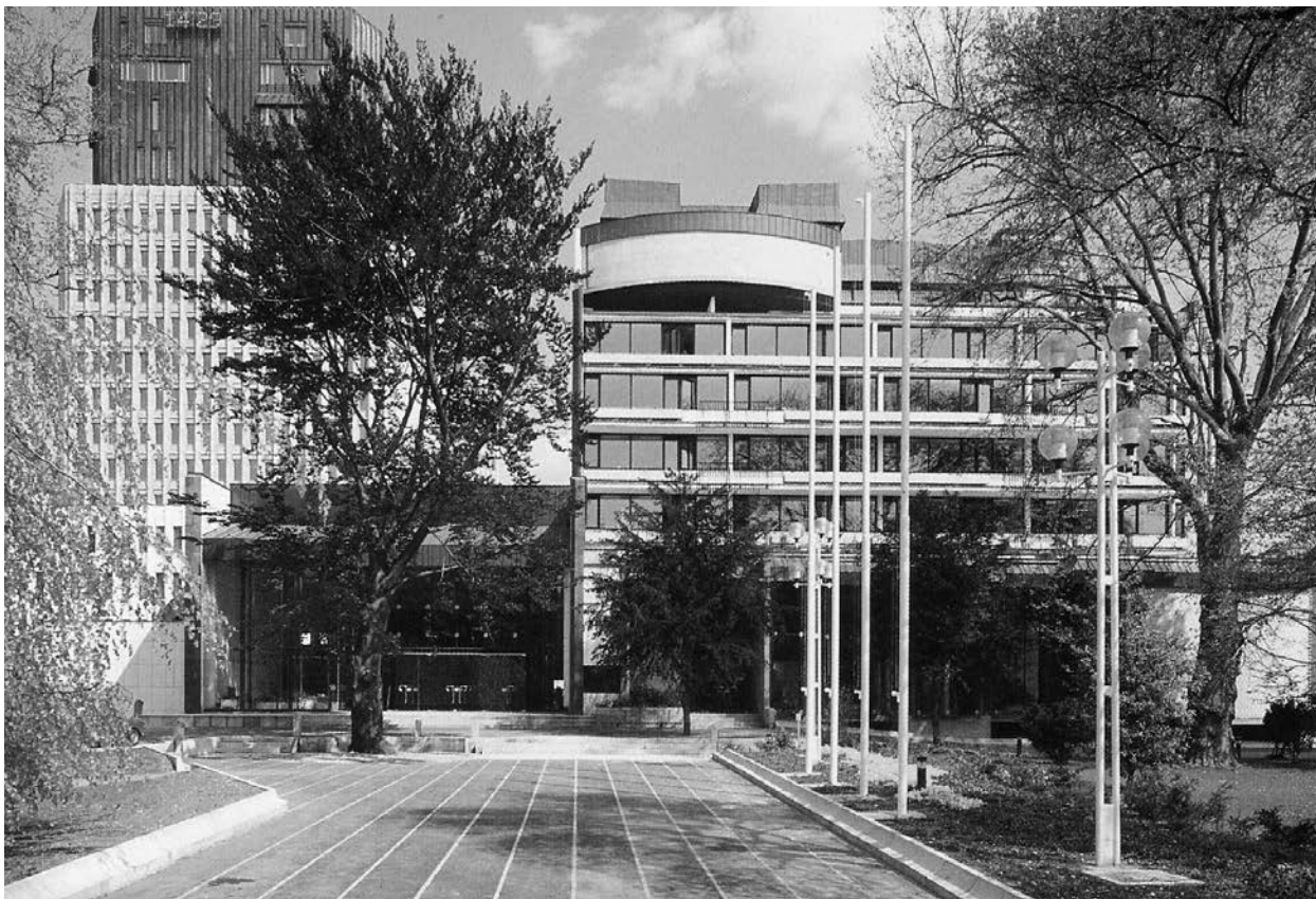
Cankarjev dom z vhodom iz Prešernove ceste, poleg stoji stolpnica TR3, 80. leta 20. stoletja