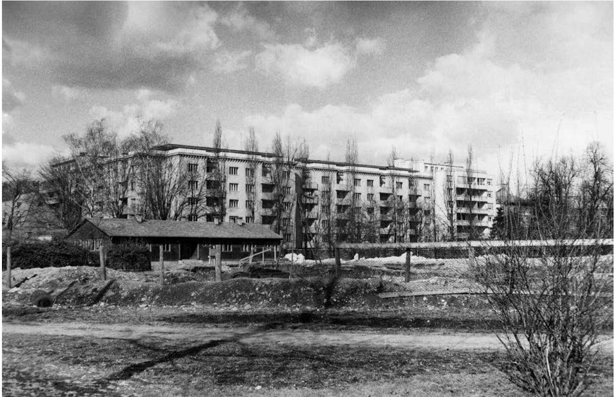
Pripravljalna dela za podzemno garažo na gradbišču pred Valvasorjevo ulico v Ljubljani, 1961.

ne in programsko-komercialne sklope), finančno komisijo, pravno komisijo in več revizijskih komisij . 10