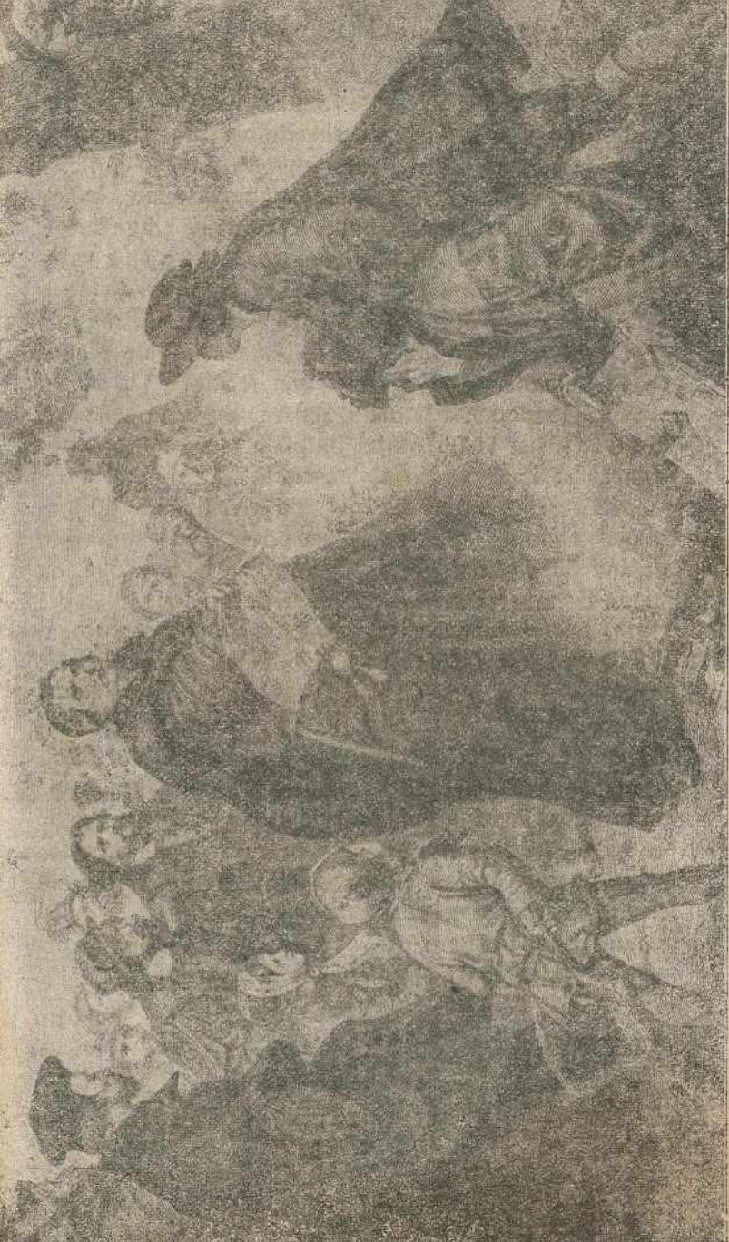
Luther v ogen ľuči bullo prekenenja.