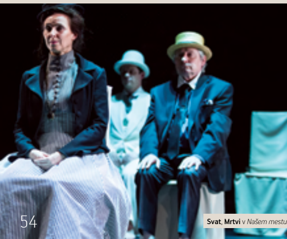
Svat, Mrtvi v Našem mestu