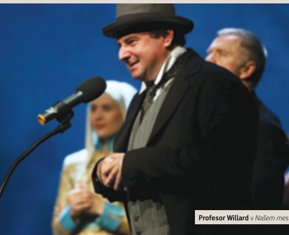
Profesor Willard v Našem mestu