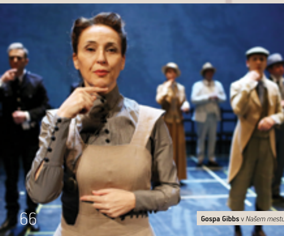
Gospa Gibbs v Našem mestu