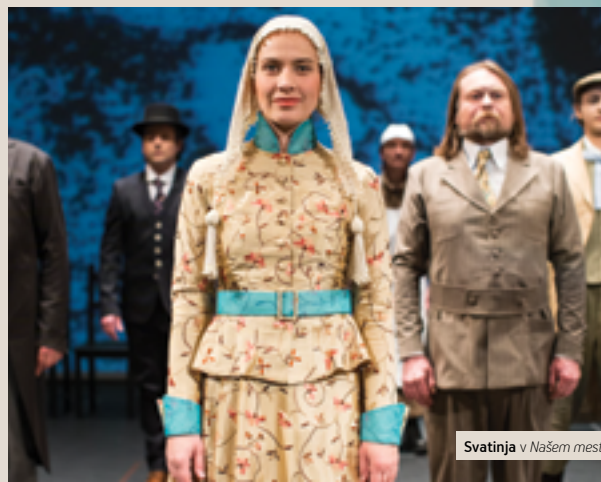
Svatinja v Našem mestu