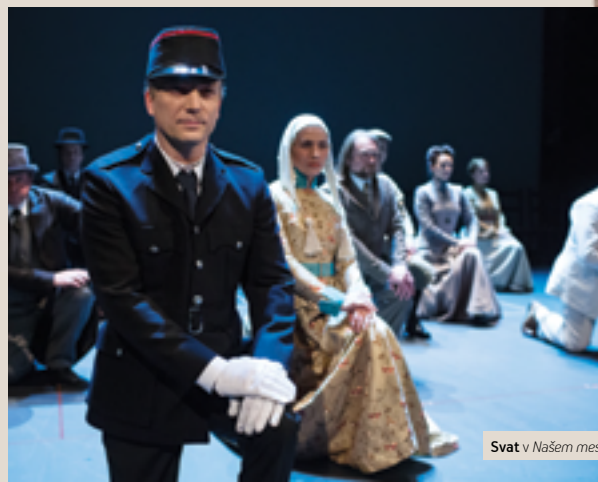
Svat v Našem mestu