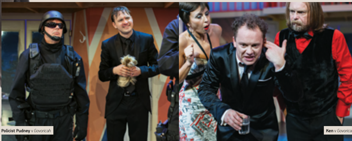
Policist Pudney v Govorica