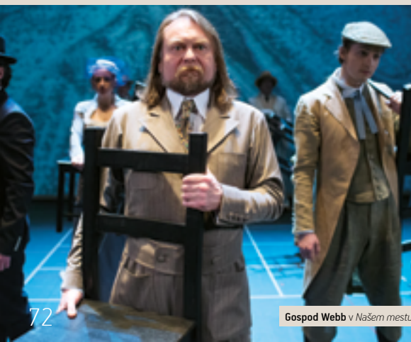
Gospod Webb v Našem mestu