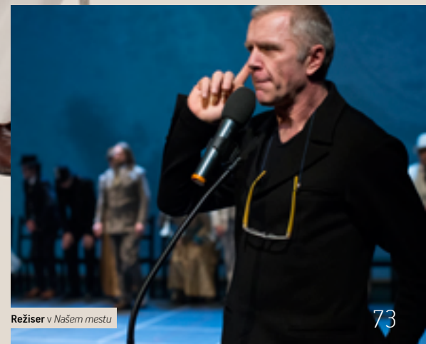
Režiser v Našem mestu