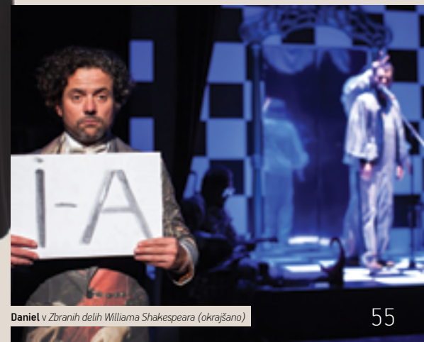
Daniel v Zbranih delih Williama Shakespeara (okrajšano)