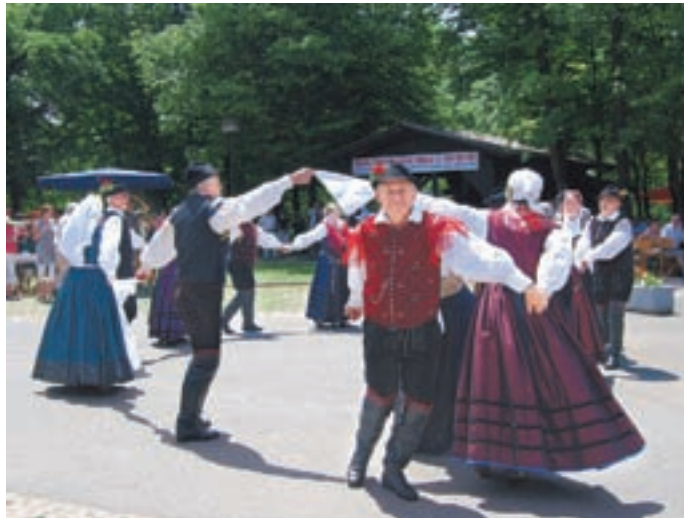
V programu je nastopila tudi Folklorna skupina Naklo.

Dragočajna - V kampu Smlednik je 13. junija v organizaciji TD Dragočajna - Moše potekal četrti Slovenski dan v Dragočajni. Lepa nedelja in dober glas o prireditve sta privabila številne obiskovalce iz medvoške občine, pa tudi od drugod, ki so imeli priložnost brezplačno pokusiti slovenske jedi in uživati v programu, ki ga je pripravil organizator.