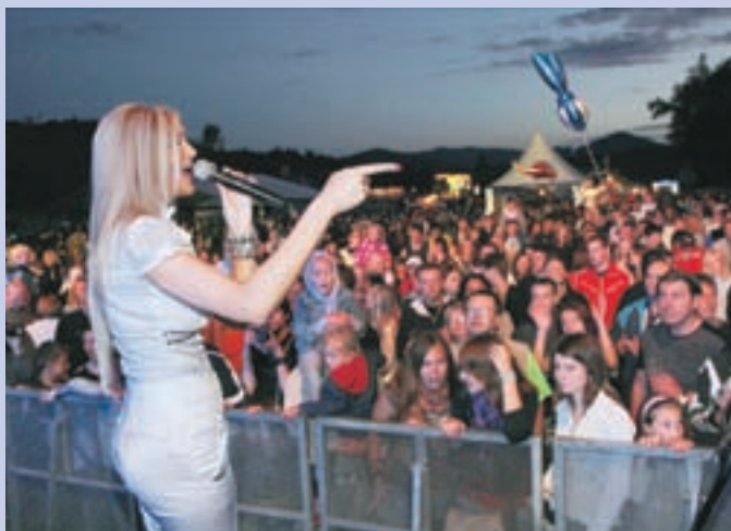
Zbiljska noč je vsako leto privabila veliko obiskovalcev. Te prireditve z dolgoletno tradicijo pa letos ne bo.