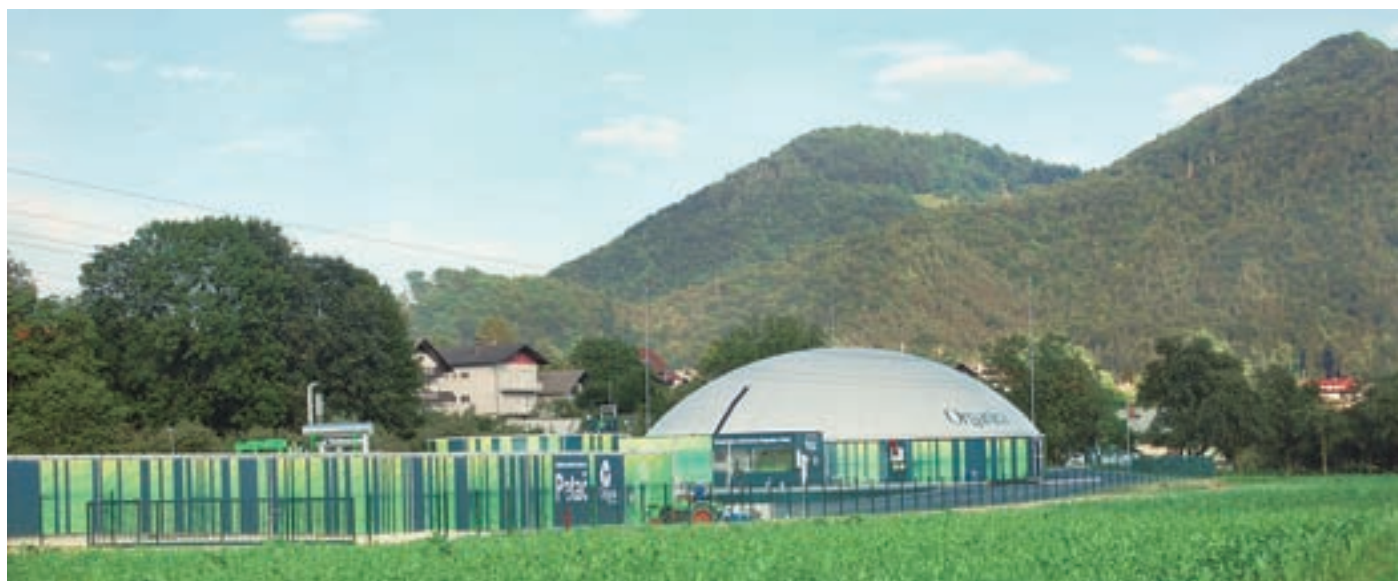
Bioplinska elektrarna Organica - Petač