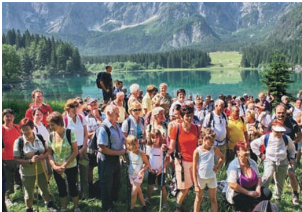
Pohodniki pri Belopeških jezerih.