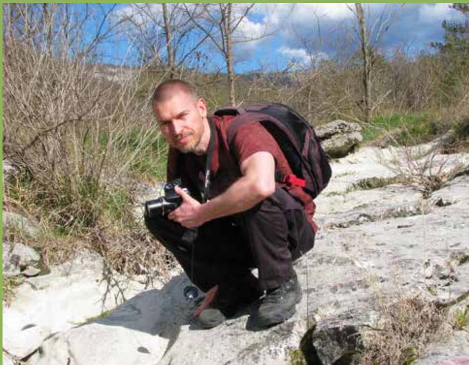
Zelo pogosti subjekti Grišinih fotografij so plazilci, vendar ga pritegnejo tako različni motivi iz narave kakor tudi ljudje in objekti.

K društvu sem pristopil kmalu po ustanovitvi in sodeloval pri pripravi spletne