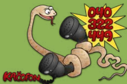
Znak telefonske linije Kačofon. (ilustracija: Griša Planinc)

Za grafično oblikovanje, kar je tudi sicer Griševa poklicna pot, je od leta 2000 dalje skrbel pri biltenu herpetološkega društva Temporaria , leta 2003 pa je poleg oblikovanja prevzel tudi njegovo uredništvo. Temporaria je začela izhajati leta 1997 in je redno izhajala do leta 2006, nato pa je leta 2011 izšla še zadnja številka. Na sliki je naslovnica številke iz leta 2001, za katero je Griša narisal sliko navadnega pupka.