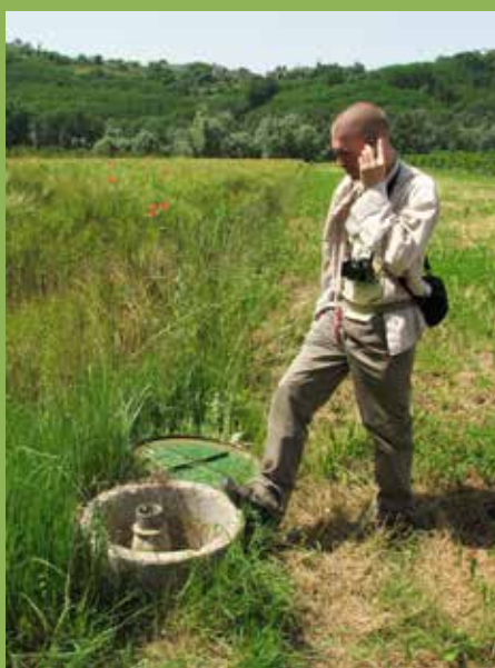
Klici na telefonsko linijo Kačofon so pogosti. V sezoni so lahko celo tako pogosti, da jih mora Griša včasih prevzemati tudi med intervencijo.

strani in društvenega biltena Temporaria . Nekaj časa sem spoznaval dvoživke, kaj kmalu pa sem se bolj posvetil plazilcem. Pomembno se mi je zdelo, da svoje znanje in izkušnje posredujem tudi drugim nadobudnežem in da herpetologijo naredimo prepoznavnejšo v slovenskem prostoru. Ne vem več natanko, koliko let sem predsedoval društvu, vem le, da se je življenje tako zasukalo, da sem imel iz leta