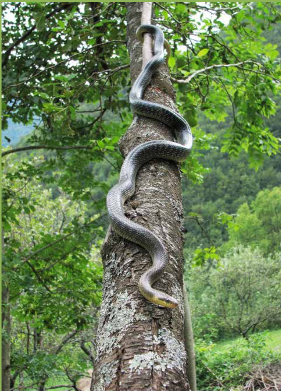
Navadni gož ( Zamenis longissimus ) zraste do 225 cm, večinoma pa doseže od 140 do 160 cm.

Področje je žal neurejeno. Tovrsten register ne obstaja, sicer bi imela policija lahko delo in bi v njem preprosto preverila lastništvo. Povratnih informacij o tem, ali se je lastnik prej omenjene strupenjače našel, nimam. Vsekakor menim, da je šlo za nenamerno dejanje in se je kača osvobodila po nekem čudnem naključju, morda že celo kot jajce. Zdaj je v rokah izkušnih, zaupanja vrednih skrbnikov. Verjetno