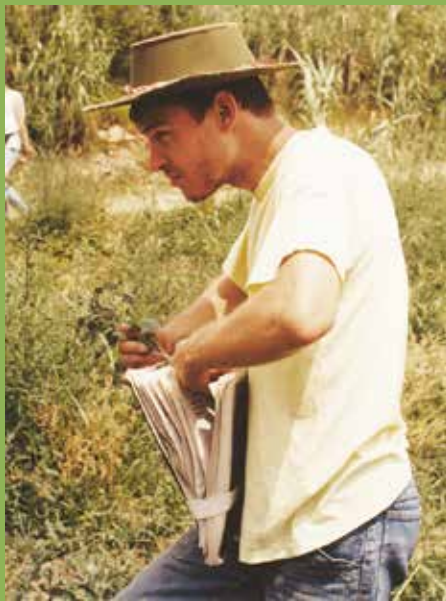
Na terenskih vajah iz sistemske botanike.

možnost spoznavati svet raziskovanja. Sprva smo bili sami svoji mentorji in vse skupaj je zgedalo precej obupno, smo bili pa precej trmasti in pri vsem skupaj smo se predvsem odlično zabavali. Na enem od taborov se me je zaradi odločnosti in stro-