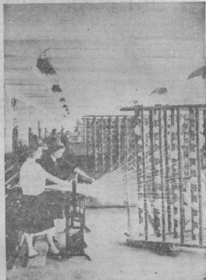
Iz »Oktobarske Slobode«

Razpravljanje v »Oktobarski slobodi« je bilo boljše od razpravljanja v podjetju »Ivan Milutinović«. Dejstvo, da je bilo v poročilu »Oktobarske slobode« toliko prostora posvečenega vprašanju kakovosti, je izpodbudilo člane delavskega sveta, da so odprto in podrobno analizirali to vprašanje. Ugotovitev, da so doseženi rezultati v kakovosti vidni, pa je odvrnilo člane delavskega sveta »Ivana Milutinovića« na splošno od tega problema. Verjetno je, da je tudi sam sistem realizacije premij za dosežene uspehe v kakovosti izdelkov v podjetju »Ivan Milutinović« manj stimulativen, kakor je to v podjetju