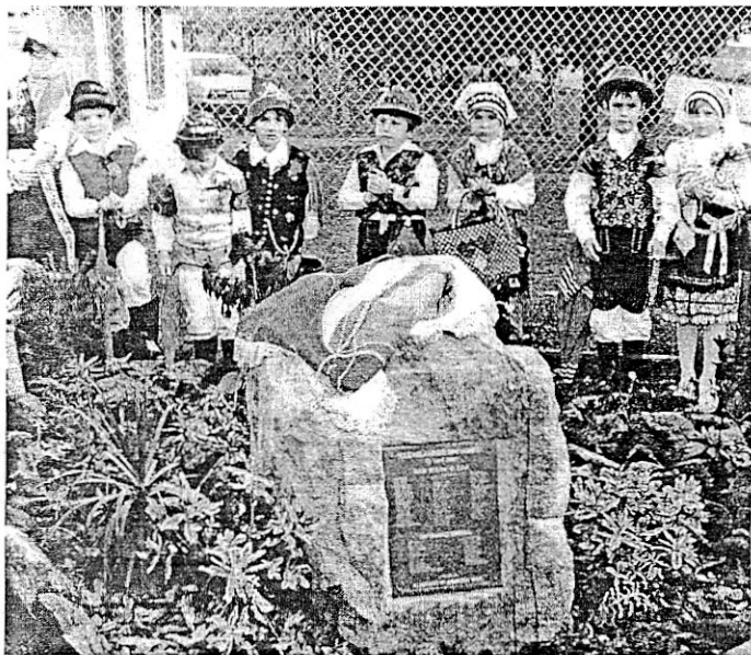
Spominska skala v Clevelandskem drevoredu, ki še danes ameva na starem zemljišču - v ozadju otroška folklorna skupina SDS