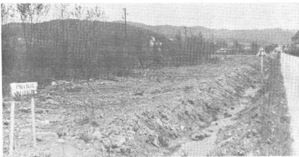
Čistina na cesti med Škofljico in Igom je dar marljivih rok, čuvajmo okolje, zatorej naj pogled na brežino ostane nespremenjen