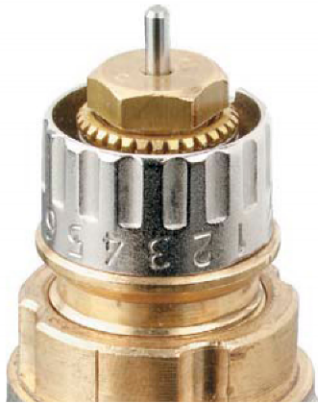
ventila izbere ustrezen ventil.

Tudi izbiro in dimenzioniranje ventila moramo prepustiti strokovnjaku, ki bo upošteval tehnične pogoje (pretok vode, padec tlaka) in možnosti vgradnje (parapeti, niše, način namestitve). Z vrednostmi za potrebno količino vode za ogrevanje v radiatorju in diagramom za padec tlaka za dimenzioniranje termostatskega