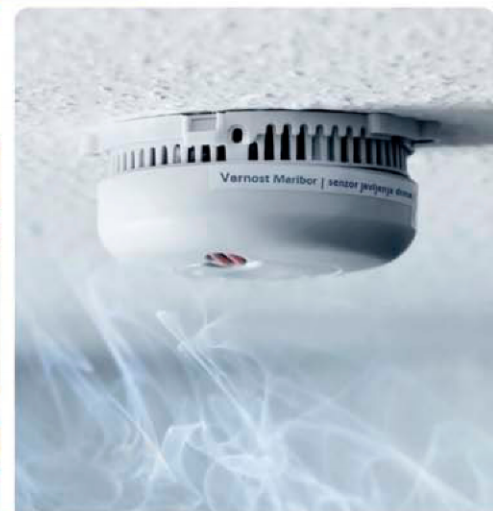
AVTOMATSKO JAVLJANJE POŽARA