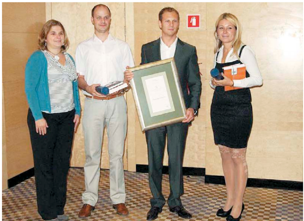
Po lanski zmagi so se Atrium nepremičnine letos veselile posebnega priznanja za delo v izboru za nepremičninsko družbo z odličnostjo poslovanja.

Izsledki letošnjega razpisa kažejo, da se nepremičninske družbe vedno bolj zavedajo pomembnosti odlične spletne ponudbe in predstavitev z najmodernejšimi orodji in marketinško privlačnimi vsebinami. Glede celovitosti ponudbe