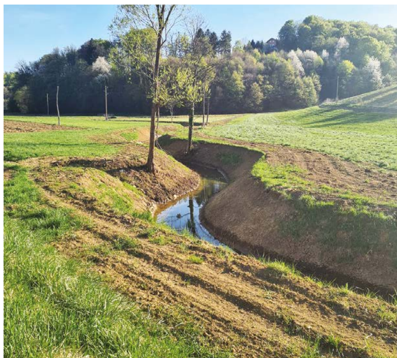
Od Hrastovca do križišča proti Pungračiču so zaključena dela na urejanju vodotoka.