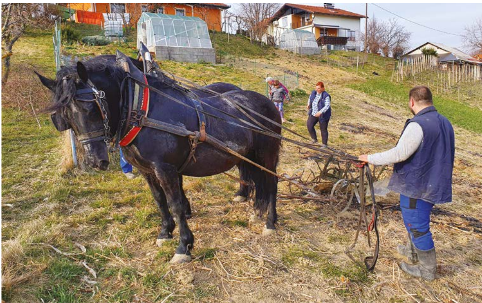
Del njive na Tinkovi domačiji so letos zorali na star način, s konji.

Za nami so tudi velikonočni prazniki. Velika noč ima bogato sporočilo in je med Slovenci priljubljen družinski praznik. Povezan je z obredjem in hrano, ki sta del naše bogate zapuščine in prehajata iz roda v rod. Gospodinje smo v krogu svojih družin poskrbele, da je dišalo po velikonočnih dobrotah. Čeprav je danes mogoče kupiti skoraj vse, pa so še vedno najboljše jedi naših mam, babic in prababic, s kraljico potico v ospredju. Vse premalo se zavedamo, da živimo lepo, in vse premalo in pogosto ne vemo, kaj je najpomembnejše v našem vsakdanjem življenju. V prazničnih dneh nas je spremljal znani rek: »Če človek pol sveta obteče, najboljši kruh doma se speče.«