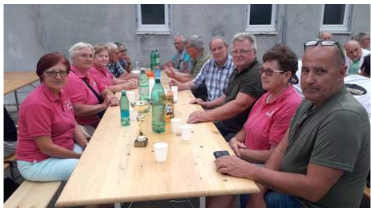
Završki upokojenci se spet družijo ...

Pomlad je v naše kraje prinesla bolj sproščeno vzdušje in več možnosti za druženje. Tudi sproščanje ukrepov nam je to omogočilo. Tega se zavedamo tudi v Društvu upokojencev Zavrč, kjer želimo biti prijaznejši drug do drugega, si med seboj pomagati in sodelovati.