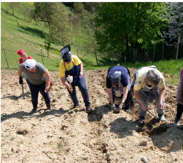
Sejanje koruze kot nekoč

Projekt sofinancira Evropski sklad za razvoj podeželja: Evropa investira v podeželje.