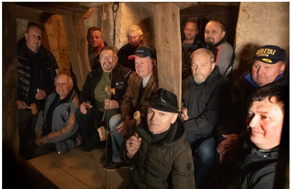
Eden izmed starih običajev je trjančenje, ki so ga opravljali 1. novembra.

Na teh izhodiščih so partnerji zasnovali poslovno zamisel: haloška deska s sodobnimi koncepti trženja in trajnostnega