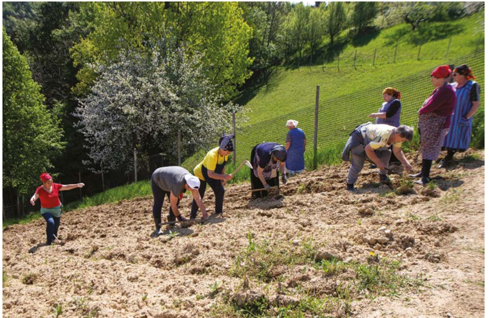
Na Tinkovi domačiji v Pestikah so završke gospodinje prikazale, kako so nekoč pripravili njivo za setev oziroma za sajenje koruze in nato koruzo tudi posejale.

Z dobro voljo in veseljem obujamo spomine na svoje otroštvo in čase, ko so naši predniki bili odvisni predvsem od svojih pridnih rok. V marcu je naše društvo na Tinkovi domačiji v Pestikah organiziralo pripravo njive za setev oziroma sajenje koruze na način naših prednikov (oranje s konjsko vprego, »nakapanje« z motikami). Ob delu je potekalo prijetno druženje, ki smo ga zaključili s slastno domačo malico. Hvala gostiteljem, ki so nam omogočili vse to in snemanje tega dogodka.