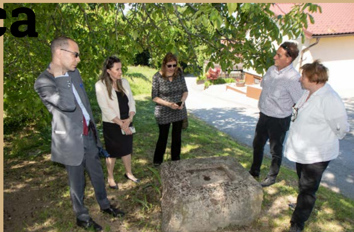
V Turškem Vrhu si je veleposlanica z zanimanjem ogledala ostanke spomenika iz časa turških vpadov.

Na skupnem kosilu so potekali pogovori o možnostih