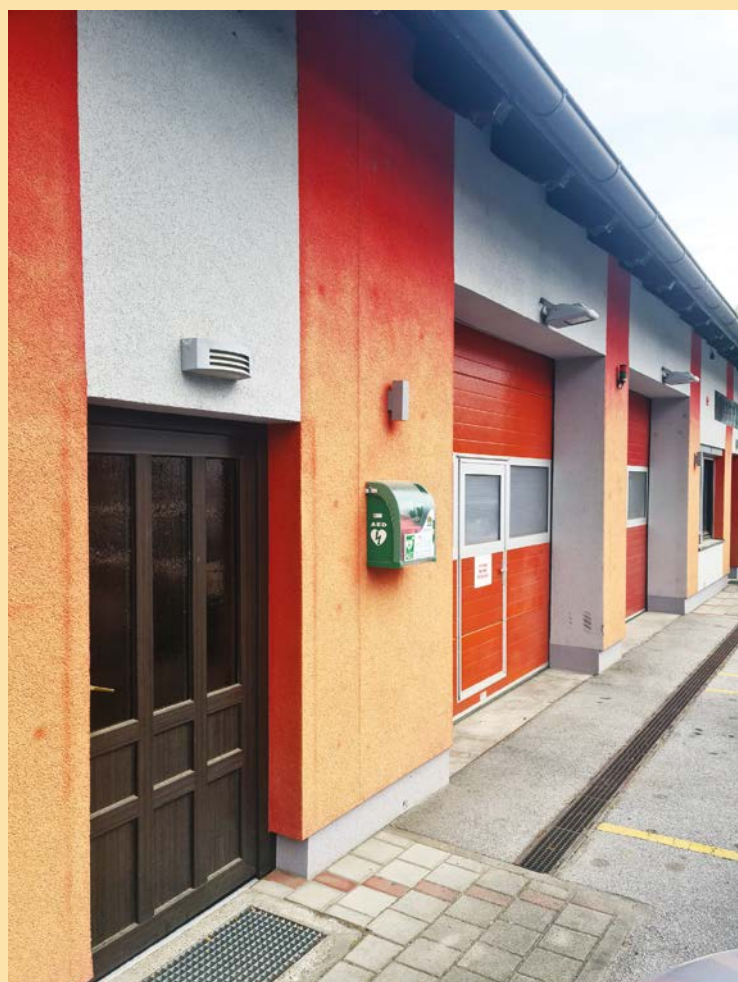
Avtomatski defibrilator je nameščen tudi na završkem gasilskem domu.