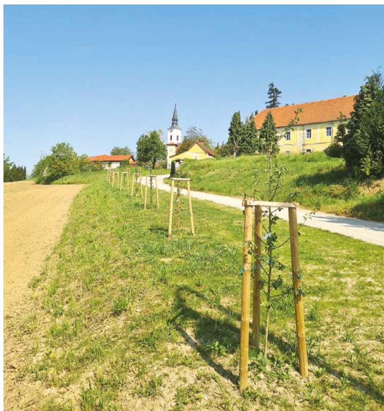
Tuži okolica dvorca od spomladi dobiva vse lepšo podobo.