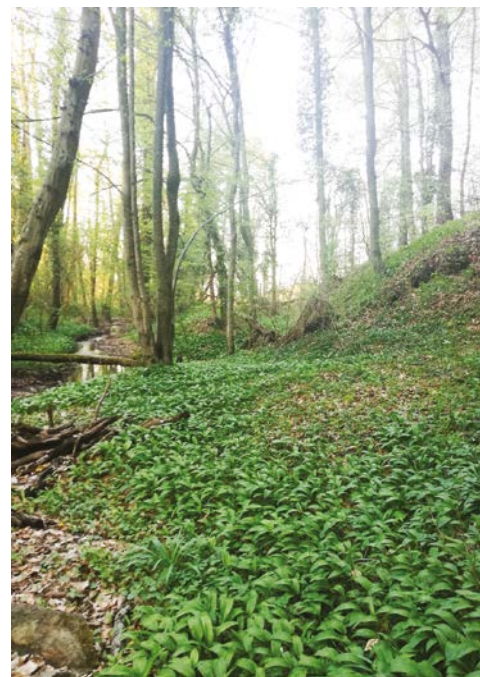
Čemaž lepo uspeva tudi v Halozah.

Značilne vonjave mu dajejo sulfidi, ki sprva nimajo vonja, a ko list zmečkamo, takoj zadišijo. V telesu delujejo razkužilno, razmaščevalno, spodbujevalno in krepčilno. Poleg tega so v listih še druge varovalne in krepčilne učinkovine, med njimi flavonoidi, karotenoidi, klorofil, vitamini in