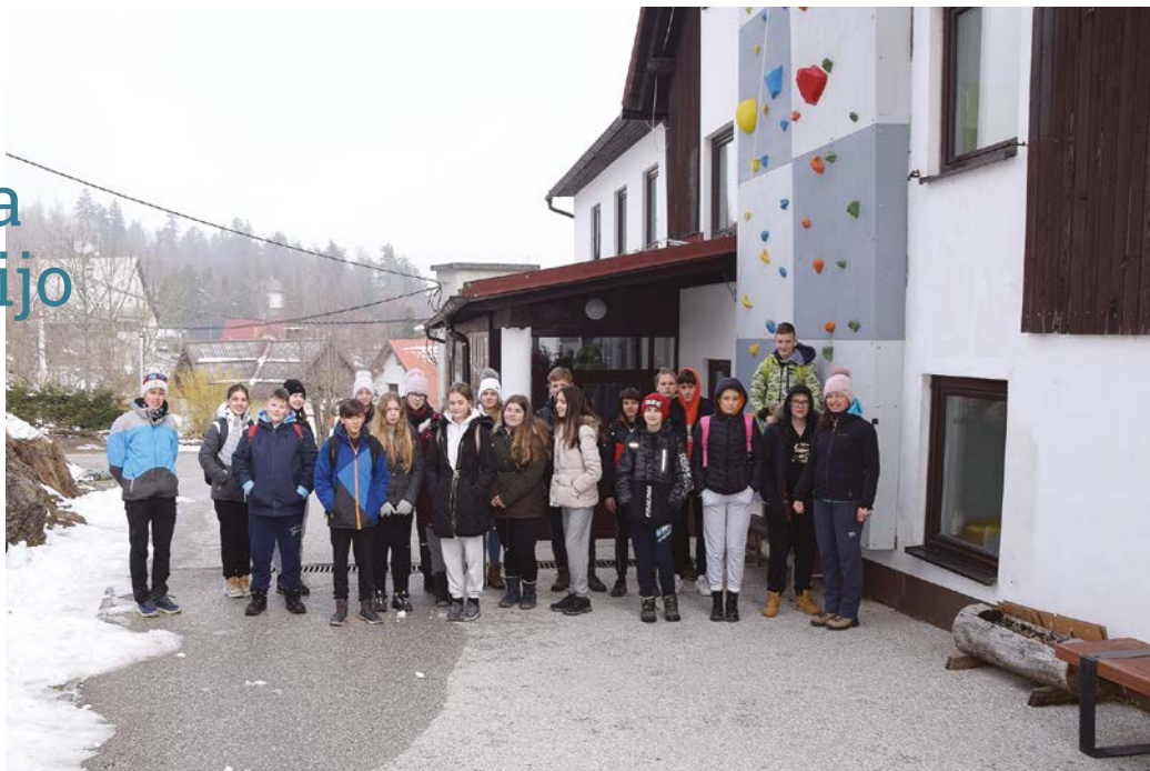
Udeleženci šole v naravi na Vojskem nad Idrijo

P ot do ČŠOD Vojsko je bila zelo zanimiva, zdelo se mi je, da smo v zapletenem labirintu. Ob prihodu je moja pozornost pritegnila plezalna stena. Razmišljala sem, kakšen je občutek na njeni najvišji točki. Po sprejemu smo se seznanili s pravili in se razporedili po sobah. Pogled skozi okno na zasnežene vršace je bil dih jemajoč.