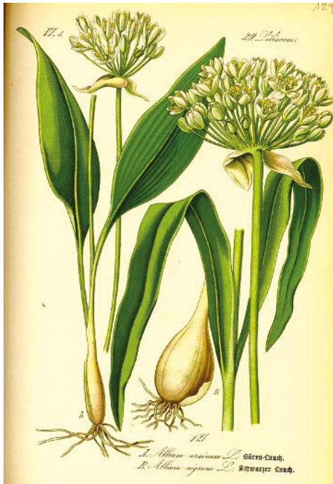
Čemaž, lat. Allium ursinum

Nabiramo lahko mlade liste in cvetove v aprilu ali maju, pozno poleti ali jeseni