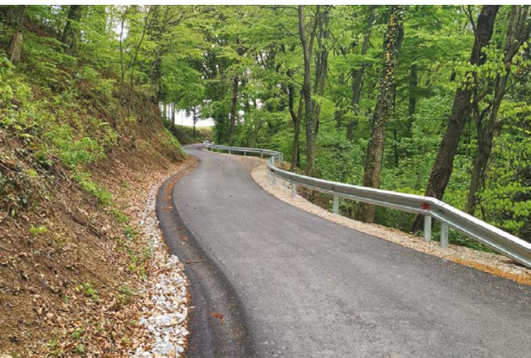
Zaključena je posodobitev ceste v Turškem Vrhu, na odseku od Turškega Vrha 75 mimo Matješa.