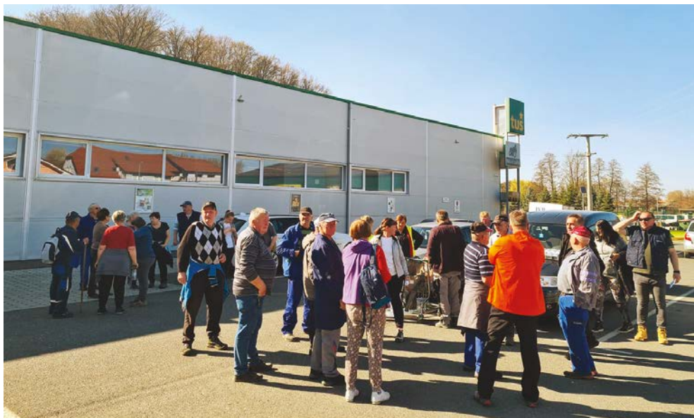
Utrinki z letošnje čistilne akcije po naseljih završke občine

Ob uspešno izpeljani čistilni akciji se v imenu organizatorja – občinskega odbora za gospodarstvo, varstvo okolja in gospodarske javne službe – iskreno zahvaljujemo vsem udeležencem akcije.