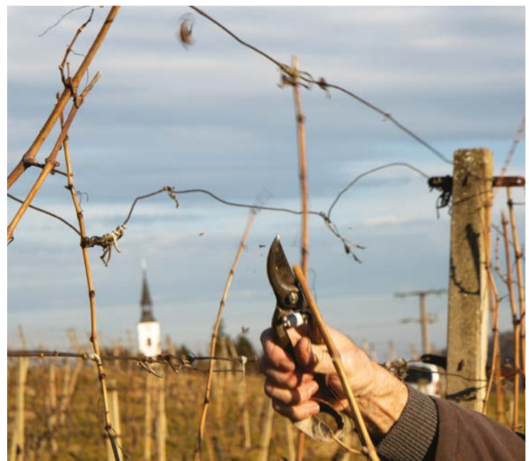
Rez vinske trte