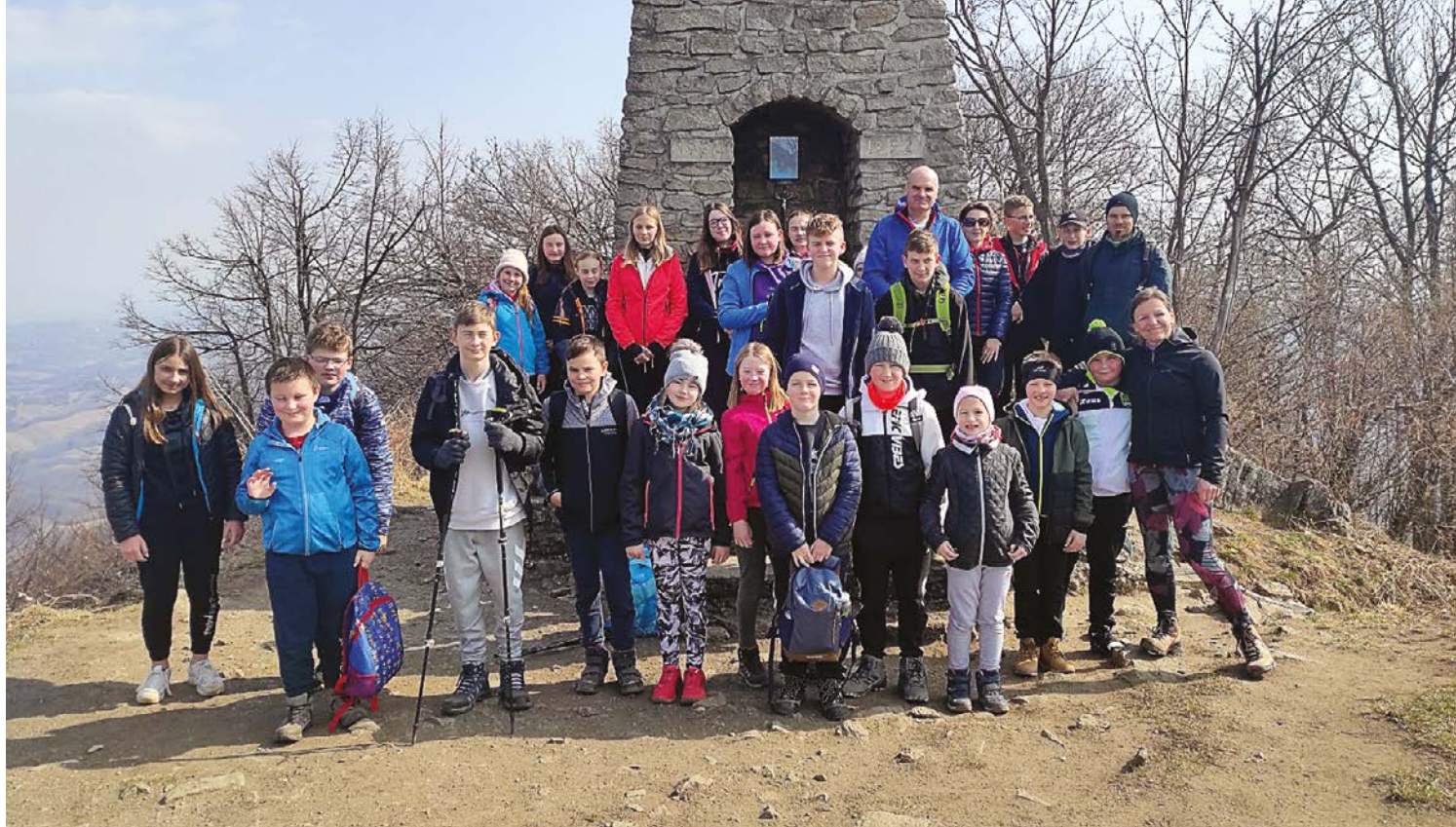
Mladi planinci na Donački gori