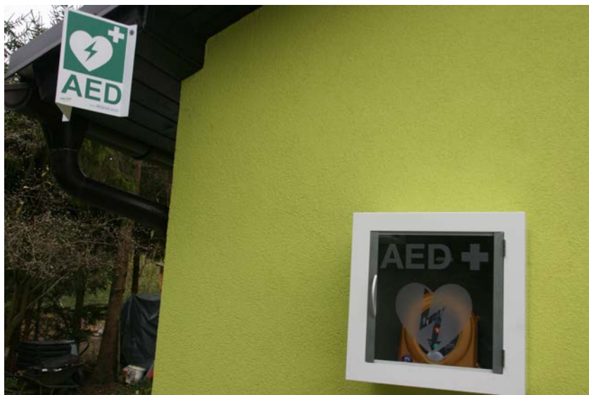
Defibrilatorji na različnih lokacijah po Občini Zavrč