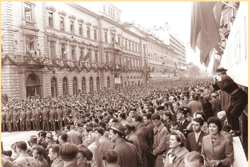
Prvomajski sprevod v Ljubljani leta 1961

Praznik dela (znan tudi kot prvi maj) je mednarodni praznik delavstva, ki ga 1. maja vsako leto praznujejo v večini držav sveta, redka izjema so ZDA. Praznik je izvirno spomin na krvave demonstracije v ameriškem Chicagu v teh dneh leta 1886, znane pod imenom Haymarketski izgred, pa tudi največje praznovanje socialnih dosežkov mednarodnega delavskega gibanja. Prvega maja 1886 so se delavci zbrali na mestnem trgu Haymarket, kjer je po začetnem miru pred policijsko četo vendarle eksplodirala bomba in ubila osem policistov. Na to je policija odgovorila s streljanjem in ranila več deset ljudi. Ker mnogi niso tvegali morebitne aretacije ob obisku uradne zdravstvene pomoči, se je število žrtev ustavilo pri 11. Kasneje je bila pravica do osemurnega delavca kljub vsemu uveljavljena.