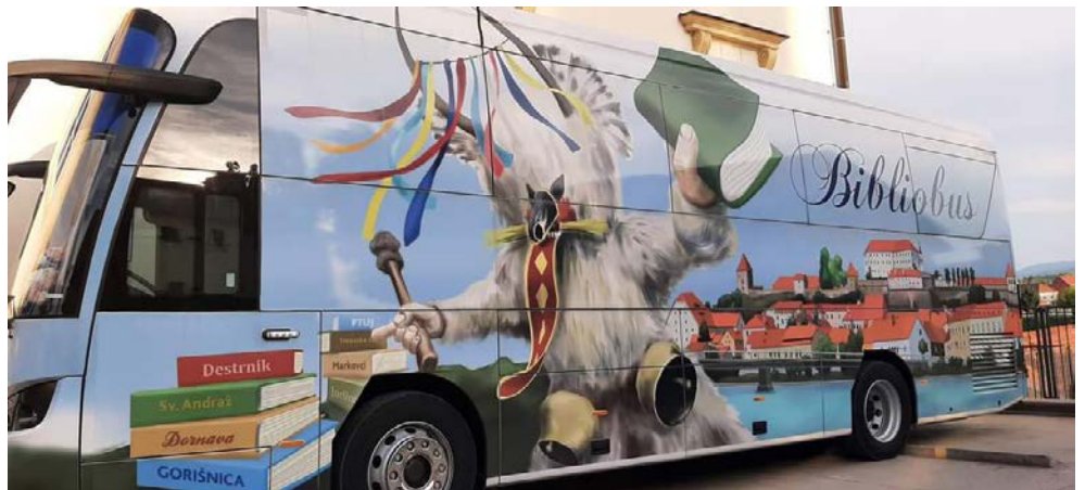
Bibliobus pripelje tudi v Zavrč. Obiščite ga.

Člani KUD Maksa Furjana Zavrč si želimo, da se nam občani pridružite v našem društvu, tako mladinci kot odrasli. Veseli vas bomo. Pripravljene smo poiskati tudi