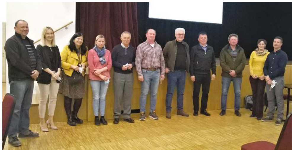
Novoizvoljeni člani organov LAS Haloze

Če se želite včlaniti v LAS Haloze, najdete pristopno izjavo na: https://www.haloze.org/ , lahko pošljete e-pošto na: las.haloze@halo.si ali pokličete na: 02 795 32 00.