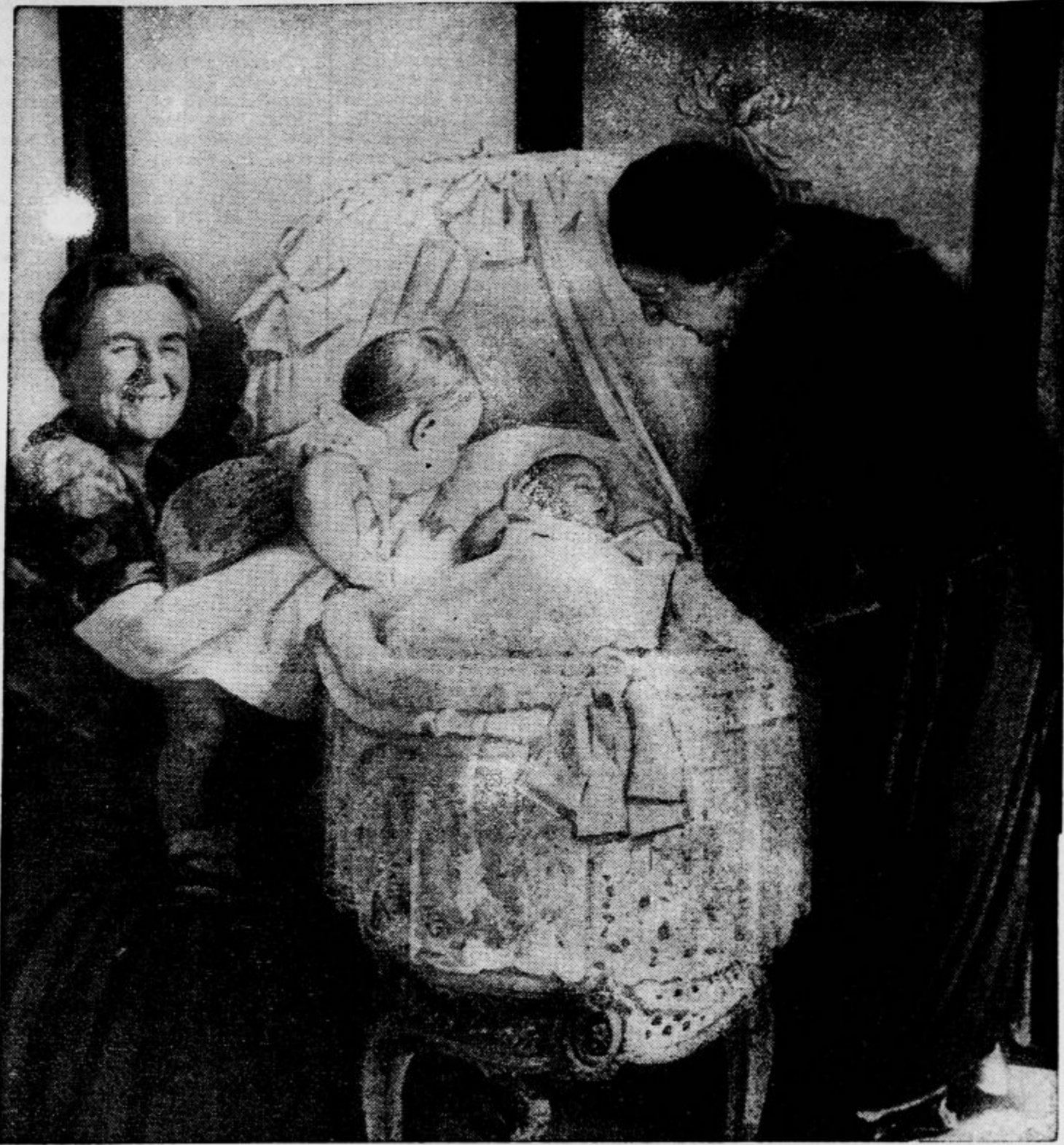
Bodoča holandska prestolonaslednica princesa Julijana na obisku pri svoji sestrični princesi Ireni. Poleg princes: holandska kraljica Vilijemina in princesa Lippe, mati soproga prestolonaslednice Julijane