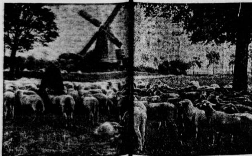
Ovce na holandskem pašniku.