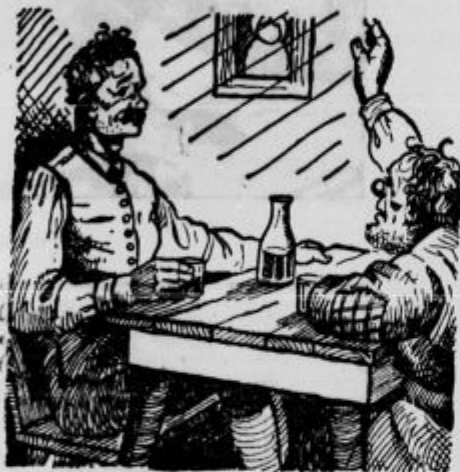
»Rad sem pil surova jajca...«

>Oh, Matajev, saj so bili tvoj oča še dosti starejši, pa so bili ves drugačen. Radi so se kaj pomenili s človekom. Kakor sem menda že rekel, dober možak so bili in pa moder, moder! Poleti so zmerom narobe sedeli na klopec pred hišo, tako da so ti gledali v zid. Zato jih pa tudi skoraj nikoli niso opikali sitni komarji, ker si je mislila mrčes: Ta človek ima tako kosmat obraz, da mu ne moremo do živga! Tako so znali stari Martin gcljufati nadležne živorce in se jim smejali, pa saj so se jim lahko! Ako jih je pa včasih vendarje oklal kakšen star, izkušen komarec, ga pa tudi niso preganjali ali celo morili, ampak prizanesli so mu, rekoč: Kako bi le mogel biti tako nečloveški, da bi stregel po življenju bitju, ki se po njegovih žilah pretaka moja krič!