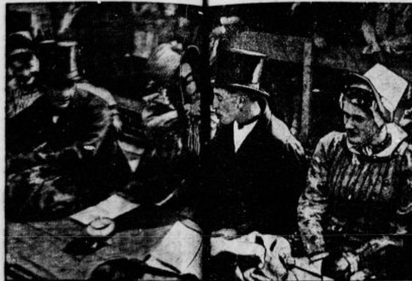
Poroka v Holandskem.

četverijo vso ravan. Kanali z barkami, kanale v barki, gre na dolnu dojit krave, pregleduje svoja polja, stoječ na barčici in se z trnih mlinov in stolpičev cerava. Kanali s pogrom poganja dalje. Tako se stoje vozi iz namesto meje, kanali namesto cest, kanali namesto potov, kanali namesto steza. Kmeti v kanalu, namesto vrat, dvigalni mostiček.