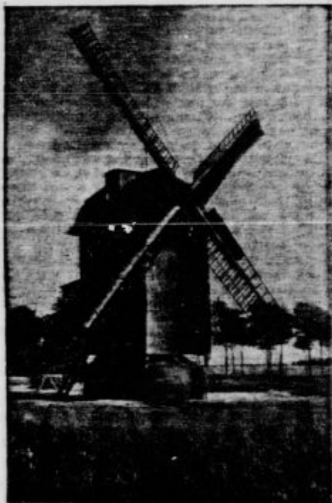
Mlin na veter.