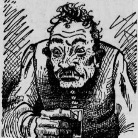
»Pa ne da bi imel celo tiste „Črne bukve“?<

>To bi bila meni prava malenkost!< se je od-