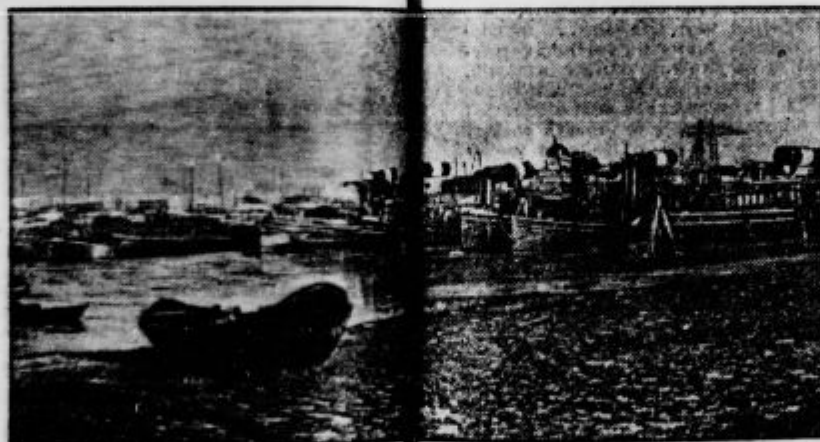
Pristanišče v Amsterdamu.