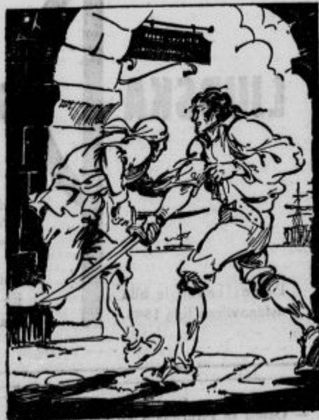
Strahotno je zamahnil proti njemu

Kmalu je izginil v daljavi, kapitan pa je ostal na vratih in gledal ves zbežan predse. Precej časa je ostal tako. Končno pa se je stresel,