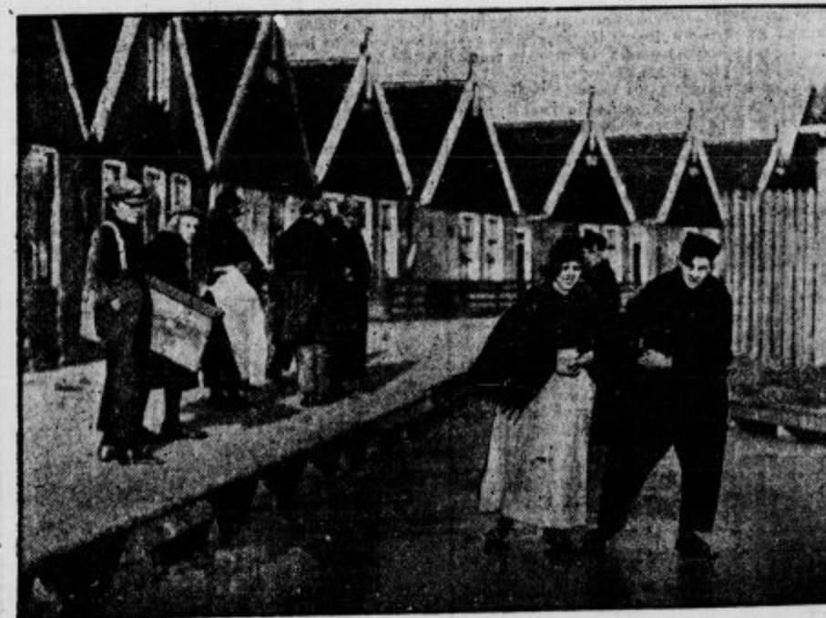
Holandski ribiči se drsajo.