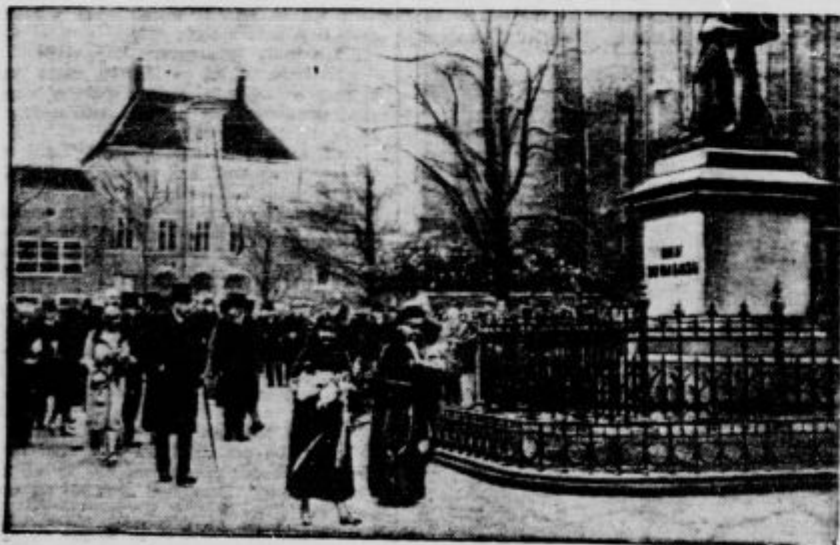
Del holandskega mesta Utrechi.

Holandci pa že sedaj skrbijo, komu naj razdele novo morsko dno. Kmet iz Friskega ne mara zapustiti svojih pašnikov in lukar iz Haarlema se noče ločiti od svojih razorov. Treba bo desetič, preden bo iz slanega pašnika postala rodovitna in suha prst. Majhni vlaki na igračkastem nasipu pa vozijo neugnano dalje in holandski narod gradi dan za dnem delo, čeprav bo šele bodočim pokoljenjem prineslo kolač mira in tulipanovih čebulic, ki dajejo pridnim Holancem že danes milijonsko vsote dobička.