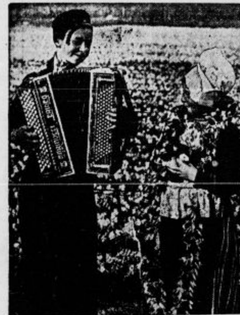
Spomladanska pesem med tulipani.