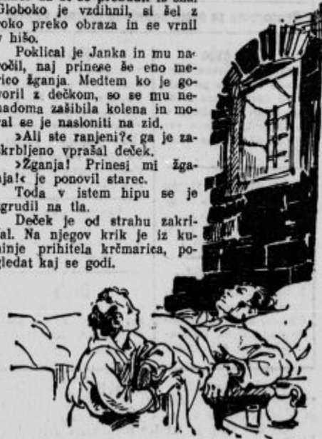
»Dragi dečko, z menoj je končano...«

Deček je od strahu zakričal. Na njegov krik je iz kuhinje prihitela krčmarica, pogledat kaj se godi.