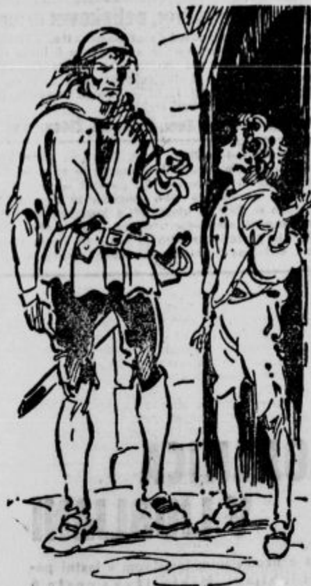
»Deček,« ga je vprašal...

Janko je bil še v svoji spalnici. Toda videl ga je, kako se je počasi oddaljeval proti rtiču. Kmalu nato je nekdo potrkal na vrata krčme.