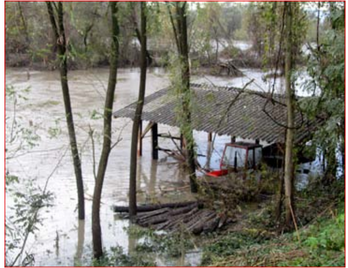
Na območju Ptujja je poplavlilo okrog 60 ha kmetijskih površin.