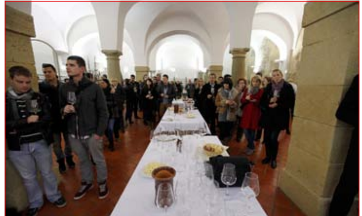
Festival je v petih koncih tedna obiskalo okrog 4000 obiskovalcev.

decembru ponovno povezali z dobrodelnostjo.