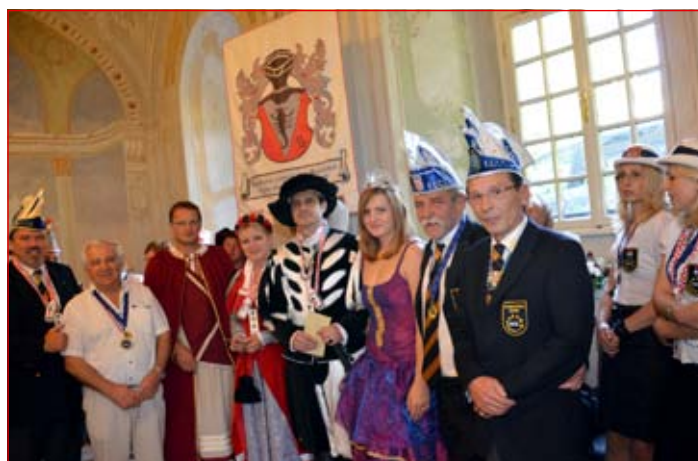
Iz zaključnega srečanja karnevalov FECC na karnevalu oktobra v Ludbregu na Hrvaškem

Z Ludbregom ima Ptuj podpisano pismo o sodelovanju na karnevalskem področju in obujanju rimske zgodovine. S temi