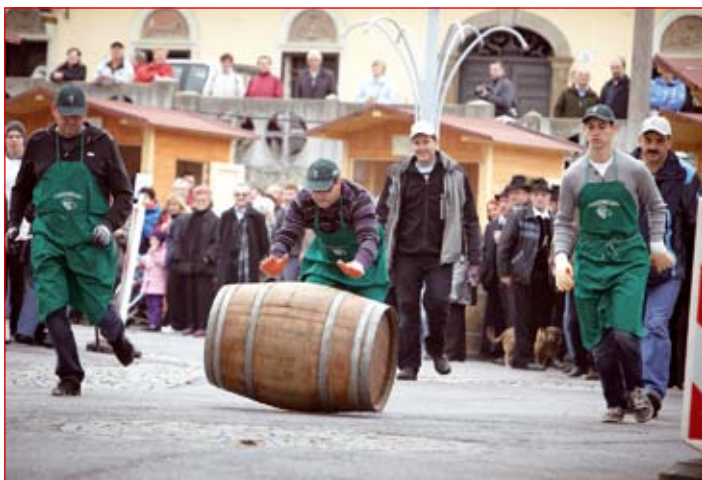
V vinogradniških igrah se je pomerilo sedem ekip, med katerimi so bili najboljši člani ekipe Vinogradništva Rebernišek.