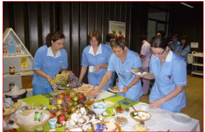
Ptujška bolnišnica se je pridružila vseslovenskemu projektu in svojim zaposlenim pripravila tradicionalni slovenski zajtrk.

Ministrstvo za kmetijstvo in okolje je vsa druga ministrstva, javne zavode, društva, organi-