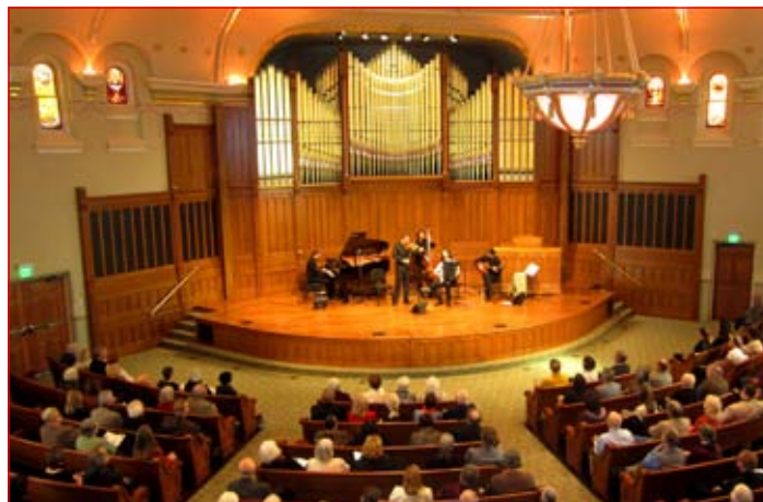
Člani zasedbe Ars Tango Ensemble so navdušili v Indianapolisu.