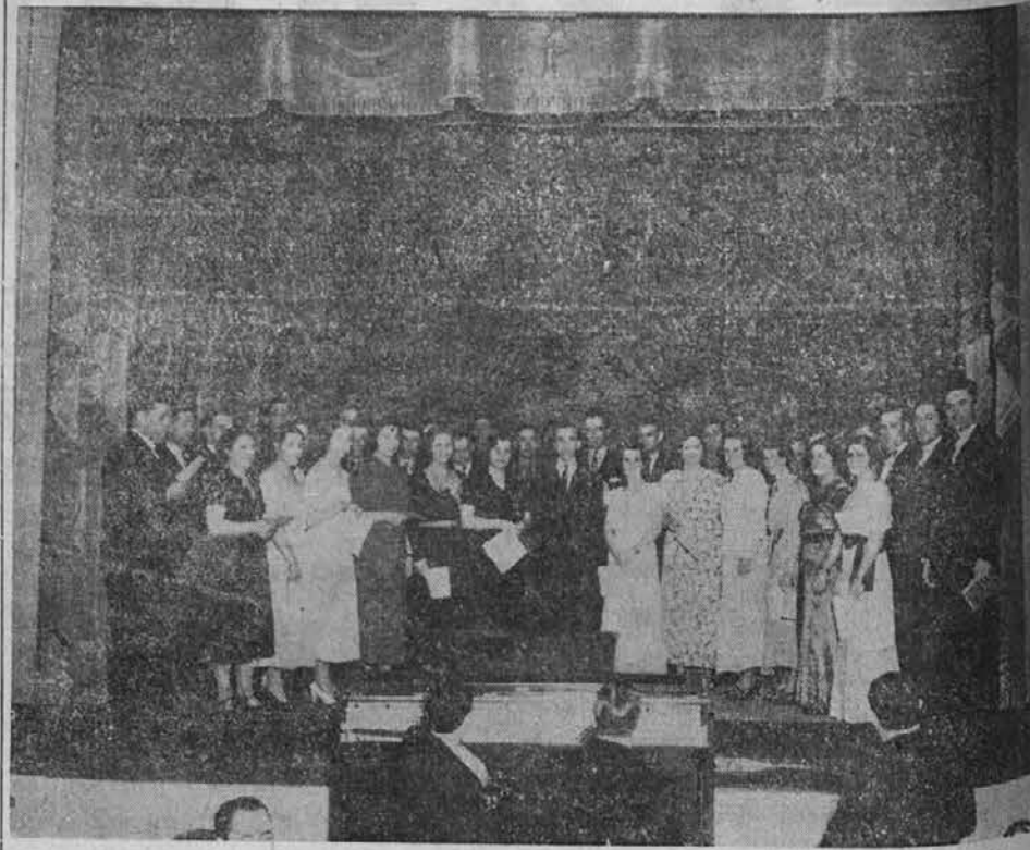
Pevski zbor Slov. prosv. društva I.

Pravica je v tem slučaju precej počasi poslovala, vendar pa so ob- sodbe stroge in jih ves tisk odobra- va kot najbolj primerno sredstvo za preprečitev nadaljnjih podobnih zlo- činov v Argentini.