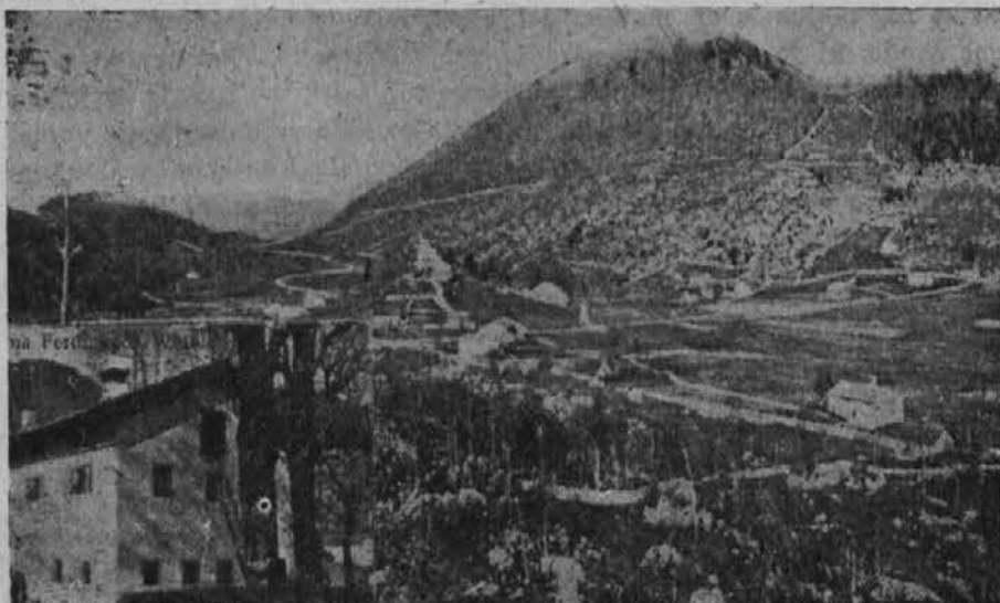
Lokov in Trnovski gozd