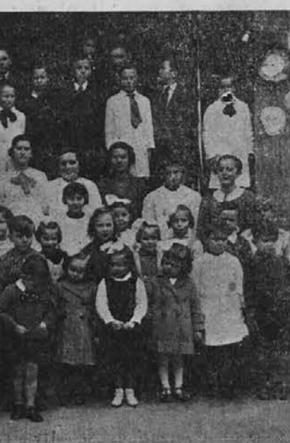
Skupina otrok slov. šole na Paternalu

Slovensko Primorje, danes ko zaključujemo pouk našega jezika, katerega se učimo z ljubeznijo in pono-