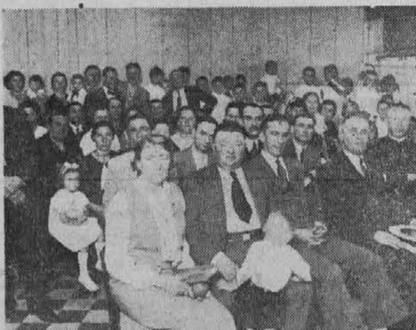
Del občinstva pri zaključni šolski slavnosti.