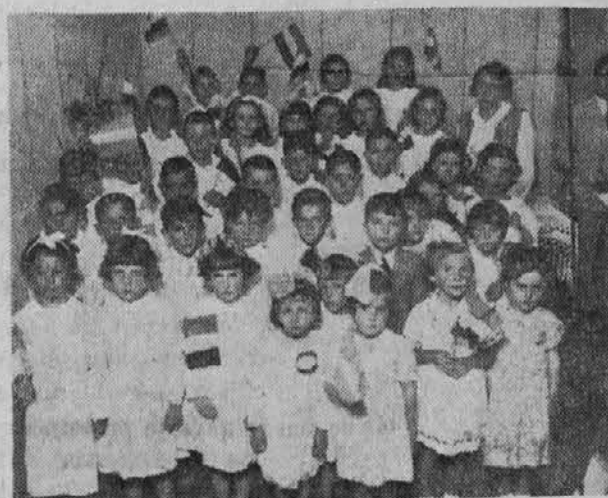
Skupina dock-sudskih šolarjev