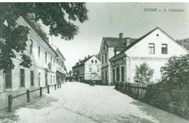
Današnja Cesta XIV. divizije v Štorah pred 1. svetovno vojno

Cesta XIV. divizije je največja in tudi najstarejša ulica v Štorah. Po podatkih Statističnega urada Republike Slovenije obsega 54 hišnih števil in se vije ob glavni prometni cesti Celje-Šentjur-Rogaška Slatina in železniški progi Celje-Maribor v Spodnjih Štorah. Večina stavb današnje Ceste XIV. divizije je bilo zgrajenih med letom 1880 in 1. svetovno vojno, kot so železniška postaja, stara šola in pošta v Štorah, tudi večstanovanjski objekti za železarske delavce, stare gostilne in drugi gospodarski objekti.