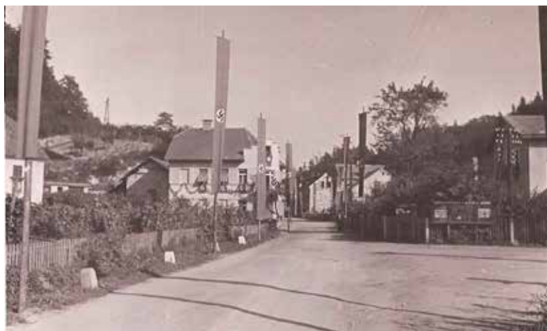
Spodnje Štore med 2. svetovno vojno

6. januarja 1944 se je tako iz Suhorja v Beli Krajini odpravilo na svoj pohod 1112 borkov in borcev. Zaradi prejšnjih neuspešnih prehodov čez Savo na štajersko stran so se odločili za