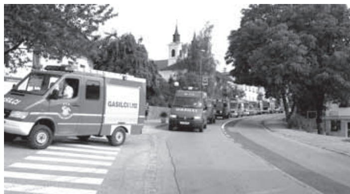
GASILSKA VOZILA NA PARADI