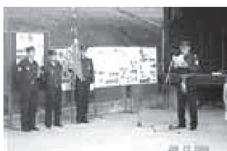
15. OBLETNICA OSAMOSVOJITVE, KRESOVANJE V VELIKIH LAŠČAH