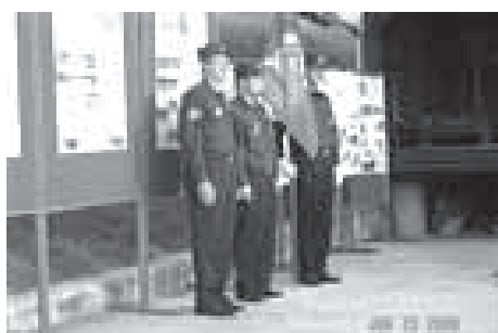
S PRAPOROM OB PRAZNIKU