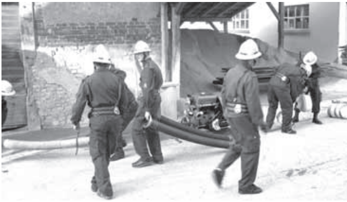
MLADI ČLANI PGD ROB SO PRIKAZALI TRODELNI NAPAD.

PGD Rob se zahvaljuje vsem, ki so kakorkoli pomagali pri pripravi proslave ob 80-letnici in pri izvedbi gasilske veselice. Zahvaljujemo se vsem, ki so prispevali dobitke za srečelov, in gasilcem iz sosednjih društev, ki so se udeležili slovesnosti.