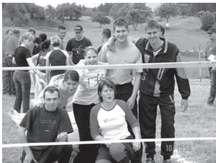
EKIPA IZ LAŠČ

Prva igra je bila skakanje v veliki vreči, v katero se je 'stlačilo' vseh šest tekmovalcev. V tej igri smo zasedli 2. mesto. Naslednja igra je bila nošenje pijanega moža, to pomeni, da si je dekleta na glavo dalo vrč z vodo in steklo do sotekmovalca, ta pa jo je štiporamo prenesel nazaj na začetek, seveda čim hitreje in s kar najmanj polite vode. Tudi v tej igri smo bili drugi. Najbolje pa nam je šlo od rok grabljenje in zdevanje sena v mini kozolček, tu smo prehiteli vse ekipe. Najslabše smo se odrezali v igri, kjer smo s človeško samokolnico prevažali polena in zasedli tretje mesto. V zadnji igri smo pobirali tlakovce v vedro tako, da smo dekleta imela zavezane oči, fantje pa so nas usmerjali in zopet smo bili drugi.