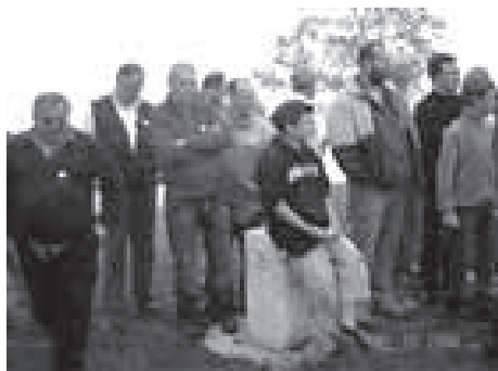
STROKOVNA ESKURZIJA - PO POTEH SOŠKE FRONTE