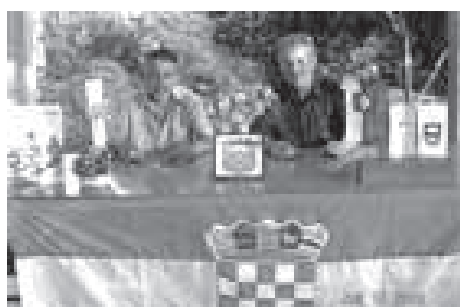
PODPIS POGODBE O SODELOVANJU Z USDR DUBROVNIK, JUNIJ 2006