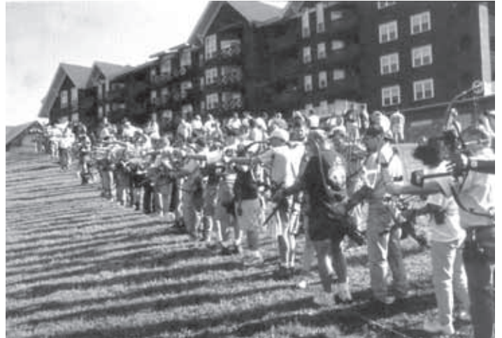
POSKUSNI STRELI – OGREVANJE PRED ZAČETKOM TEKMOVANJA

Tekmovanje je potekalo tri dni. Postavljenih je bilo 23 tekmovalnih prog po 20 živali. V vsaki skupini je bilo po 5 tekmovalcev, skupine pa so spuščali na progo na deset minut – leteči start. Streljalo se je dva dni, vsak dan na drugi prog. Proge so bile precej zahtevne. Tretji dan pa je bilo finalno streljanje. Kot zanimivost lahko povem, da je to področje črnega medveda in da smo vse tri dni poslušali poke lovskih pušk, saj so lovci na tak način odganjali medvede od tekmovalnih prog in nam tako zagotavljali varnost.