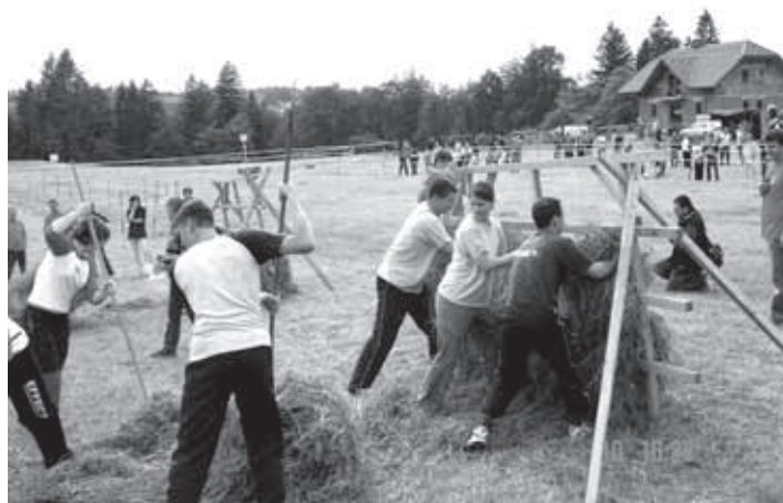
LAŠČANI V AKCIJI EDINA IGRA V KATERI SMO ZMAGALI

Po dolgotrajnem sodniškem seštevanju in preštevanju točk smo ob 20. uri le dočakali razglasitev rezultatov. Z ekipo s Slemen smo dosegli enako število točk, vendar so oni zmagali v dveh igrah, mi pa le v eni, zato je skupna zmaga odšla na Slemena, Laščani smo zasedli drugo mesto, ekipa Nevtralia tretje in ekipa domačinov zadnje mesto. Vse ekipe so dobile priznanja in praktične nagrade, prve tri tudi pokale, zmagovalna ekipa pa je prejela še denarno nagrado.