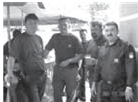
VETERANSKE ŠPORTNE IGRE, SLOVENSKE KONJICE