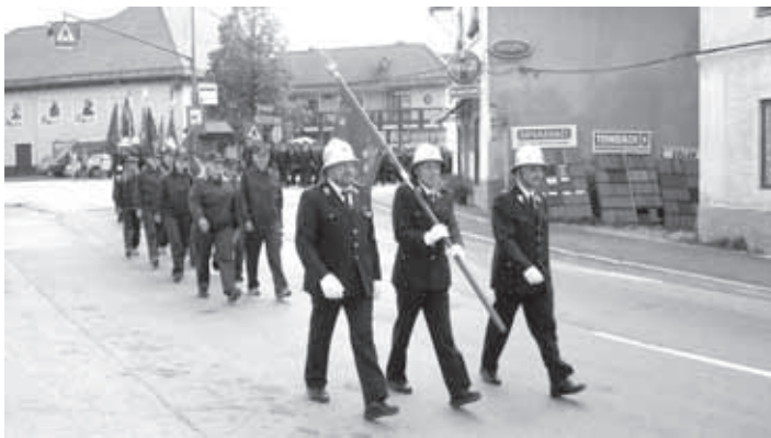
MIMOHOD GASILCEV SKOZI VELIKE LAŠČE