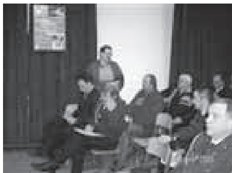
LETNI ZBOR OZVVS VELIKE LAŠČE 2006