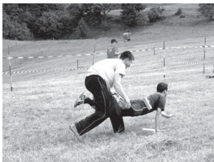
TUDI VOŽNJA S 'SAMOKOLNICO' NI VEDNO LAHKA