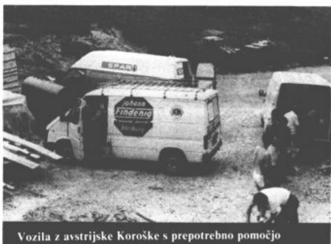
Vozila z avstrijske Koroške s prepotrebno pomočjo