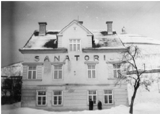
Sl. 2. Sanatorij dr. Benjamin Ipavca v Mariboru.