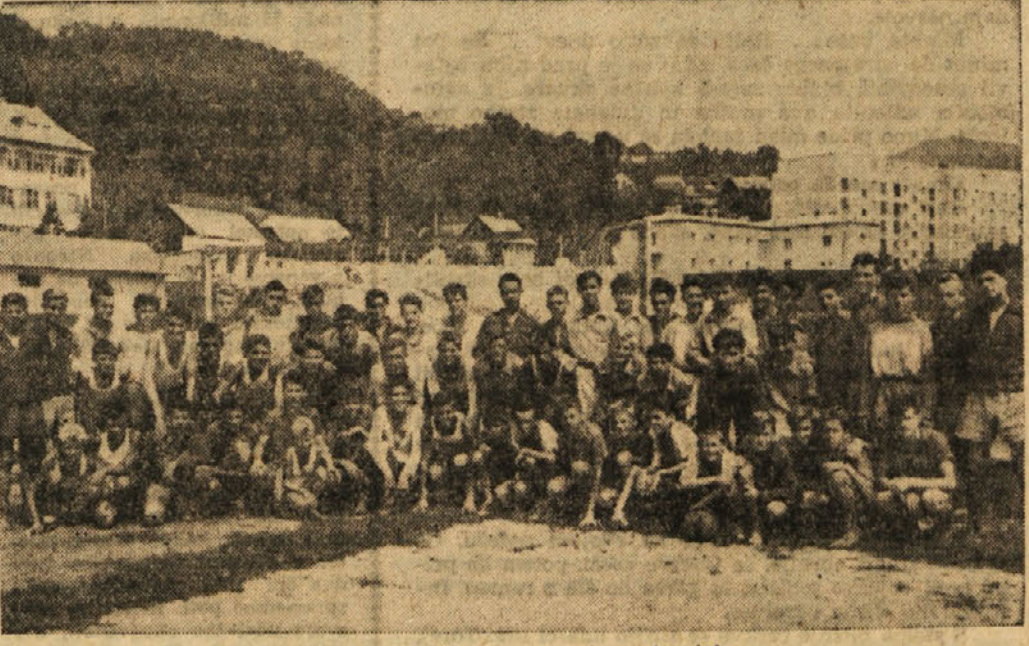
Zbrani pionirji na nogometnem turnirju