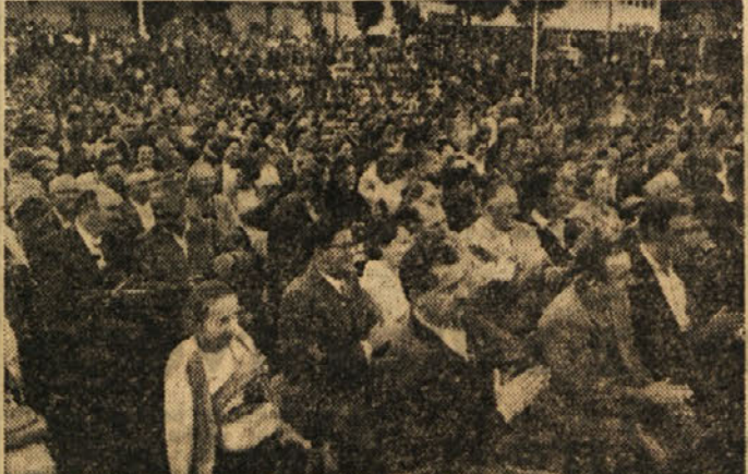
Pogled na množico ljudi na izseljenskem dnevu v Trbovljah

kraju. Kako sveži so še spomini na dom, na mater in očeta, na vseh osem bratov in sestra, od katerih je eden padel kot partizan. In če se le da, se vsako leto vrača. Ko prihaja gori v domač kraj, ga najprej pozdravi lep Zadrufni dom, ki ga nekoč ni bilo, zdaj pa vidi, da grade iz Renk tudi novo vozno pot. Ponosen je na svoje ljudi in na svoj kraj. — Kaj pa Trbovlje? »Trbovlje so se ta leta čudovito razrastle, skoro bi jih ne prepoznala«, ugotavlja oboja s kolegom Jazbinškom. In končno: »Današnje popoldne nama bo še dolgo dolgo ostalo v lepem spominu.« x x x Spet je bilo slišati pesem. Gori na Tereziji so se prižigale luči. Rojak je nazdravil rojaku: »Na svidenje drugo leto!«