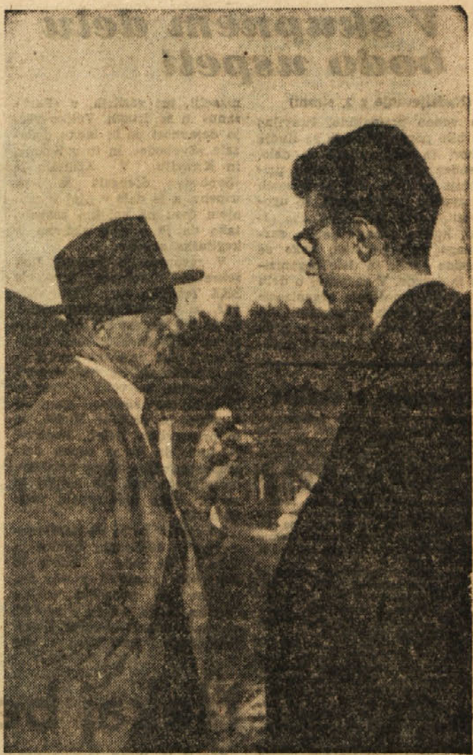
Naš sodelavec v razgovoru z rojakom Cebinom

Odšel je sredi zime, 29. januarja 1938. leta. Njegov konar je bil negotov. Poslavljati se je od domovine. Čez štiri mesece je prišla za njim v svet še žena in četrto njegovih otrok. Zdaj dela v Merlebachu, v Franciji. Z leti je postalo življenje boljše. Ustvaril si je dom, žena mu je rodila še eno dete. Dva sinova sta sedaj že odrasla in postala sta rudarja. On pa ob večerih, še posebej na pomlad, še vedno sanja o idilični vasici nad Renkami v Zasavju, o svojem rojstnem kraju.