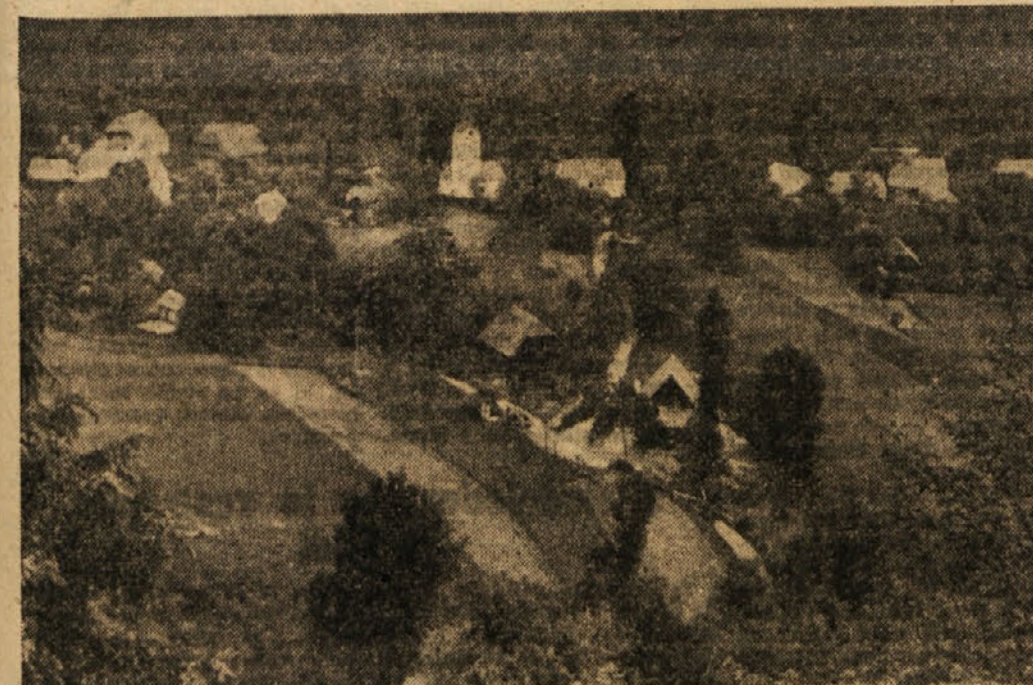
Konjšica: V ospredju nov Kulturni dom, odprt junija 1955