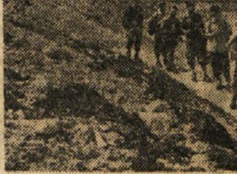
Ob enem izmed Triglavskih jezer

Pot nas vodi položneje skozi tešen dolec, nato pa se odepeljemo nizdol k zadnjemu Triglavskemu jezeru, imenovanemu Črno Jezero. Ko smo premagali Komarčo, namopmo, toda zanimivo hojo, kakšnih 800 metrov iznad vznožja.