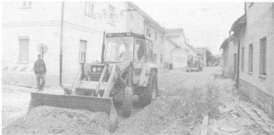
Cesta IV bo kmalu dobila asfaltno prevleko

V kulturnem programu pa se bodo predstavili mladi Rožnodolčani s svojimi vrstniki, ki obiskujejo tamkajšnje vzgojno varstveno ustanovo oziroma nabirajo znanje v osnovnih šolah Marjan Novak-Jovo in Majde Vrhovnik.