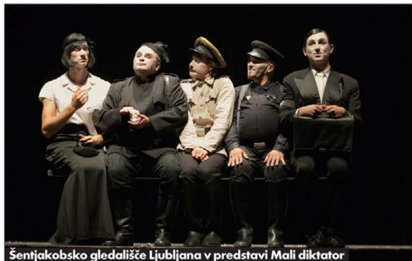
Šentjakobsko gledališče Ljubljana v predstavi Mali diktator