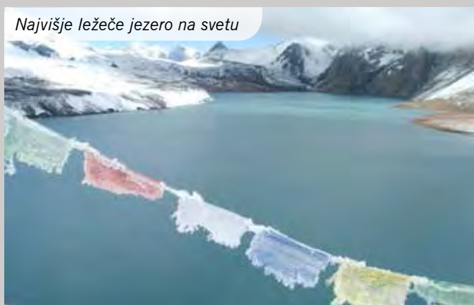
Najvišje ležeče jezero na svetu