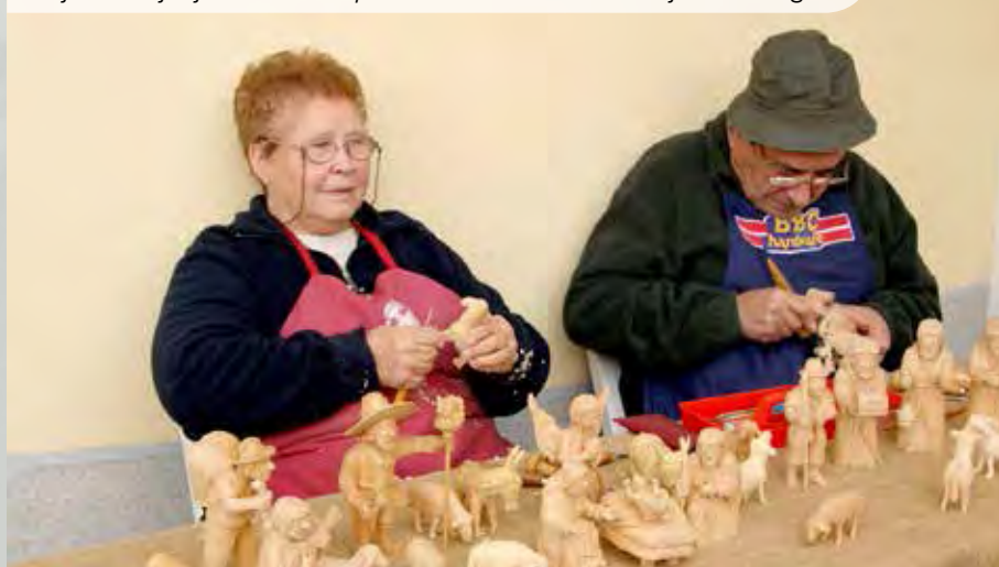
Svoje ustvarjanje sta večkrat pokazala na Mihaelovem sejmu v Mengšu