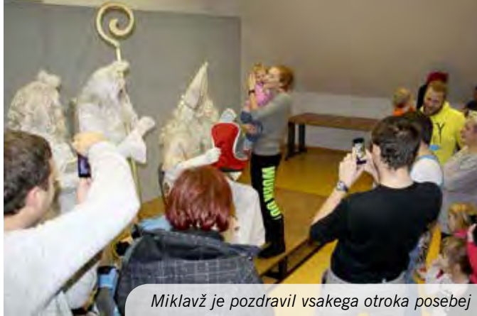
Miklavž je pozdravil vsakega otroka posebej

Potem ko se je sveti dobnik malo razgledal po dvorani in pozdravljal mlado in staro, je sprejel vsakega otroka posebej, z njim malo pokramljal in mu izročil darilce, v katerem je bil čisto pravi nahrbtnik in čisto malo sladkarij. Ob koncu se je poslovil, rekoč, da bo prišel tudi drugo leto, če ga bo le Kul-