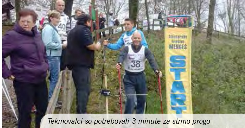
Tekmovalci so potrebovali 3 minute za strmo progo

8. novembra 2014 smo izpeljali že tretji suhi slalom na Mengeški Gobavici. Očitno se glas o takšni vrsti slaloma dobro sliši naokoli, saj je vsako leto več prijavljenih tekmovalcev.