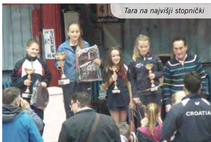
Tara na najvišji stopnički