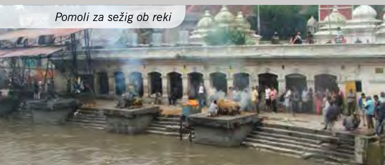
Pomoli za sežig ob reki