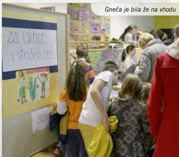
Gneča je bila že na vhodu