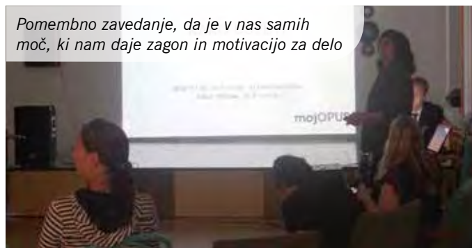
Pomembno zavedanje, da je v nas samih moč, ki nam daje zagon in motivacijo za delo