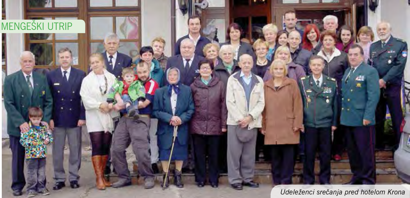
Udeleženci srečanja pred hotelom Krona