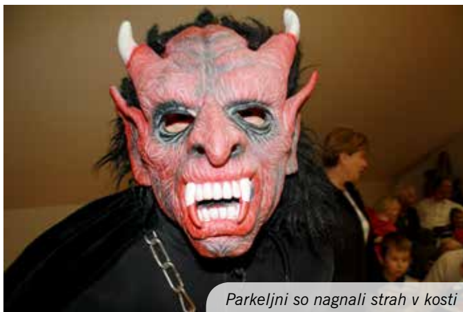
Parkeljni so nagnali strah v kosti

turno društvo Antona Lobode povabilo in mu naročilo darila. Veselo je pomahal v slovo in s svojim spremstvom odhitel v temno noč še k drugim otrokom, ki so ga prav gotovo tudi težko čakali.