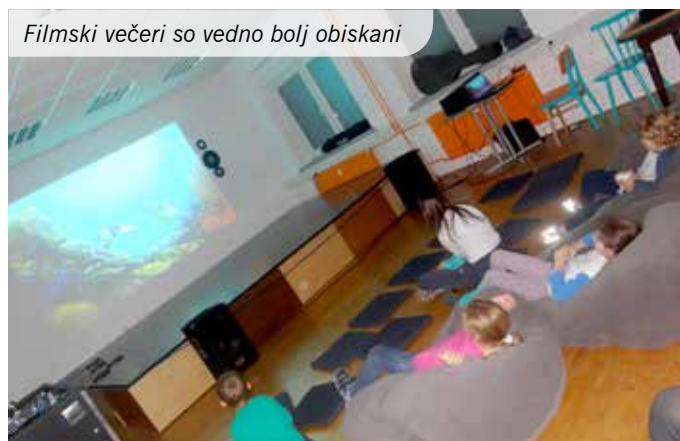
Filmski večeri so vedno bolj obiskani