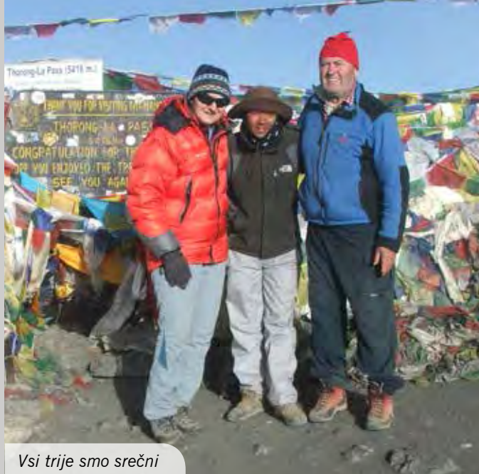
Vsi trije smo srečni

Zjutraj je bilo nebo polno zvezd in bilo je mrzlo, a čisto mirno. Ko sem po dveh urah hoje mislil, da je polovica obljubljenega vzpona opravljena, sem presenečen zagledal tablo s čestitko,