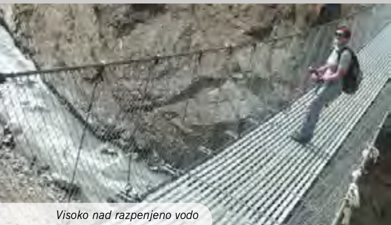
Visoko nad razpenjeno vodo