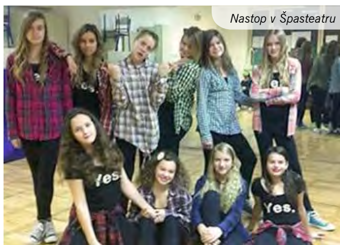
Nastop v Špateatru