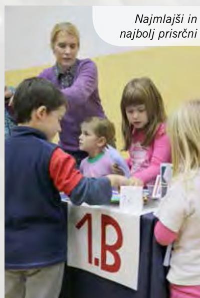
Najmlajši in najbolj prisrčni