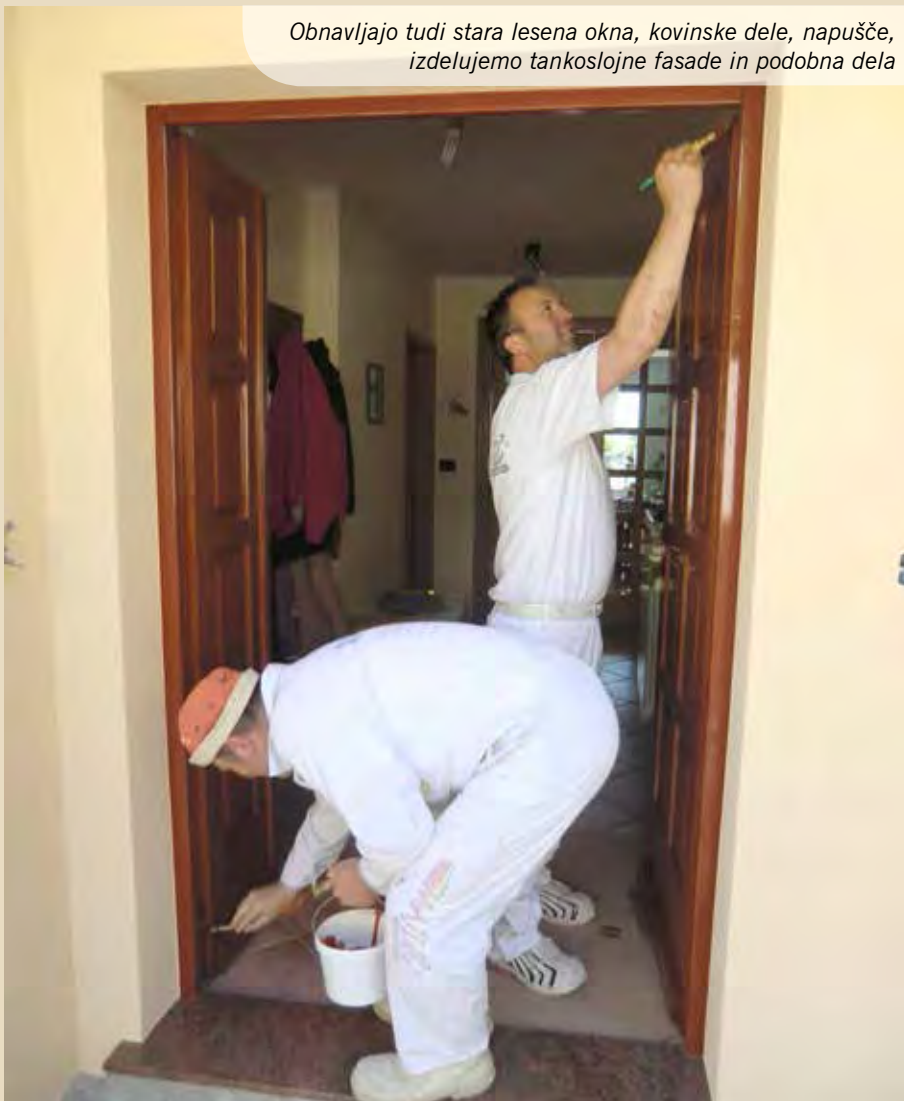
Obnavljajo tudi stara lesena okna, kovinske dele, napušče, izdelujemo tankoslojne fasade in podobna dela

Leta 2001 sem naredil izpit za slikopleskarskega mojstra na OOOZ, leta 2008 pa izpit za sodnega cenilca in izvedenec v obrtni dejavnosti. Kot cenilec in izvedenec veliko brezplačno svetujem. Predvsem pa sodelujem s Heliosom