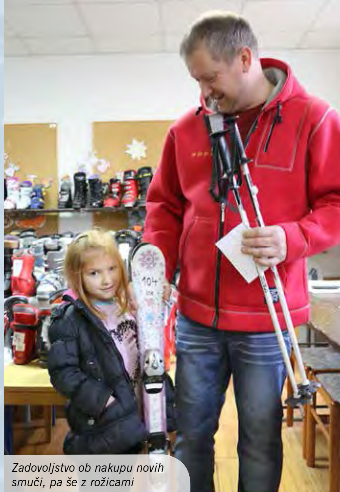
Zadovoljstvo ob nakupu novih smuči, pa še z rožicami