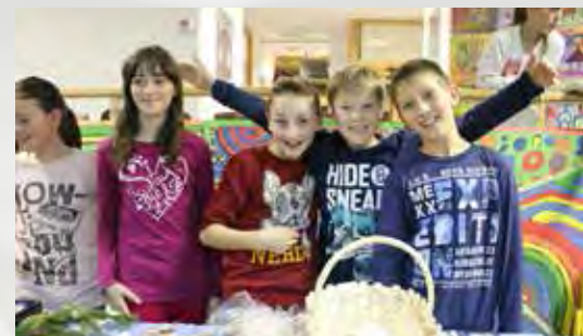
Iskrice so bile tudi na strani prodajalcev