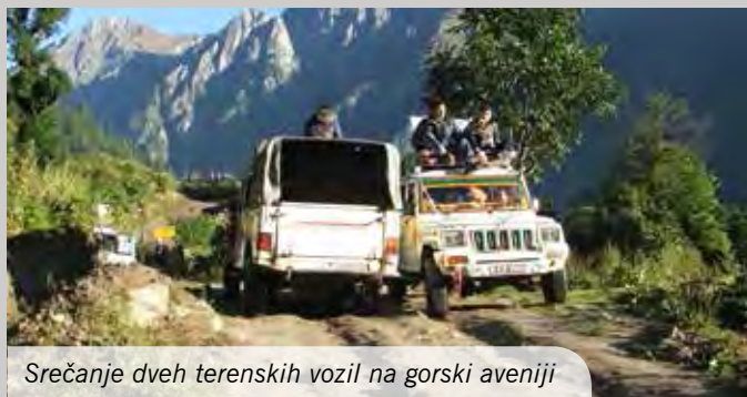
Srečanje dveh terenskih vozil na gorski aveniji