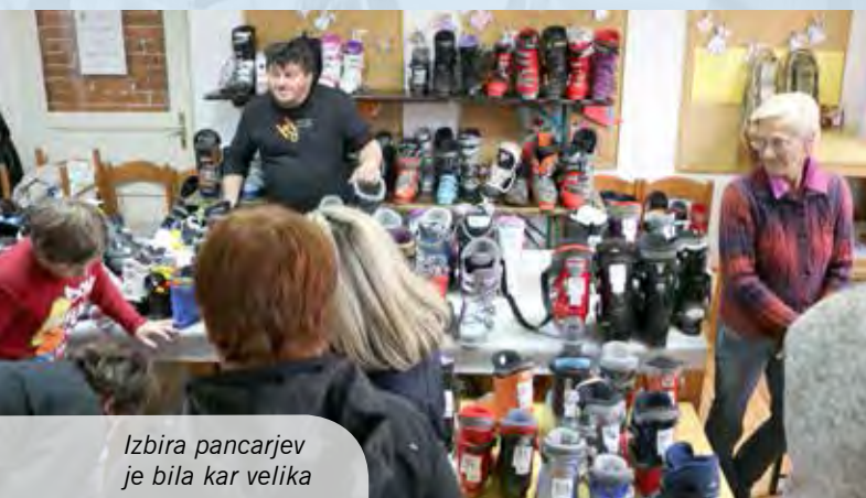
Izbira pancarjev je bila kar velika