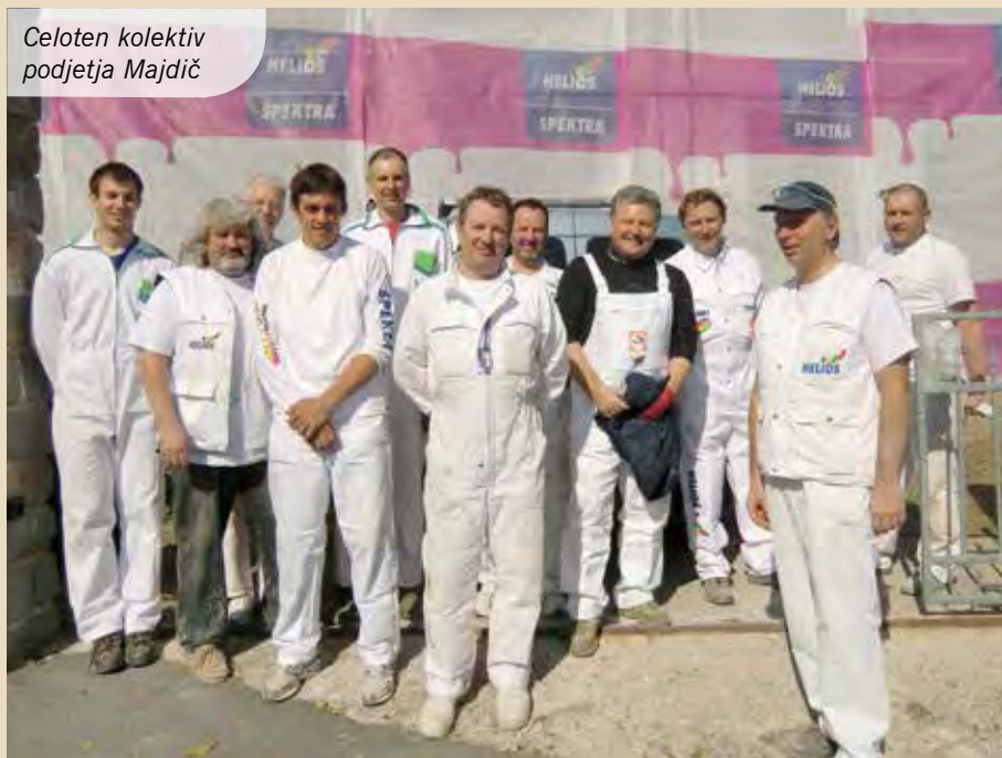
Celoten kolektiv podjetja Majdič