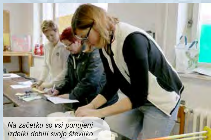
Na začetku so vsi ponujeni izdelki dobili svojo številko